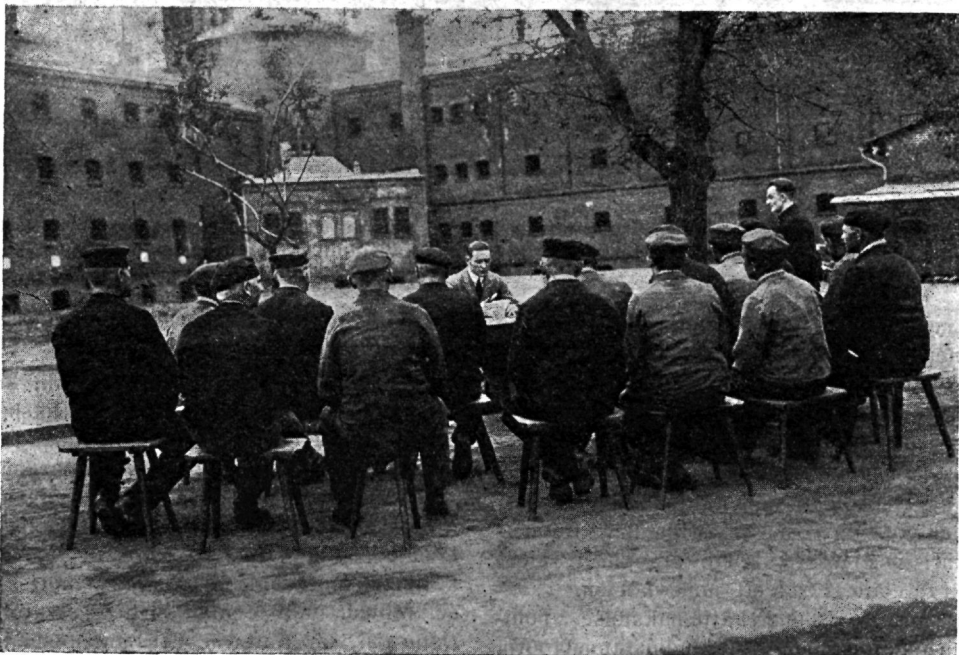
Wabaõhukool õpetaja juhatusel.

psüüholoogia ja psühiaatria enesega kaasa on toonud kuritegija arwustamiseks ja lugupidamiseks elanikkude teoreetilisest kokkukõlast seltskonna ja kuritegijate wahel, sellepärast püütakse karistuse