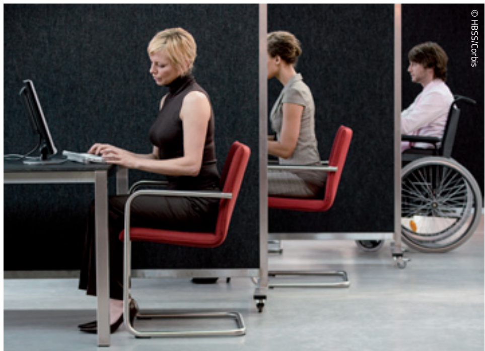
Euroopa Kohus tagab Euroopa Liidu seaduste järgimise. Näiteks on kohus oma otsusega kinnitanud, et puuetega töötajate diskrimineerimine on keelatud.

Komisjon on oma tegevuses üsnagi sõltumatu. Tema ülesanne on seista Euroopa Liidu ühishuvide eest ja ta ei tohi kuuletuda ühegi liikmesriigi valitsusele. Olles n-ö lepingute valvur, peab ta tagama, et nõukogu ja parlamendi määrused ja direktiivid liikmesriikides ellu viiakse. Kui seda ei tehta, võib komisjon, selleks et kohustada rikkujat järgima ühenduse õigustikku, esitada kaebuse Euroopa Kohtule.