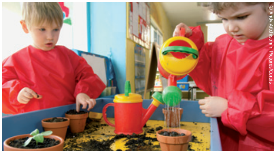
Eurooplased peavad oma tuleviku nimel juba täna ühiselt tegutsema.

Samal ajal näitas majanduskriis, et oma vääringuna eurot kasutavad riigid on üksteisest erilises sõltuvuses, mis on pannud nad toimima ELi riikide tuumikrühmana.