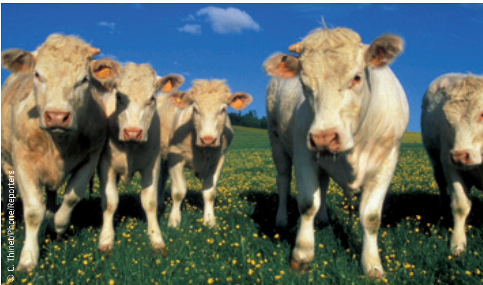
Põllumajandus peab meid varustama kvaliteetse ja ohutu toiduga.

ELi esindaja rahvusvahelistel läbirääkimistel Maailma Kaubandusorganisatsioonis WTOs on Euroopa Komisjon. EL soovib, et WTO pööraks rohkem tähelepanu toidu kvaliteedile, ettevaatusprintsibile („parem karta kui kahetseda”) ja loomade heaolule.