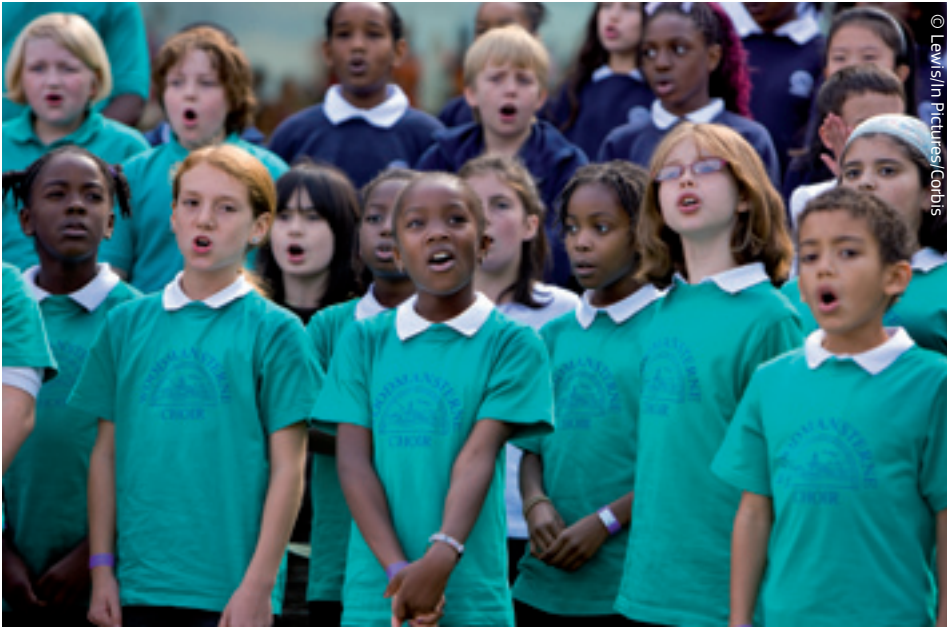
Ühendatud mitmekesisuses: üheskoos saavutame paremaid tulemusi.

Tänases maailmas on sellised tõusva majandusega riigid nagu Brasiilia, Hiina ja India globaalsete superriikidena astumas Ameerika Ühendriikide kõrvale. Seetõttu on Euroopa Liidu liikmesriikide jaoks veelgi olulisem, et nad ühinedes saavutaksid n-ö kriitilise massi ja säilitaksid oma mõjuvõimu maailmas.