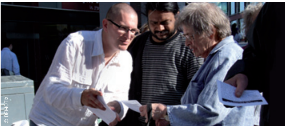
Demokraatlikum Euroopa: tänu Lissaboni lepingule saavad Euroopa kodanikud nüüd teha seadusettepanekuid.

Euroopa Ülemkogu määrab kindlaks ELi eesmärgid ning tegevussuunad nende saavutamiseks. Ta on ELi peamiste poliitiliste algatuste tõukejõud ning otsuste langetaja sellistes tundlikes küsimustes, milles ministrite nõukogu ei ole suutnud kokkulepet saavutada. Euroopa Ülemkogu käsitleb ka rahvusvahelise poliitika päevaprobleeme, rakendades ühist välis- ja julgeolekupoliitikat, mis on ELi liikmesriikide välispoliitilist tegevust koordineeriv mehhanism.