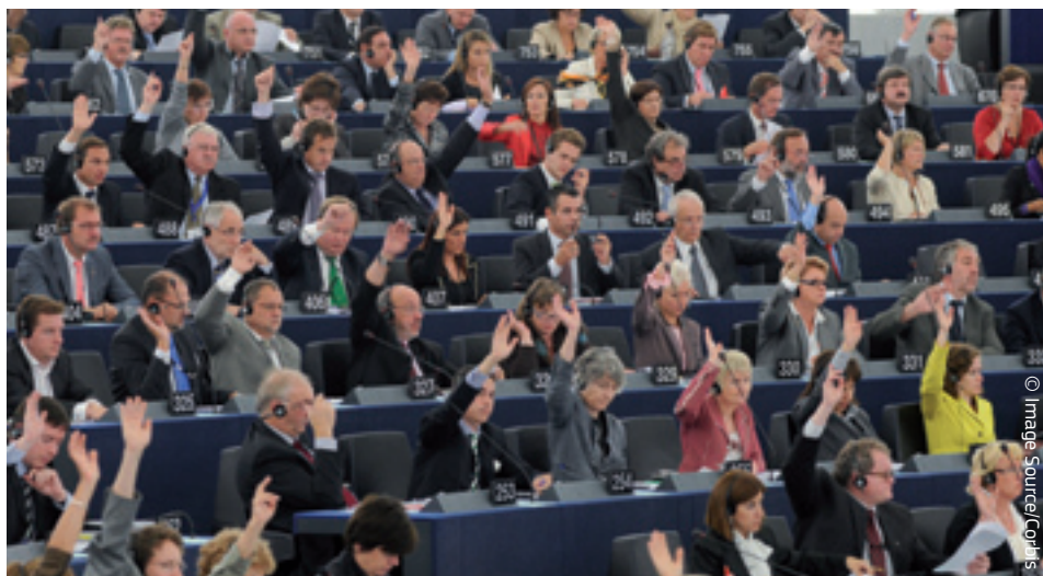
Euroopa Parlament: tema hääli on Sinu hääli.

2011. aastal valiti parlamendi presidendiks sakslane Martin Schultz (sotsiaaldemokraatide ja demokraatide fraktsiooni esindaja).