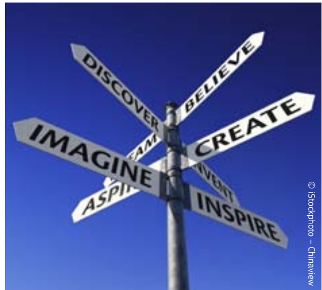
Parimad ideed tulevad igast ilmakaarest.

Laiema üldsuse kaasamine ELi kultuurialasesse visiooni. Selleks et meie kultuurilisest mitmekesisusest majanduslikult kasu saada ning saavutada kultuuridevaheline austus ja mõistmine, tuleb kõigi tasandite poliitikasse kaasata meetmed juurepääsuks kultuurile hariduse valdkonnas, kultuurilise tootlikkuse suurendamiseks ning osalemise toetamiseks.