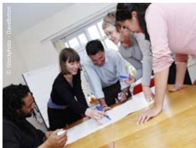
Euroopa mitmekesisus on loovuse „sulatusahi“.

Audiovisuaalmeedia teenuste ühtne turg ning programmi loomine interneti turvalisemaks kasutamiseks, et kaitsta lapsi kõikjal ELis, on vaid kaks viisi, kuidas kogu ELi hõlmav lähenemisviis võimaldab riiklikul tasandil tehtavaga võrreldes selliste probleemide lahendamiseks rohkem ära teha. Programmid MEDIA ja MEDIA Mundus täiendavad riikidepoolset rahastamist, et tugevdada Euroopa kino, parandada uute filmide levikut ning muuta audiovisuaalsektor konkurentsivõimelisemaks.