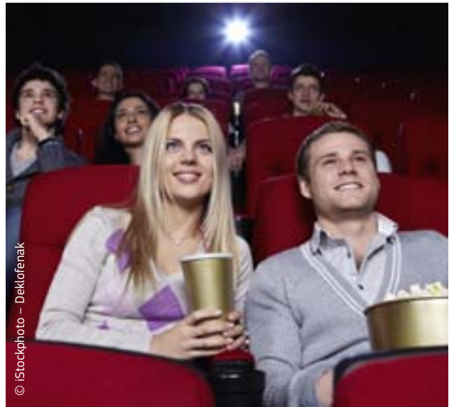
Võrgustik Europa Cinemas edendab Euroopa kino olemust.