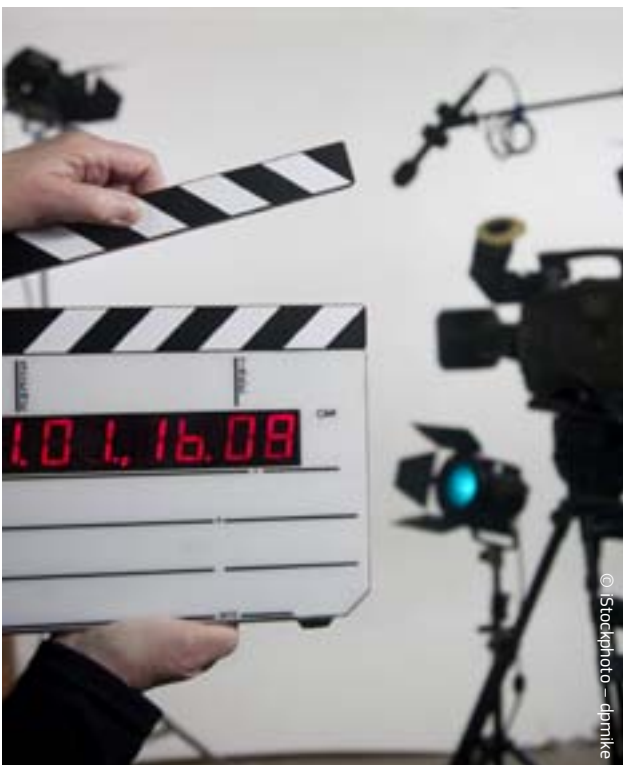
Projekt „Operation Kino” – kinokunsti viimine ELi äärealadele.

Võrgustik, mida juhib Saksamaa teatritrupp, keskendub noorte teatriklubidele ning noorele vaatajaskonnale, kellele uued etendused mõeldud on.