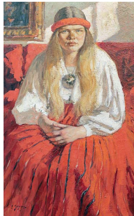
«Девушка из Хийу»

КПЭ Коллекция произведений искусства Канцелярии Парламента Эстонии