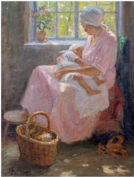
«Материнская любовь» Холст, масло. 104,5 x 67,5 см. 1923. ЭХМ

С 20 февраля по 28 апреля 2013 года в Таллиннском Русском музее открыта выставка живописных работ Андрея Егорова.