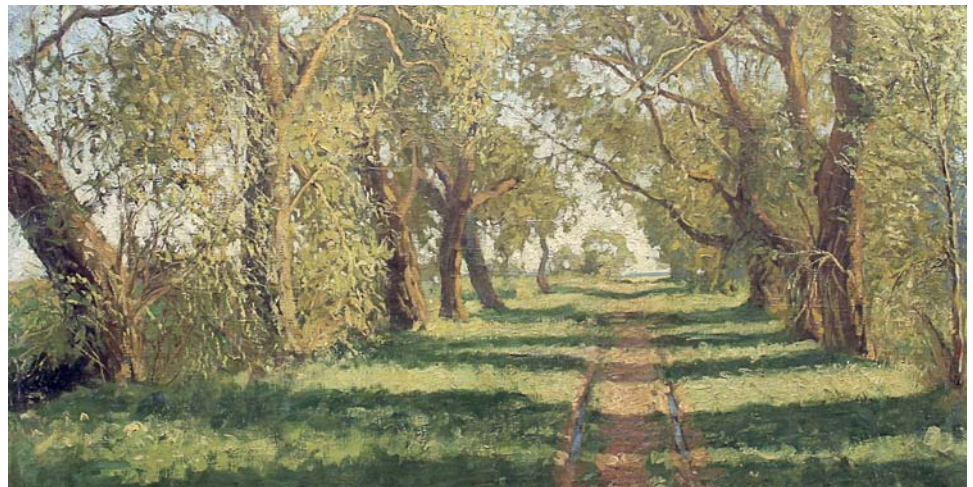
«Аллея» · Холст, масло. 85 x 104 см. 1931. ТХМ