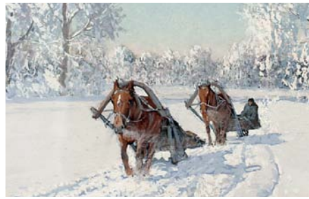
«Зимний пейзаж с санями» Картон, смешанная техника. 28 x 34 см. US