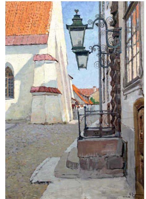
«Старая Нарва» Холст, масло. 71,5 x 53,3 см. 1934. ЭХМ

На выставке, подготовленной Таллиннским Русским музеем, будут представлены сорок живописных произведений Егорова из фондов Художественного музея Эстонии, Тартуского художественного музея, Союза Глухих Эстонии, коллекции произведений искусства Канцелярии Парламента Эстонии, а также — частных коллекций.