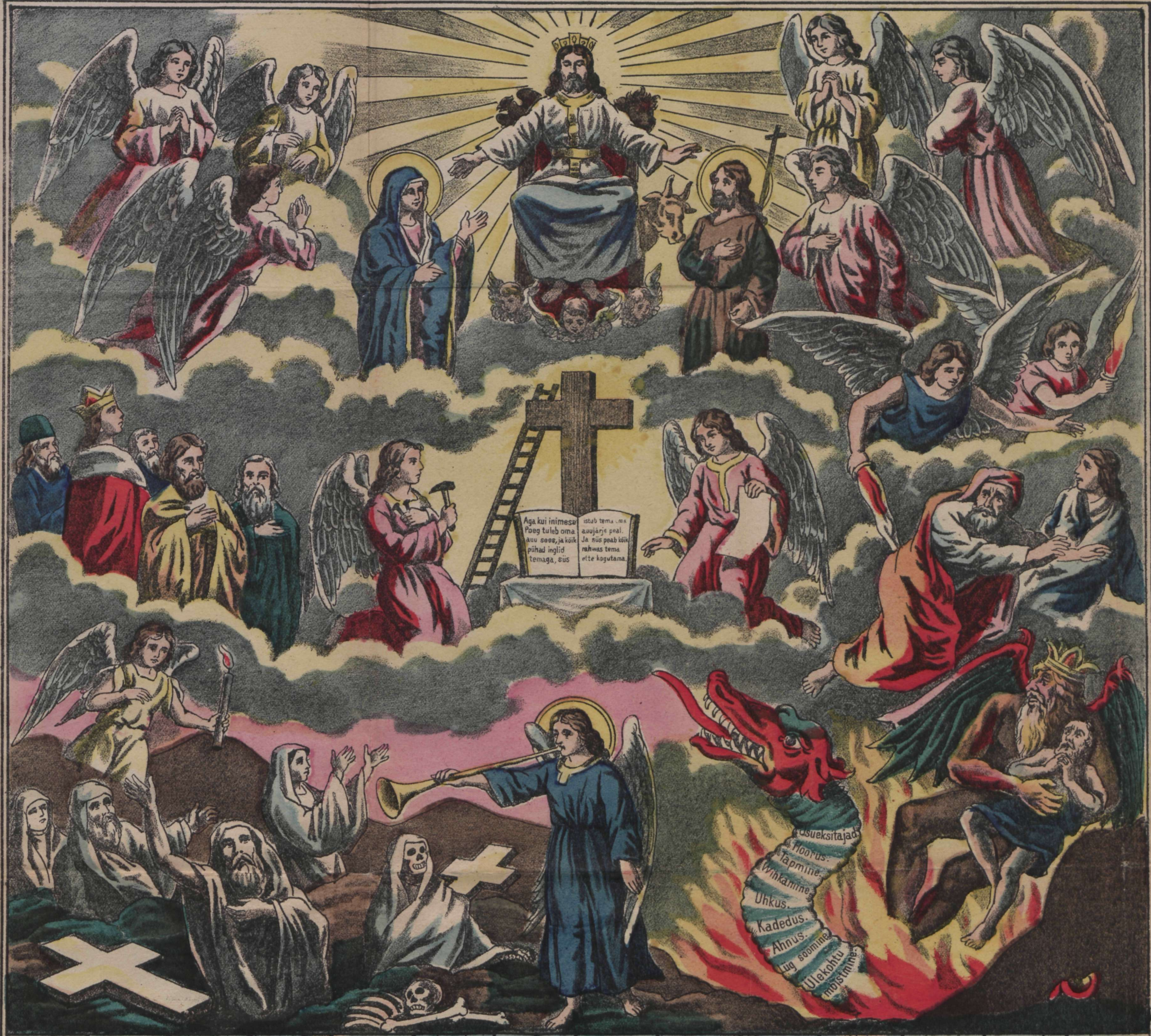
Rööwliitele. Uhketele. Joodikutele. Wõõra Jumala teenritele. Petja kasu püüdjatele. Hinge tapjatele. Nõidadele. Abielu-rikkujatele. Keelepeksjatele. Ahnetele. Wanemate teotajatele. Usu salgajatele. Ilma halastamatatele. Walelikkudele.

Aga kui inimese Poeg tuleb oma auu sees, ja kõik pühad inglid temaga, siis istub tema oma auujärje peal. Ja siis peab kõik rahwas tema ette kogutama, ja tema lahutab neid ühest ära, nõnda kui karjane lambad ära lahutab sikkudest; ja tema paneb lambad oma paremale käele, aga sikkud pahemale käele seisma. Siis wõtab kuningas neile delba, kes tema paremal käel on: „Tulge tenna, minu Isa õnnistatud, pärige kuningriik, mis teile on valmistatud maailma asutamiseks.“ Siis wõtab tema ka delba neile, kes pahemal käel on: „Minge ära minu, teie ära neetud, igawesesse tulede, mis valmistatud on kurabile ja tema inglitele.“ Ja need sinatseb lähewad igawesesse walusse, aga õiged igawesesse elusse. (Matt. 25, 31—34. 41.) — Ärge effige mitte, Jumal ei anna enast mitte pilgata, sest mis inimene ial külwab, seda tema ka lõitab. Sest kes oma liha peale külwab, see lõitab lihast hutatust; aga kes Waimu peale külwab, see lõitab Waimust igawest elu. (Mat. 6, 7. 8.) — Aga argade, ja uftmatate, ja hirmsate ja tapjate, ja hoorapidajate, ja nõidade, ja wõõra jumala teenrite, ja kõige walelikkude oja peab tule- ja wõõraliga põlewas järwes olema. (Jlm. 21, 8.) Ja leba ei leitub elu-raamatu sisse kirjutatud olewat, seda heideti tule- järwe. (Jlm. 20, 15.) — Ja waata, ma tulen nobebasti ja mu pall on minuga, igaihe kätte taubada, nõnda kui tema tegu on. Mina olen A ning D, Algu ning Dts, esimene ning wiimne. Õndsad on need, kes tema käsufõnade järele teewad! Amen. (Jlm. 22, 12. 13. 14.)