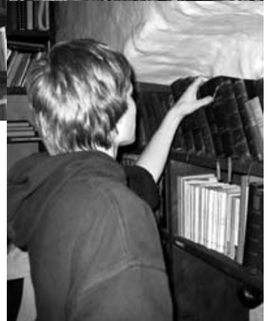
vanas tallinna dominiiklaste kloostriis, müürivahe 33 "mauritiuse raamatukogu"