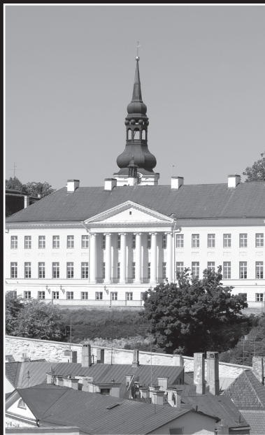
Õiguskantsleri Kantslei, Kohtu 8, 15193 Tallinn

Kohtu 8 hoone on projekteeritud omaaegse Tallinna linnaarhitekti Carl Ludwig Engeli poolt ning valmis 1814. aastal. Hoone kuulub ampiirstiili ning on vaieldamatult üks Tallinna arhitektuuripärandi pärle. Alates 1920. aastatest on hoones paiknenud mitmed ministeeriumid, neist kõige kauem rahandusministeerium. Alates 2004. aasta algusest asub selles majas Eesti Vabariigi Õiguskantsleri Kantslei.