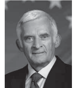
JERZY BUZEK | EUROOPA PARLAMENDI PRESIDENT

Meie kogemus Euroopas on näidanud, et vabadust ja demokraatiat ei saa jagada portsjonite kaupa. Kuuba inimesed peavad saama täielikult nautida oma põhivabadusi oma kodusaaarel. Andes Sahharovi auhinna mõttevabaduse eest Guillermo Fariñasale, avaldab Euroopa Parlament tunnustust kõigile sõna- ja väljendusvabaduse eest seisvatele Kuuba inimõiguste kaitsjatele, kes püüavad saavutada rahumeelsete vahenditega poliitilisi muutusi ja vabadust Kuubal.