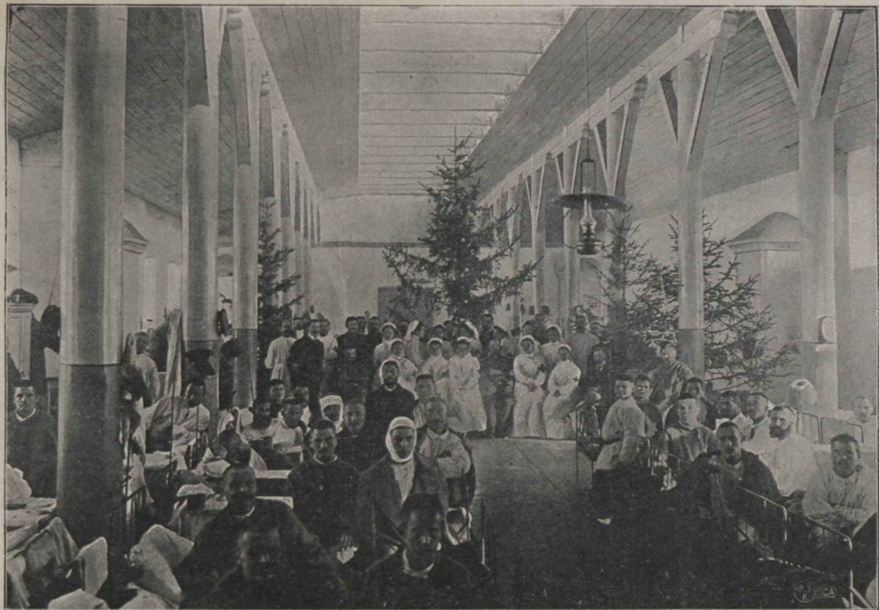
Jõulupuu Liivimaa laatsaretiis Eho linnas.