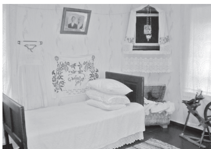
Toanurk Kolkja muuseumis