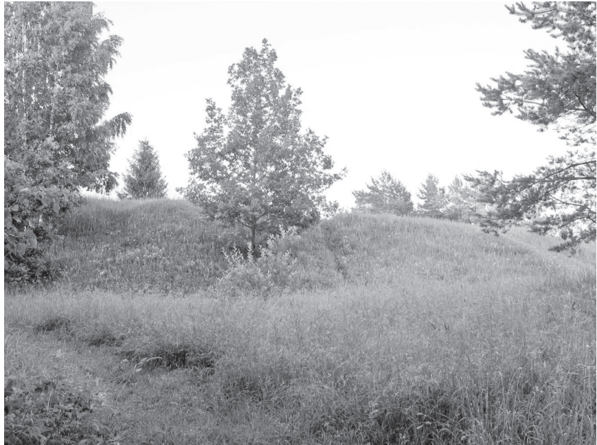
Saadjärve linnamägi (Kalevipoja säng)

Muinasajast on Tartumaal teada mitu Kalevipoja sängi tüüpi linnust, mis rajati voorte harjadele. Et voore mõlemad kaugemad otsad on inimeste käetööga kõrgemaks ehitatud, siis meenutavadki need linnused kaugemalt vaadates sängi. Üks neist asub Saadjärve lähedal Salu külas. 1953. aasta proovikaevamised näitasid, et linnuseõue katab paks kultuurkiht. Sellest leiti potikedral tehtud savinõude kilde, mis kinnitavad, et linnus oli kasutusel veel II aastatuhande algul. Vanimad leiud, mis on dateeritud esimeste