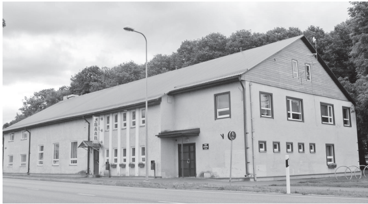
Puhja seltsimaja

KAJA UDSO, kauaaegse Puhja seltsimaja juhataja materjale Puhja Seltsimajast (jaanuar 2013). http://www.puhja.ee/index.php?page=145& http://www.puhja.ee/public/files/Puhja_2007_05.pdf