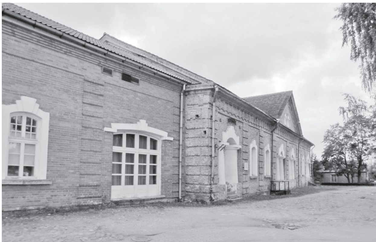
Rõngu kõrts

Kõrtsidest kujunesid aegade jooksul omamoodi külakeskused, talurahva kokkusaamise kohad. Sinna mindi pühapäeviti ka pärast jumalateenistusel käiku. Juba Rootsi ajast on teada, et kõrts pidi pakkuma öömaja igast seisusest rändurile. 19. sajandi lõpuks oli Eestis umbes kolm tuhat kõrtsi. Riigi viinamonopoli kehtestamisega 1900. aastal enamik kõrtse suleti, osa neist tegutses edasi viinapoodide või einelaudadena.