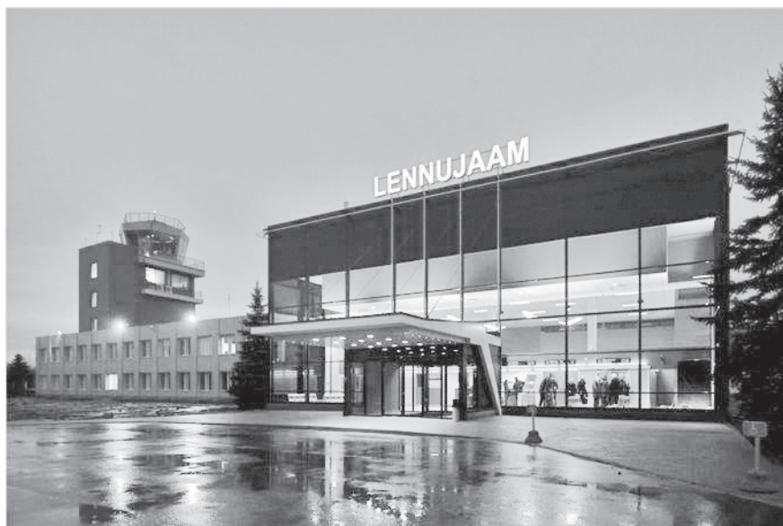
Tartu lennuväli

http://www.tartu-airport.ee/aboutcompany/huvitavaidfaktetartulennujaamast .