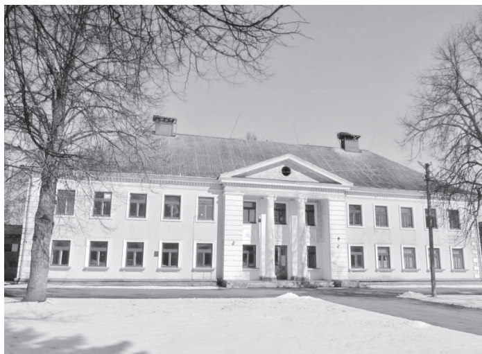
1950. aastatel ehitatud haldushoone Kallastel