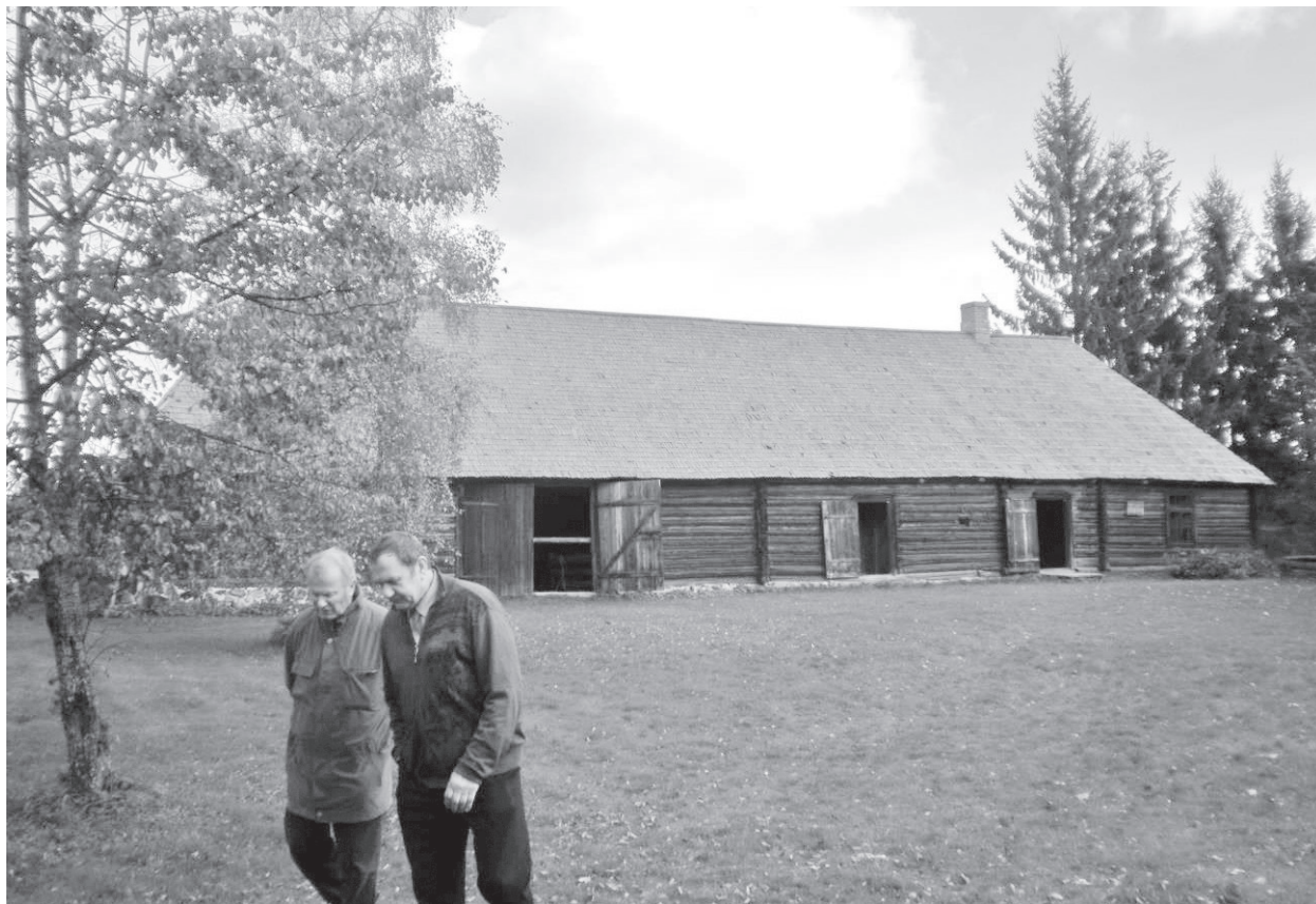
Oja talu: Juhan Liivi lapsepõlvkodu Rupsi külas

Juhan (Johannes) Liiv sündis 30. aprillil 1864. aastal Tartumaal Alatskivi vallas ja kasvas üles Rupsi külas Oja talus. Ta oli perepoegadest noorim ning lapsepõlvest peale nõrga tervisega. Oma aja kohta sai Liiv hea hariduse, jätkates Naelavere külakoolis ja Kodavere kihelkonnakoolis alustatud õpinguid Hugo Treffneri Gümnaasiumis Tartus. Leiba teenis ta ajakirjanikuna Virulase, Sakala ja Oleviku juures ning avaldas ajalehtedes ka luuletusi ja lühijutte.