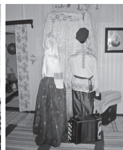
Ekspositsioon Varnja muuseumis