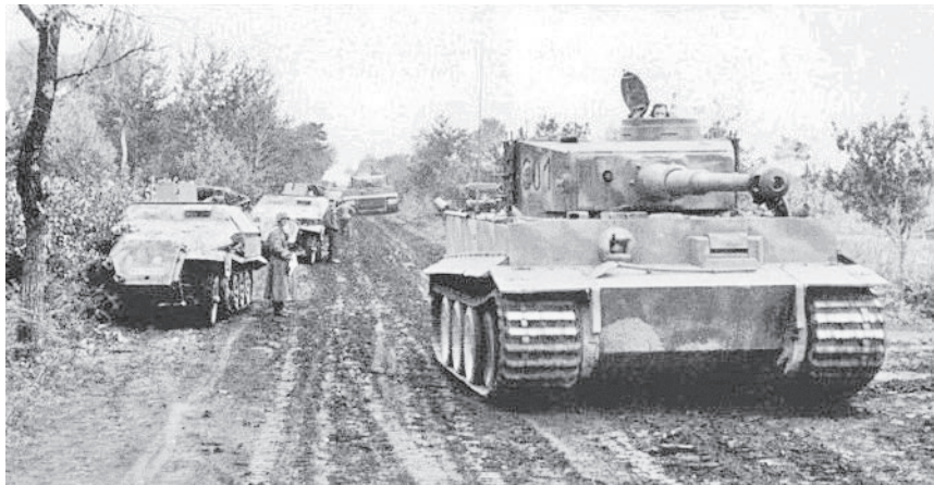
Tankid teel lahingusse