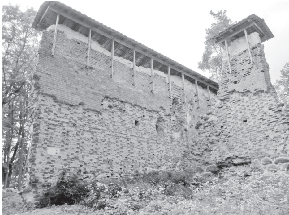
Rõngu linnuse varemed sisehoovist vaadatuna

Tartu piiskopkonna alale jääv Tödwenite suguvõsale kuulunud Rõngu vasallilinnus rajati arvatavasti 1340. aasta paiku. Linnuse ehitusmaterjalina kasutati peamiselt tellist, vähemal määral ka maakive. Esialgu ehitati ristkülikukujulise sisehooviga kastellihoone, kus paiknesid vasalli ja tema sulaste eluruumid, ning alles hiljem edelasse külgenev eeslinnus. Idapoolsest välismüürist eendub võimas kahe meetri paksuste seinetega väravaehitis, mille kohal paiknenud avar võlvruum võis olla Püha Risti kabel. Viimast on esimest korda mainitud 1413. aastal, mil paavst Johannes XXIII kuulutas Rõngu linnusekabelis käijaile neljakümnepäevase pattude andeksandmise.