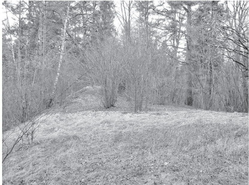
Unipiha linnuse otsavall (2008)

Unipiha linnusasula asub Kambja vallas Kambja-Nõo tee ääres Virulase külas. Unipiha on tüüpiline eelviikingi- ja viikingiaja linnus, mille vanimad kaitserajatised võivad pärineda rahvasterännuajast või isegi rooma rauaaja lõpust. Tegemist on neemiklinnusega, mis paikneb pikliku oosi kõrgemal kõige järsemate nõlvadega kirdepoolsel otsal. Ülejäänud seljakust on ligikaudu 1000 m 2 suurune linnuseala eraldatud kuni kahe meetri kõrguse valli ning selle välisjalamil oleva 2,5 meetri sügavuse kraaviga. Piki mäe serva asetsenud põlevad tukid näitavad, et vanim kaitserajatis oli siin palkidest tara. Hiljem on selle asemele mitmes järgus kuhjatud liivast vall. Valli väliskülje kindlustamisel on kasutatud ka maakive. Tänapäeval on linnuse nõlvad ja enamik õuepinda kaetud metsaga.