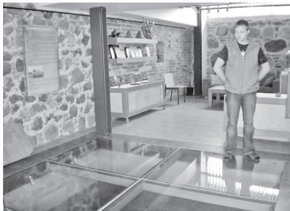
Looduskeskuse klaaspõranda all eksponeeritakse arheoloogilisi leide