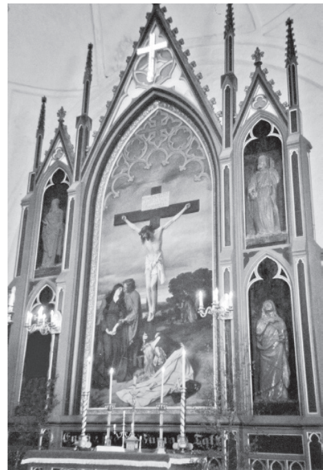
Nõo kiriku altar

ANN TENNO, Eestimaa kirikud. Tallinn, 2002, lk 108.