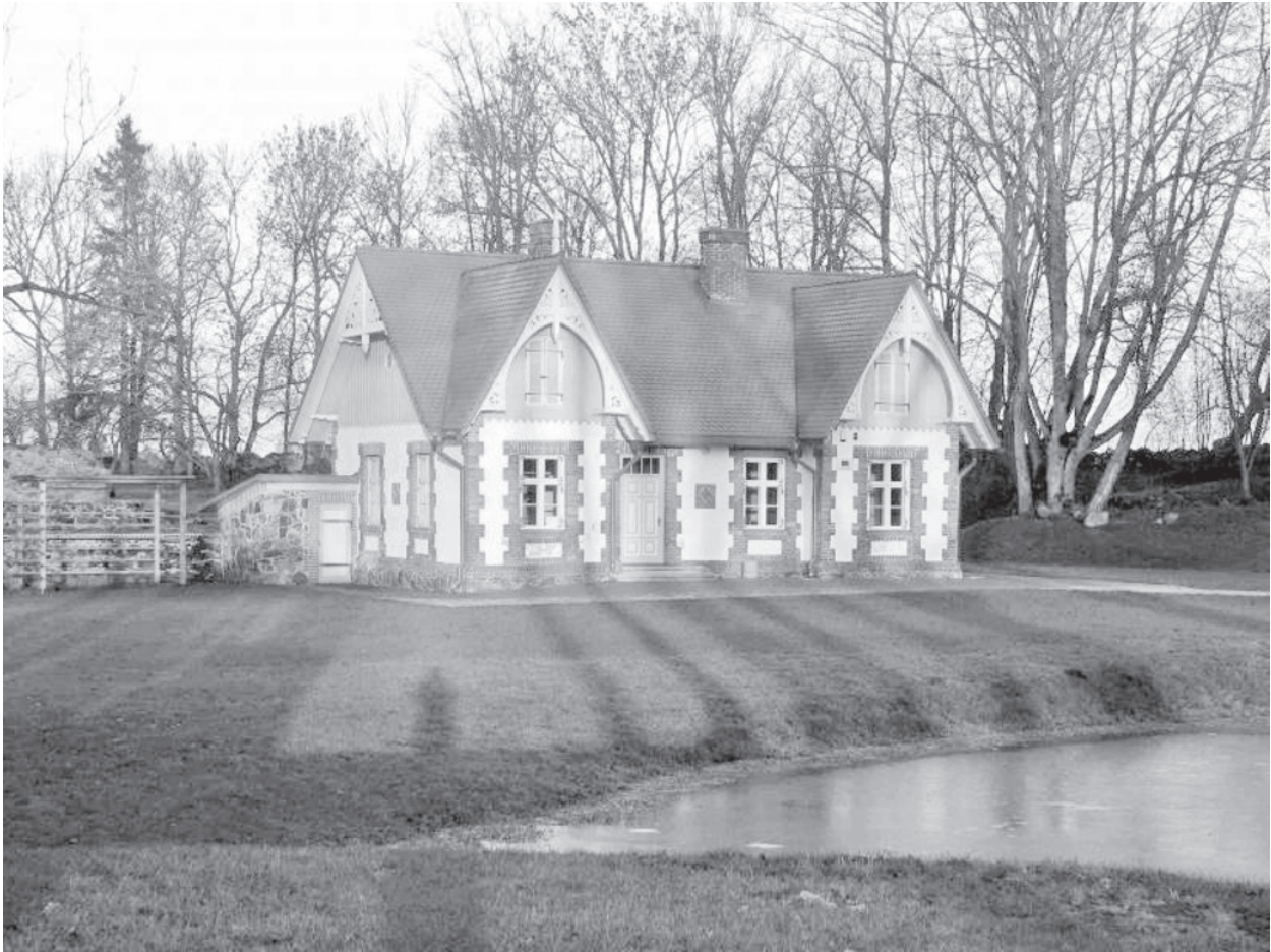
Luke mõisa kärnerimaja

Luke mõisa peahoone hävis 1944. aastal tulekahjus. Säilinud on aga mõisa vanaprantsuse stiilis park, mille rajamist alustati tõenäoliselt 19. sajandi teisel poolel, mil mõis läks Knorringite suguvõsa kätte. Parki on täiendatud ja noorendatud veel 1890. aastail. Kunagises rangelt geomeetrilises kujunduses puudevõrad moodustavad nüüd väljakasvanuna omapäraseid gooti võlvkäike.