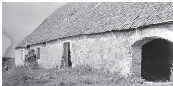
Kantsi kõrts 1960. aastatel

Pealetungivad Vene väed hävitasid linnuse. Selle kive kasuti 1780. aastail jõeäärse Kantsi kõrtsi ehitamiseks. Kõrts tegutses kuni Teise maailmasõjani, pakkudes peavarju mööda Emajõe liikujale. Pärast sõda jäi hoone tühjaks ning hakkas lagunema. Praegu asub samas paigas Emajõe-Suursoo looduskaitseala keskuse modernne terasest ja klaasist hoone.