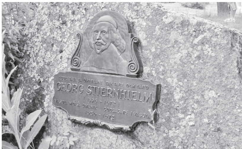
Georg Stiernhielm'i (1598–1672) bareljeef mälestuskivil Vasulas