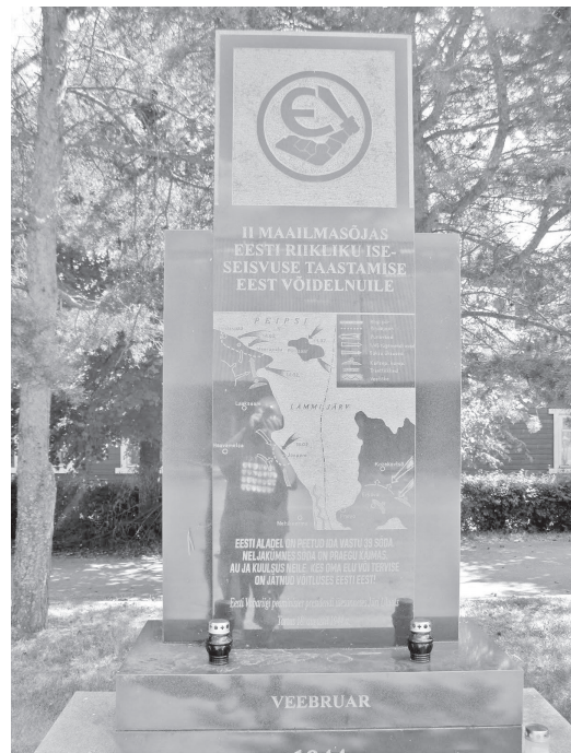
Mehikoormas 26. augustil 2006 avatud ausammas Tartumaal Teises maailmasõjas Eesti riikliku iseseisvuse taastamise eest võidelnutele (autor Kuno Raude)

http://et.wikipedia.org/wiki/Meerapalu_lahing .