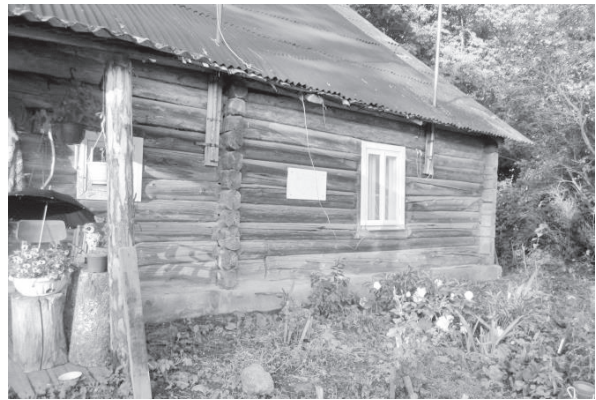
Jaan Koorti sünnikodu

Tartu valla kuukirja materjalid aastatest 1997–1998. http://www.eestigiid.ee/?CatID=293&ItemID=3644 . http://www.hot.ee/lvpforum/Ajalugu/ajalugu-44.html .