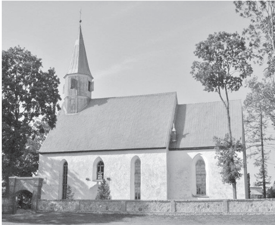
Nõo kirikuhoone