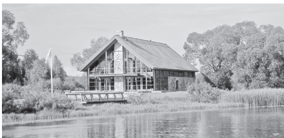
Kantsi kõrtsi kohale ehitatud looduskeskus