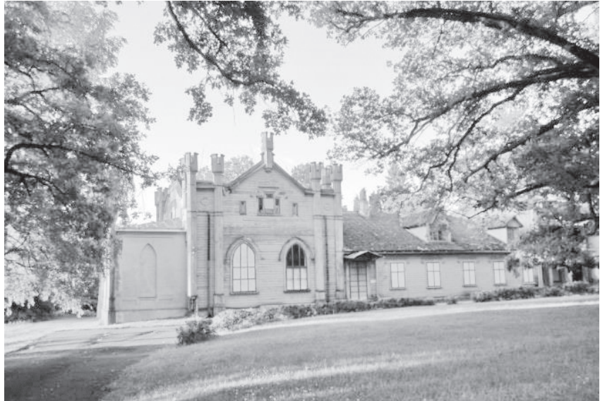
Kukulinna mõis

Kukulinna mõis asub Saadjärve maalilisel kagukaldal. Tänapäevani säilinud omapärase arhitektuuriga puithäärber on ehitatud 19. sajandil: romantilises neogooti stiilis kahekordne ehitis, mida ilmestavad ehis-tornid ja kaitsetorne imiteerivad poolsambad on pärit sajandi algusest. Sajandi lõpul ehitati hoone järvepoolsesse otsa teravkaarakendega saal ning tagaküljele lahtine veranda; viimane on nüüdseks lammutatud.