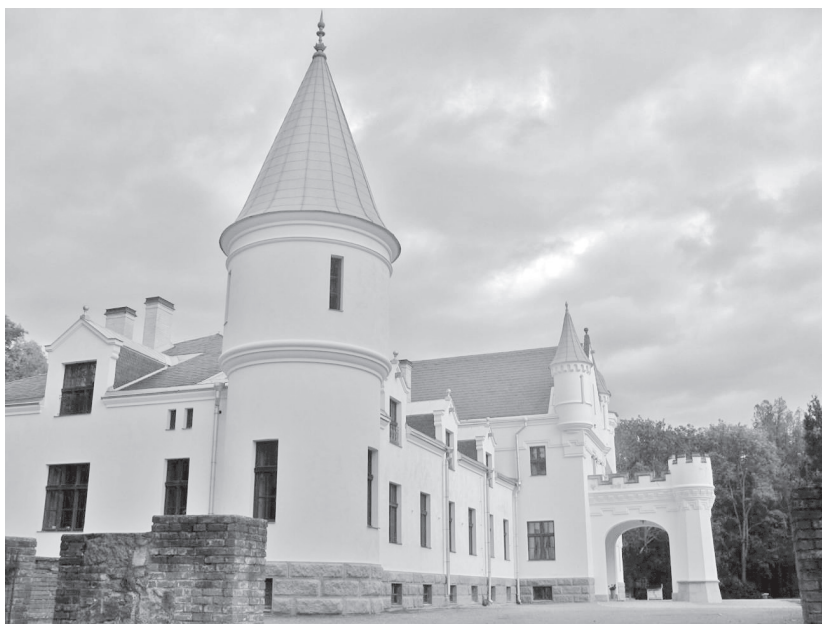
Alatskivi loss

Pärast riigistamist 1919. aastal on mõisa peahoone kasutusel olnud nii koolimaja, piirivalvekordoni kui ka sovhoosikeskusena. Praegu kuulub loss valla omandisse ning on nüüdseks restaureeritud ja huvilistele avatud. Kõrvalhoonete restaureerimine veel käib.