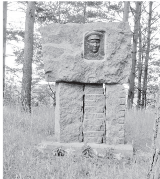
Tankilahingu ja kindralmajor Potapovi mälestus- märk Tamsa Kindralimäel