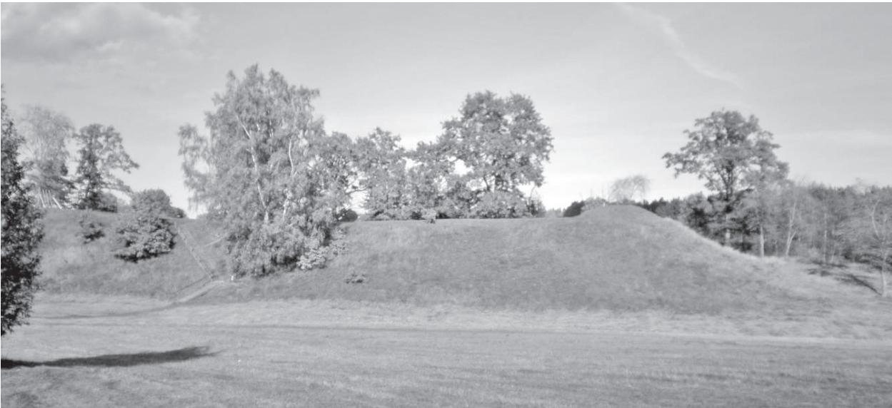
Alatskivi Kalevipoja säng

Alatskivil on kaks linnamäge, mis on samuti seotud Kalevipoja muistenditega.