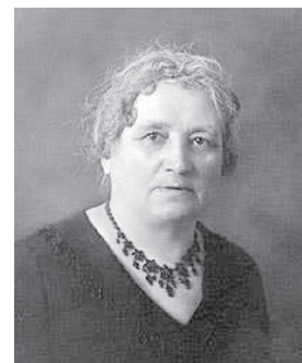
Miina Härma 1923. a.

Eesti ajalugu elulugudes: 101 tähtsat eestlast. Koostanud SULEV VAHTRE. Tallinn, 1997, lk 160–161.