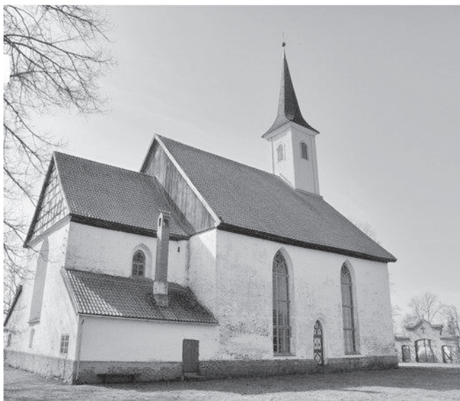
Rannu kirik

http://register.muinas.ee/?menuID=monument&action=view&mtab=main&id=7254 .