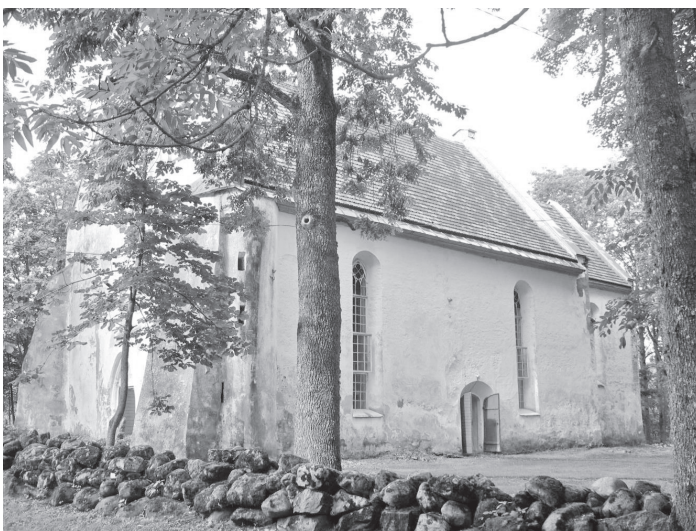
Puhja kirik

Aastail 1700–1730 töötas Puhjas köstri ja koolmeistrina Käsü Hans. 1708. aastal valminud 32 salmiga kaebelaulu „Oh ma vaene Tardo liin” järgi peetakse teda esimeseks eesti soost luuletajaks. Luuletus räägib tartlaste küüditamisest ning sellest, kuidas Vene väed linna 1708. aastal hävitasid.