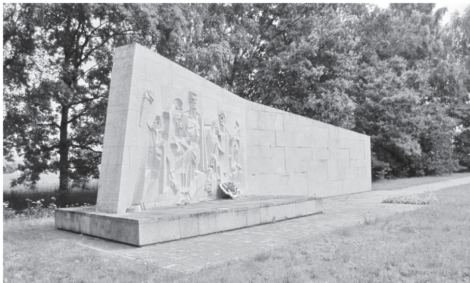
Memoriaal Lemmatsis

Nõukogude võimu ajal rajati Jalaka liini kohale Tartu-Valga maantee äärde mälestusmärk.