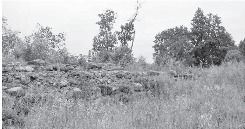
Kärkna kloostri varemed

Kärkna (ka Muuge, saksa keeles Falke-nau ) oli tsistertslaste mungaordu tähtsamaid keskusi Liivimaal. Klooster, esimene kogu Eesti alal, asus Amme jõe suudmes, poole kilomeetri kaugusel Suurest Emajõest. Kloostri asutas kas 1228. või 1233. aastal Tartu esimene piiskop Hermann I (oli ametis aastail