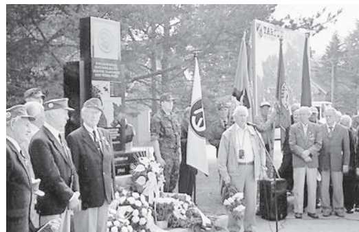
Mälestusmärgi avamine