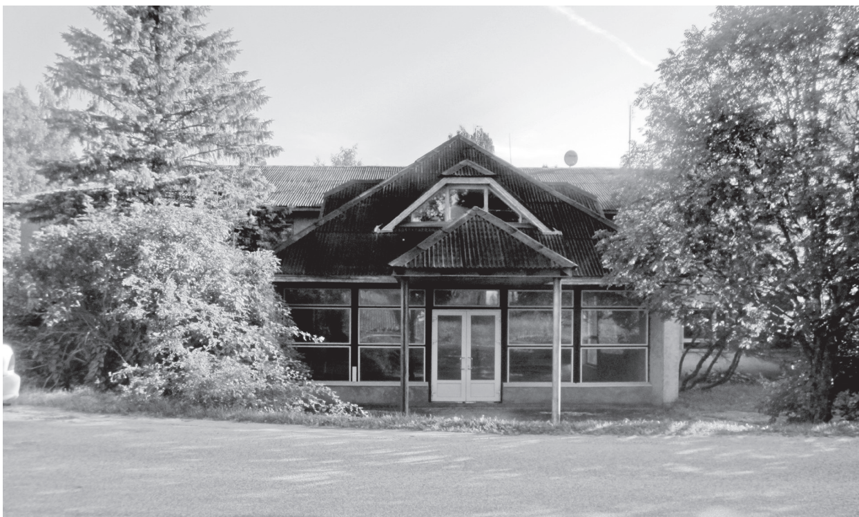
Avangardi kolhoosi kontori- ja klubihoone 2013. a