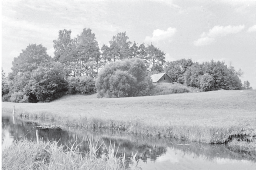
Vana-Kastre piiskopilinnuse ase (1961)

Vana-Kastre linnust on ürikutes esimest korda nimetatud 1342. aastal. Et linnust arheoloogiliselt uuritud ei ole, on andmedki linnuse ajaloost umbmäärased. Esialgu võis tegemist olla tornlinnusega, millele viitab saksakeelne nimi ( Oldenthorn, Oldentorne, Oldenturn ). Hiljem paiknes arvatavasti nelinurkse plaaniga kastellilaadseks ehitatud ning kolmest küljest hoonestatud linnus Emajõe ja Luutsna jõe ühinemiskohal või ka jõesaa- rel. Jõe kaldal säilinud palgid viitavad sadamale. Linnus pidi