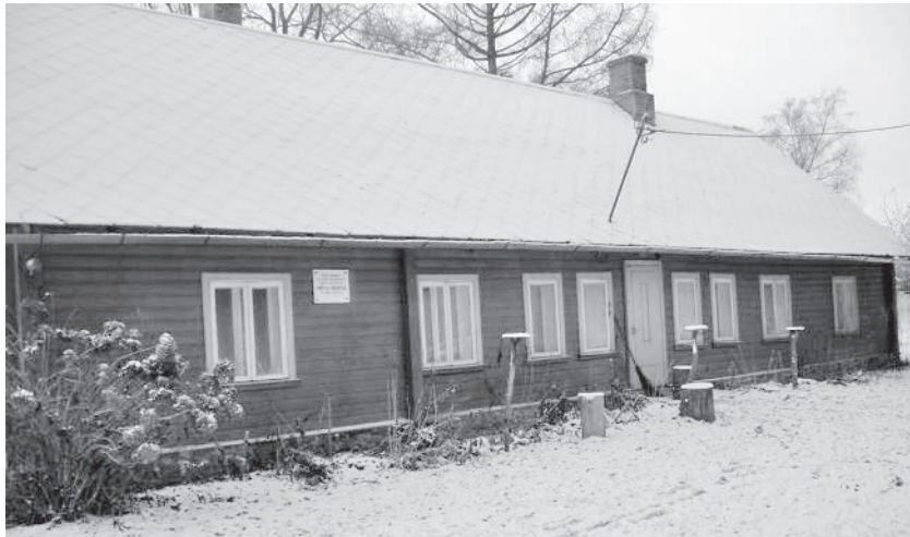
Miina Härma sünnikodu

Kõrvekülas meenutab heliloojat mälestustahvel tema sünnimaja (endise koolimaja) seinal ning mälestuskivi vanal kooliõuel. Kõrveküla koolis asub Miina Härma elu ja loomingut tutvustav muuseum. Miina Härma on maetud Tartu Raadi kalmistule. Tema nime kannab gümnaasium Tartus, kus ta üle kümne aasta muusikat õpetas.