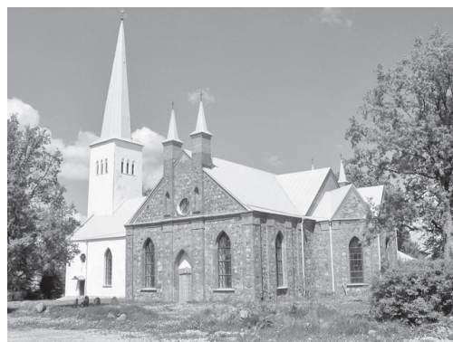
Kambja kirik

1932. aastal käis Kambjas Tartu Ülikooli 300. juubeli pidustuste ajal Rootsi kroonprints Gustav Adolf, kes istutas kirikuaeda tamme, mis kasvab värava kõrval praegugi.