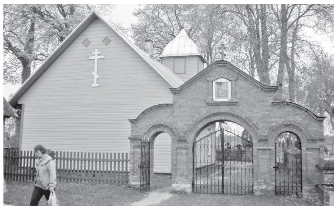
Kasepää palvemaja

Vanausulistega on asustatud ka Peipsi järve suurim saar Piirissaar, mis oli kuni 1920. aastani jaotatud Liivi- ja Venemaa vahel. Saare kõrgemas kirdeosas on tänapäeval kolm küla: Piiri, Saare ja Tooni. Kunagise rahvarohke saare elanike arv on alates 20. sajandi algusest pidevalt vähenenud. 2011. aasta rahvaloenduse andmeil elas Piirissaarel ainult 53 püsielanikku. Saarega peetakse ühendust Laaksaare sadama kaudu.