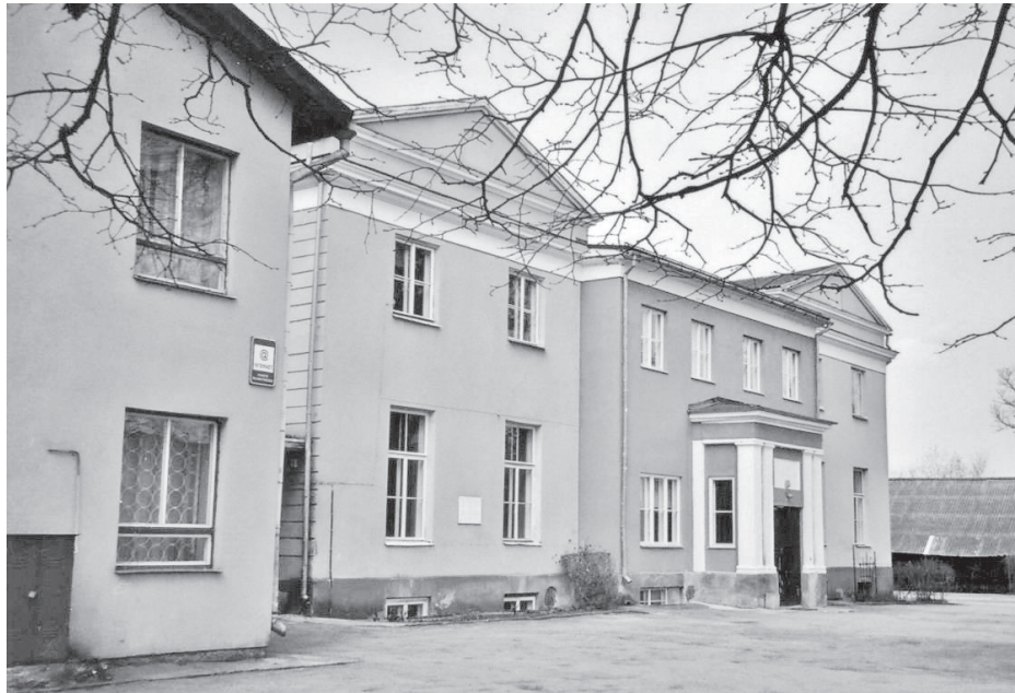
Vana-Kuuste mõis (Kuuste kool)