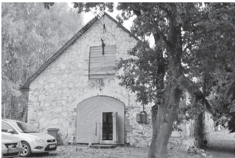
Vasula mõisa abihoone

Kui 1656. aastal tungisid Liivimaale Vene väed, põletasid nad teiste hulgas maha ka Vasula mõisa koos hinnalise raamatukoguga. Hiljem mõis taastati. Kahe maailmasõja vahelisel ajal tegutses Vasula mõisas kodumajanduskool. Nüüdseks on mõisahoonest alles üksnes vundamendikivid. Kunagise mõisa varemetele on Georg Stiernhielmile rajatud mälestuskivi.