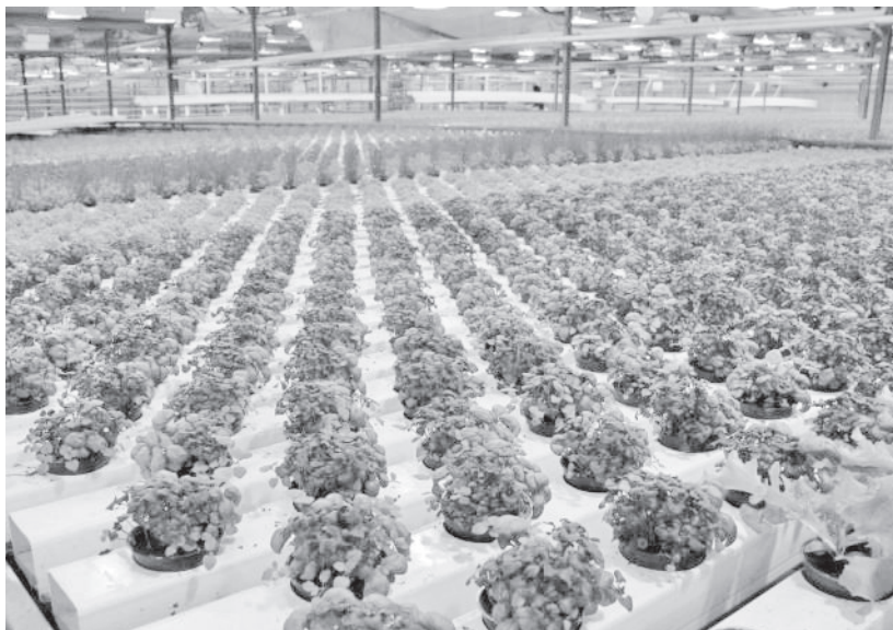
Rohelise ja punase basiiliku taimed kasvuhoones.

AS Grüne Fee Eesti asutati Eesti-Soome ühisfirmamana 1993. aastal endise Luunja sovhoosi Anne aiandi baasil. Ettevõtte asub Väike-Lohkva külas otse Tartu linna külje all. Põhiliselt kasvatatakse katmikaladel kurki, salatit ja maitserohelist. Siin on saanud tööd umbes 100 inimest. Esimesena Baltikumis võttis Grüne Fee kasutusele uudse tehnoloogia, mis võimaldab tänu lisavalgusele toota köögivilja aasta ringi. Taimekahjurite vastu kasutatakse biotõrjet, kus taimekahjuri hävitab kemikaali asemel röövputukas. Seega välistatakse toodete saastamine keemiliste tõrjevahenditega, et toodang oleks kvaliteetne.