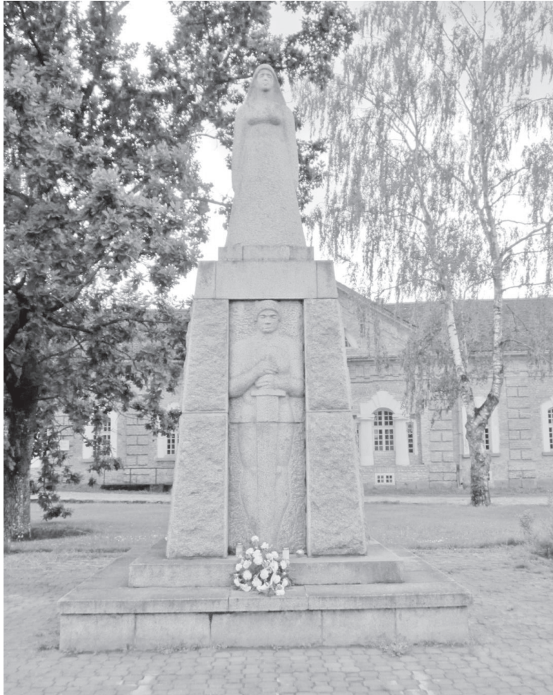
Vabadussõja mälestusmärk Rõngus

Praegune, 21. mail 1995. aastal avatud monument on rajatud kohalike elanike initsiatiivil ning nende annetuste toel. Uue lahendusega sammas, mille autor on kujur Villu Jaanisoo, on üks kõrgemaid omaaoliste seas. Pjedestaalil seisab nüüd graniidist naiseskulptuur üksi, möögale toetuv sõdalane on aga graniitaluse esiküljel. Samba küljel olevale kivitahvlile on raiutud vabadusristi kujutis ja selle all tekst „Vabaduse-sõjas langenud kangelasi mälestab Rõngu kihelkond”, teisel küljel on aga „Tuleme ka hauast, kui vajab me abi kodumaa”. Sageli on mälestusmärki nimetatud „Rõngu emaks”.