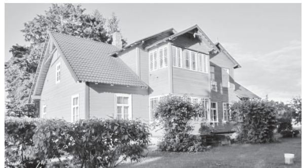
Herman Halliste suvekodu