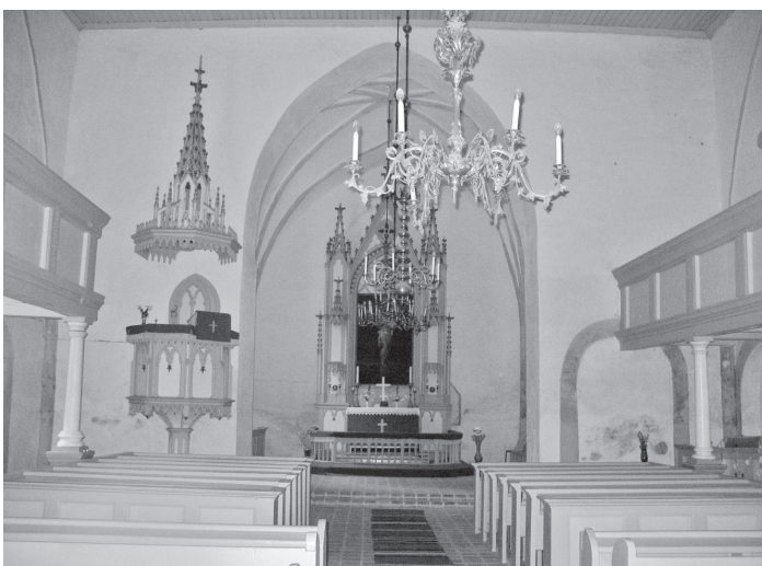
Puhja kiriku sisevaade