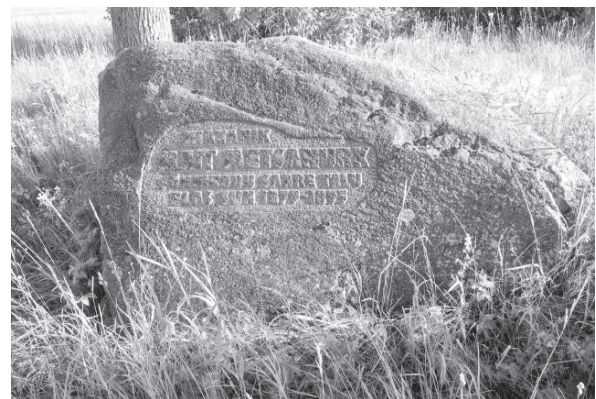
Mait Metsanurga sünnikodu tähistav kivi