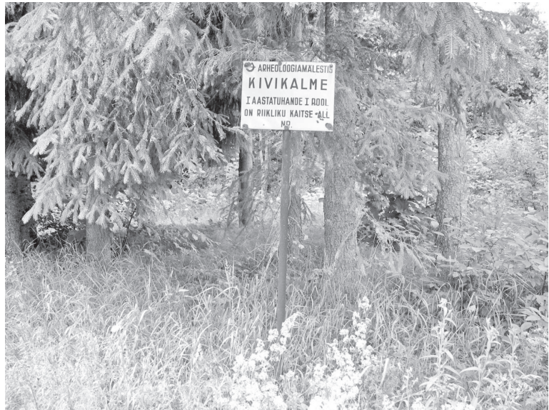
Jaagupi tarandkalme tähis. Kalme ise rohtu kasvanud ja vaevu üles leitav