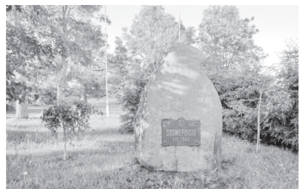
Mälestuskivi soomepoistele