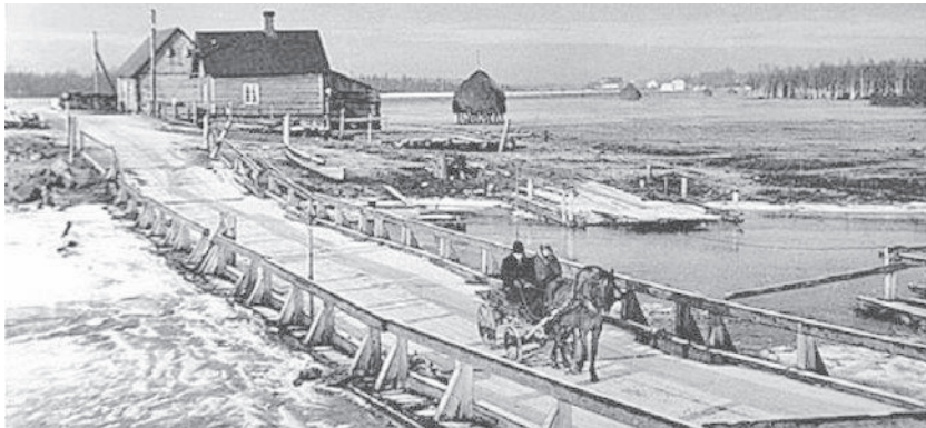
Kärevere parv ja ujuvsild 1937. aastal

Pikkusega sada kilomeetrit on Suur Emajõgi Eesti jõgede pingereas alles üheksandal kohal. Emajõe madalad, sageli üleujutatud lammid ning soised kaldad on teinud jõest läbi ajaloo arvestatava loodusliku takistuse Põhja- ja Lõuna-Eesti vahelisele liiklemisele Võrtsjärve ning Peipsi vahel. Ainus looduslikult sobiv jõe ületuskoht asubki praeguse Tartu linna kohal. Kui Tartu kõrvale jätta, viib tänapäeval üle Emajõe ainult üks raudtee- (Jänese) ja kolm maanteesilda (Rannu-Jõesuu, Kärevere ja Luunja). Kõik need on ehitatud alles 20. sajandil. Varem pääses hoburakendiga üle Emajõe üksnes parvedel. Pärast Teist maailmasõda käigus olnud Reku, Haaslava ja Kavastu parvest on nüüdseks kasutusel ainult Kavastu parv. Veel sada aastat tagasi sõideti Tartust Viljandisse ning Pärnusse enamasti Võrtsjärvest lõuna poolt Väikesel Emajöel asuva Pikasilla kaudu. Ka Tartu ja Tallinna vaheline peamine ühendustee oli kuni 1930. aastateni Piibe maantee, kus Emajõge ületada ei tulnud.