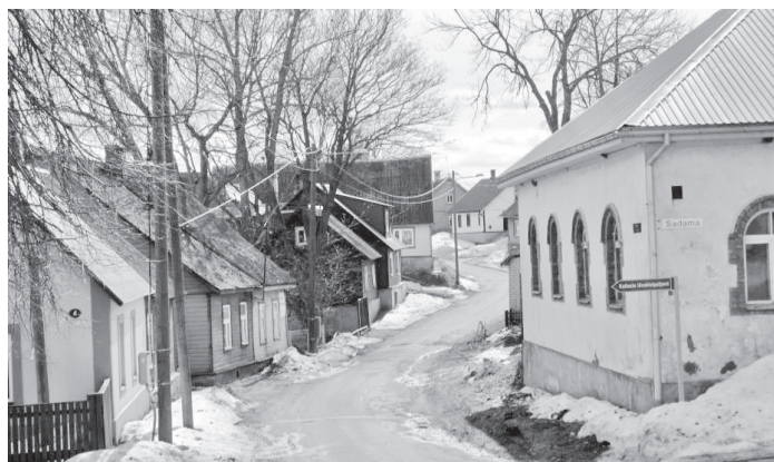
Tänav Kallastel

http://www.kallaste.ee/index.php?option=com_content&view=article&id=66:ajalugu&catid=35:ajalugu&Itemid=88 . https://www.siseministeerium.ee/public/Kallaste.pdf .