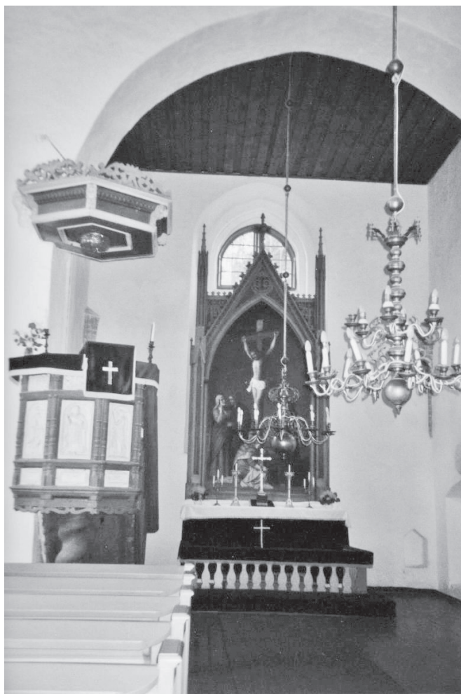
Rannu kiriku kantsel ja altar