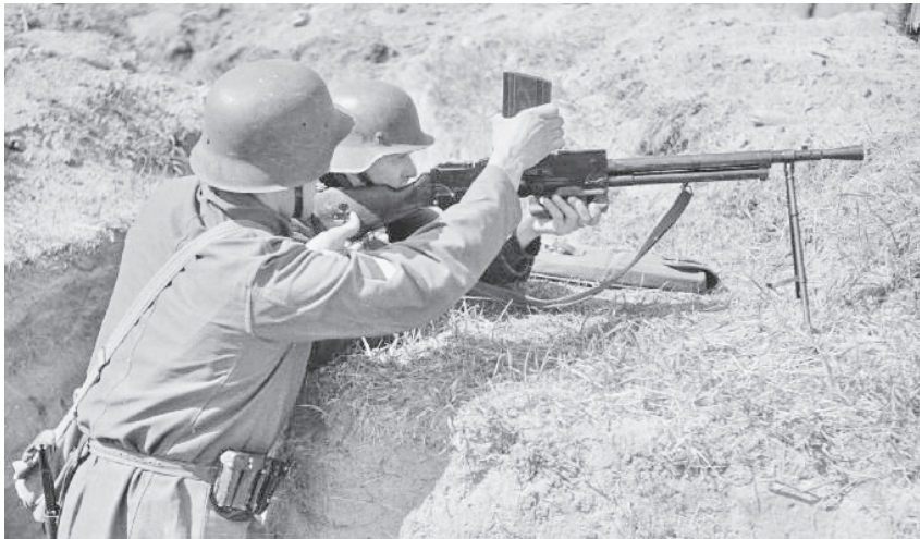
Piirikaitserügemendi võitlejad lahingus

1944. aasta augustikuu lõpuks kulges rindejoon Tartu all piki Emajõe. 14. septembril alustas Punaarmee pealetungi Väikesel Emajõel, et tungida mereni ja võtta Eestis asuvad Saksa väeüksused kotti. 16. septembril langes Saksa ülemjuhatus otsuse Eestist lahkuda ning alustada operatsiooni „Aster”, mis nägi ette organiseeritud korras taganemise. Taandumist kavatseti katta eestlastest koosnevate üksustega. Emajõe põhjakaldale jäeti Tartu kaitseks kaks piirikaitserügementi.