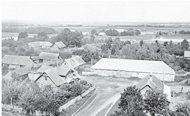
Puhja 1921. aastal