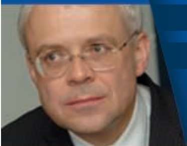
Vladimír Špidla, tööhõive, sotsiaalküsimuste ja võrdsete võimaluste volinik

“Meie eesmärk on edendada töökohal sisulist ennetuskultuuri. Selle saavutamiseks tõstame töötajate teadlikkust põhilistest tööhutuse ja töötervishoiu riskidest töökohal Euroopas ja pakume vajalikku teavet riskide edukaks ohjamiseks. Kolmepoolse võrgustikuga oleme rajanud Euroopa esimese teavituspunkti teabe saamiseks tööhutuse ja töötervishoiu kohta ning viime läbi suurimat tööhutuse ja töötervishoiu iga-aastast piirkondlikku kampaaniat. Meie sõnum on selge: tööhutus ja töötervishoid on kõigile kasulik!”