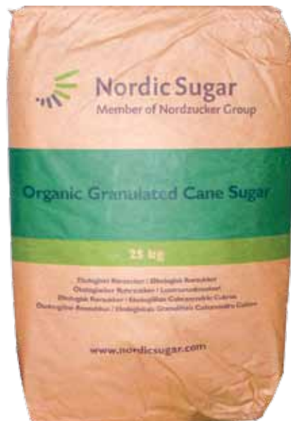
Mahesuhkrut on saada 25 kg kottidega

Juba esimese vabariigi ajal, mil suhkruga lisa söötmine oli üsna tundmatu, hakati mesindusajakirjades mesinikele tungivalt soovitada sööta vähemalt 5 kg suhkrut pere kohta.