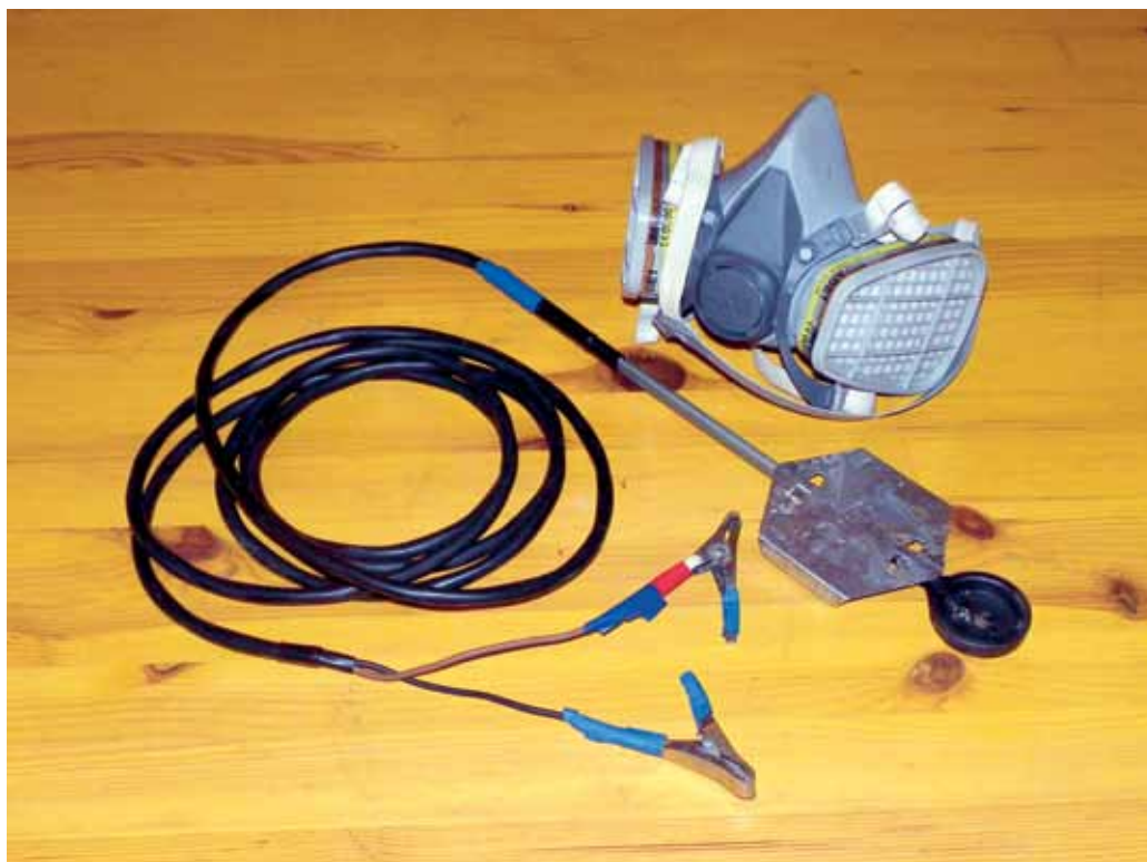
Oblikhappe auruti Varrox Vaporizer

Tavamesinduses on levinud kõnepruugiks „varroatoosi ravimine“. Mahemesinduse puhul kasutatakse varroalesta ja teiste kahjurite tõrjumist muude haiguste ennetuseks, mitte raviks. Varroatoosi tõrjeks on lubatud mahemesinduses lihtsad orgaanilised happed, nagu sipelghape, oblikhape, piimhape, äädikhape ning eeterlikest õlidest mentool,