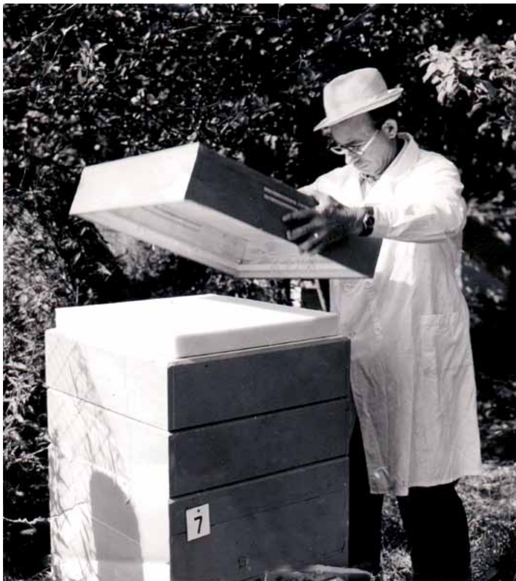
Mesnik Heino Taal 1977. a. Suurem osa 70-ndatel valmistatud puittarudest, mida karud ei ole ära lõhkunud või vargad ära viinud, on siiani Taali Mesilas kasutusel

Neile on lihtne külge kruvida sobivaid käepidemeid ning kasutada tõstmiseks erinevaid rakised, mis kompenseerivad suurema kaalu. Samuti ei pea puittarusid kindlustama sügisel võrkude või plekkidega nugiste ja hiirte eest.