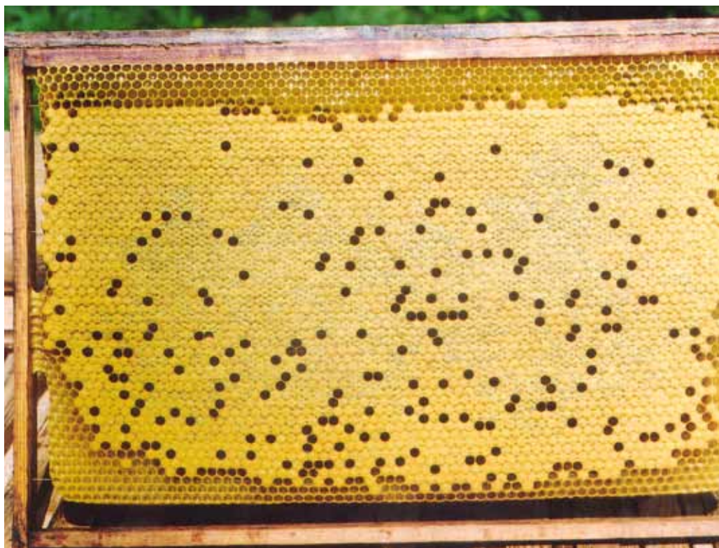
Terve töölishaue. Keskkel on tumedam osa: peagi väljuvad mesilased

1789. a leiuas Šveitsi pastor F. Huber liikuvate raamidega taru. Selle mõju mesindusele võiks