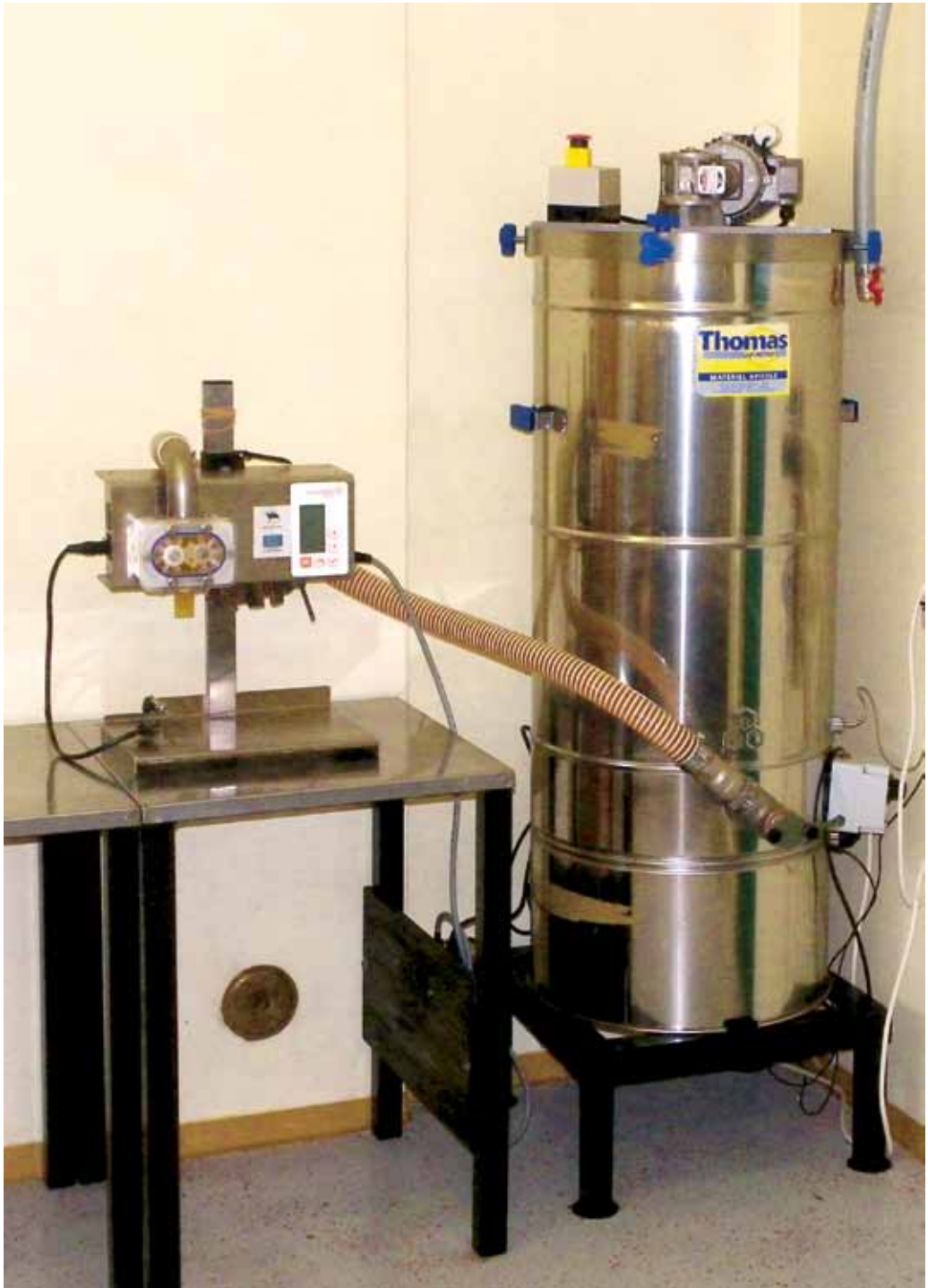
Roostevabast terasest mee segaja, millega saab valmistada kreemjat mett ja lisandiga meesegusid