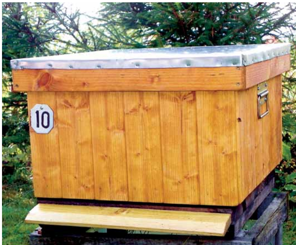
Taali Mesila uus puittaru

tootmisest. Seda tingimusel, et mesilasemad ja sülemid paigutatakse tarudesse, mille kärjed või kärjepõhjad on mahevahast. Need pered loetakse mahedaks, üleminekuperioodi ei kohaldata ja nende mett võib müüa mahe-dana. Saatelehtede jm dokumentide alusel kontrollitakse arvestuse pidamist ettevõttes olnud mesilasperede ja -emade arvu ja ettevõttesse toodud mittemahepõllumajanduslike mesilasperede ja -emade arvu suhet, samuti andmeid mesilasemade tõu ja päritolu kohta.