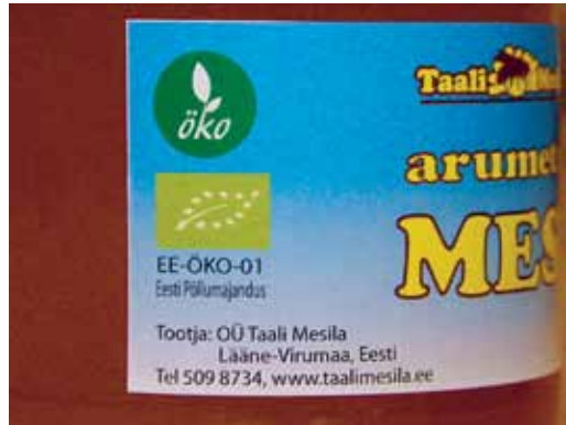
Viitamine mahepõllumajandusele toote etiketil. Vasakul on lisandiga ja paremal ilma lisandita mesi. Etiketil on ELi mahelogo, Eesti ökomärk, järelevalveasutuse kood ja päritolutähis

Kui on tegu lihtsalt pakendatud meega, siis on päritolutähiseks "Eesti põllumajandus" või „ELi põllumajandus“.