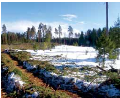
Talvine lageraie lank. Suvel hakkab siin vohama põdrakanep, üks paremaid meetaimi Eestis, mee produktiivsusega kuni 350 kg/ha

Täpse ülevaate saamiseks korjemaast tuleb hankida kaart. Maa-ameti geoportaali