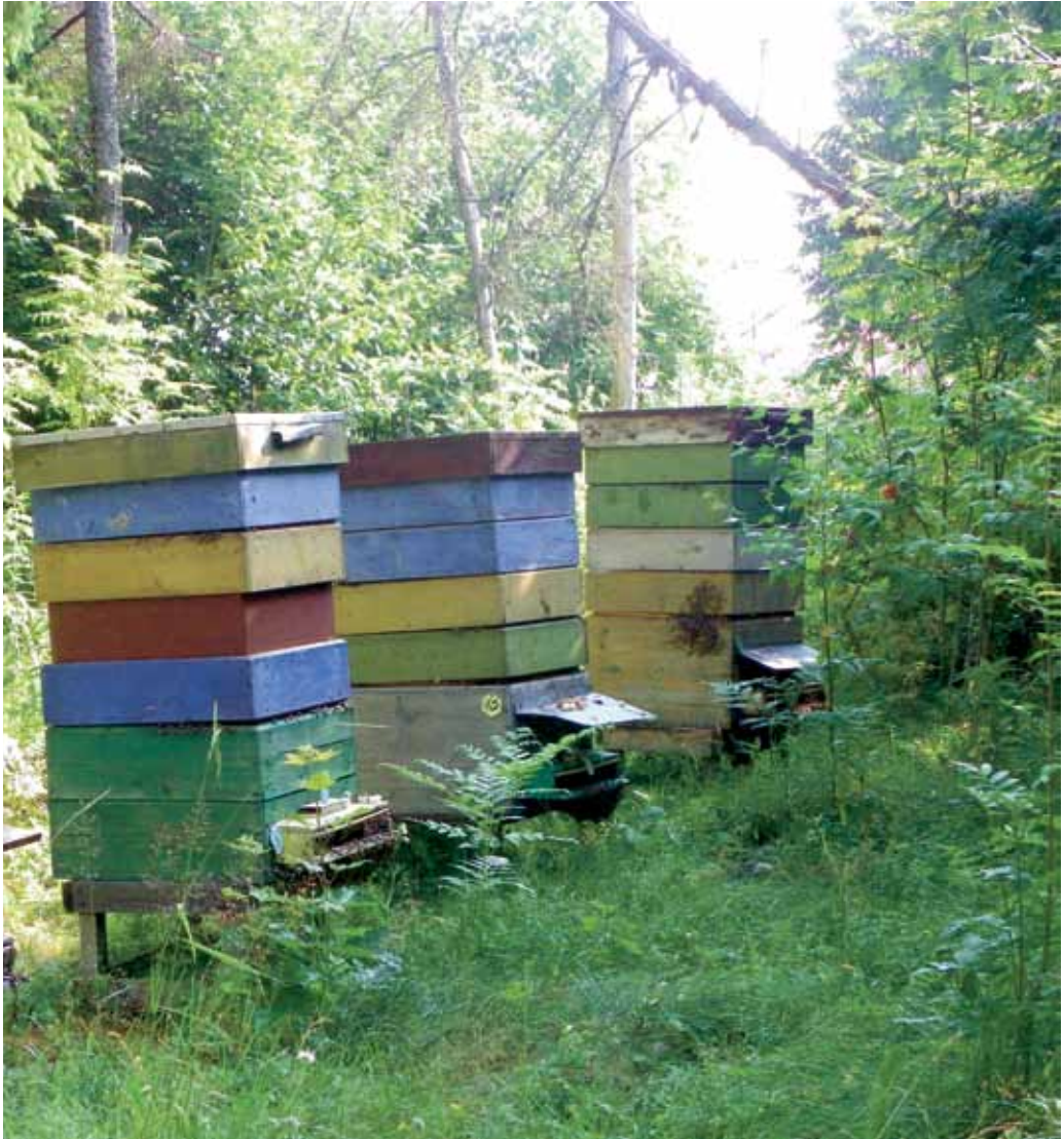
OÜ Taali Mesila, tarud paiknevad looduslike alade keskel metsaservas

Tarude märgistamise üks eesmärk on maheperede eristatavus tavaperedest. Tolmeldamise eesmärgil võivad ühes mesilas olla nii tava kui ka mahepered, kui täidetakse kõiki mahepõllumajandusliku tootmise eeskirjade nõudeid, v.a mesilate paigutust käsitlevad sätteid. Toodangut mahedana müüa ei tohi.