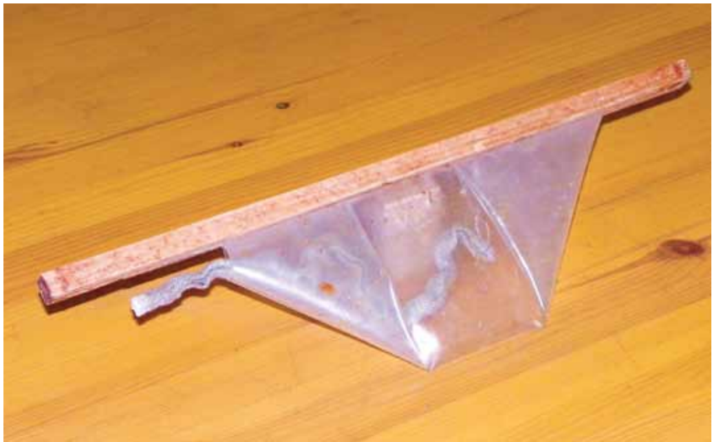
Isesevalmistatud sipelghappe auruti (nn pilotka) 1970-ndate lõpust, ajast, mil lest Eestisse jõudis (foto)

Kasutamine: kott täidetakse suurema süstla abil kuni 200ml sipelghappega. Taht uputatakse traadist konksuga korraks happesse ja tõmmatakse esialgu 2–3 cm välja. Kotike ase-