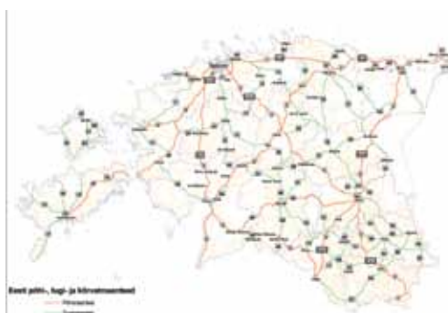
Joonis 2. Maanteeameti veebilehelt ( www.mnt.ee ) leiab kaardi Eesti põhi-, tugi- ja kõrvalmaanteede paiknemise kohta

( http://geoportaal.maaamet.ee ) kaardilt on lihtne leida oma mesila asukoht. Kaardile saab vedada mesila asukoha ümber ka vastavad ringjooned ning kaardi sobivas mõõtkavas välja trükkida (joonis 1). Kaardi põhjal võib, aga ei pea tegema täpsemat analüüsi korjemaast ja selle produktiivsusest. Kindlasti on vajalik analüüsida tavapõllumaa kasutamist – milliseid kultuure kasvatatakse, kas seal võib olla vajadus taimekaitse järele vm. Metsamaal