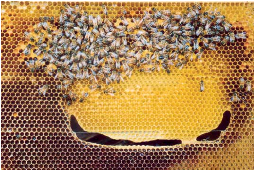
Mesilased on ehitanud kärje keskele väljalõigatud kärjeossa uue heleda kärje ja kasvatavad seal hauet

valmistada, mis ei pruugi aga olla igaühele jõu- ja taskukohane. Teine võimalus on teenustöö. Väikseim kogus, mille teenusepakujad eraldi ette võtavad, on 200 kg. Kui nii palju kaanetisvaha endal ei ole, siis peab selle kokku panema koos teiste mahemesinikega. Üleminekuajal on ettevõttel tavavaha, kärjed tarudes ja laos ning esmase käitlemise läbinud toorvaha ketastena. Lisaks võib olla eelmistest perioodidest järel ka tavavahast kärjepõhju, ning mahekaanetisvahast kärjepõhjad. Kahte viimast ei tohi segamini ajada.