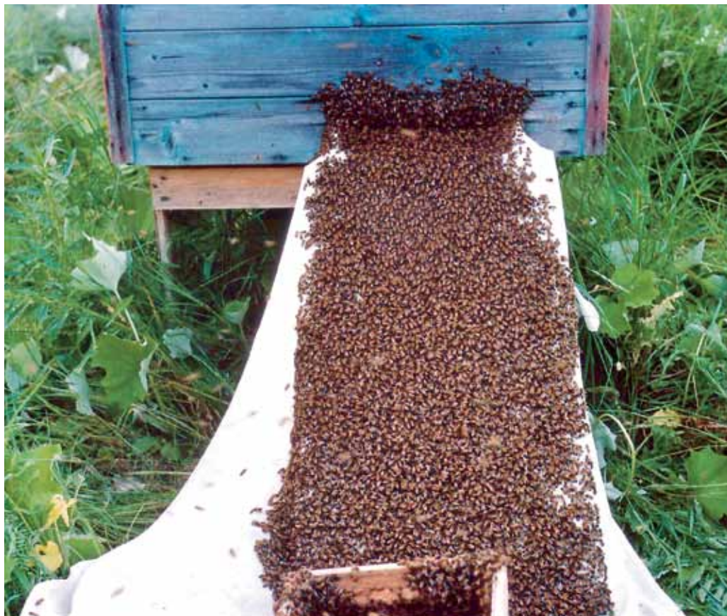
Sülem siseneb kastist tarru

Mesinik, kes on ainult PMA järelvalve all, võib pakendada ja müüa ainult oma ettevõttes toodetud mett. Tingimused mee vurritamiseks ja pakendamiseks peavad vastama toiduseaduse nõuetele. Meesegude valmistamise ja teiste ettevõtete mee pakendamise puhul on tegu juba töötlemisettevõttega ja selleks tuleb taotleda mahetunnustamist Veterinaar- ja Toiduameti poolt VTA.