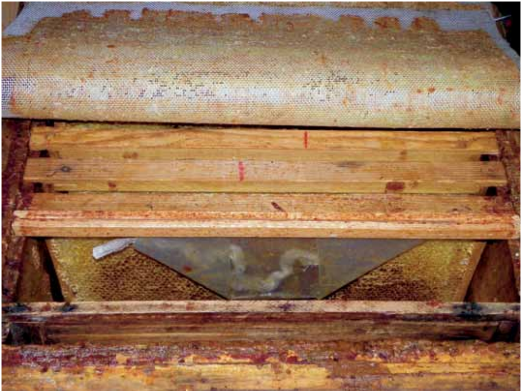
Isevalmistatud auruti on paigaldatud tarusse tööasendisse

tatakse lennuava suhtes kaugema äärraami ja vahelaua vahele, tahiga tahapoolle. Korpus-tarul eemaldatakse üks äärraam. Jälgitakse aurustumist. Ööpäevas peaks aurustuma vähemalt 7 g hapet.