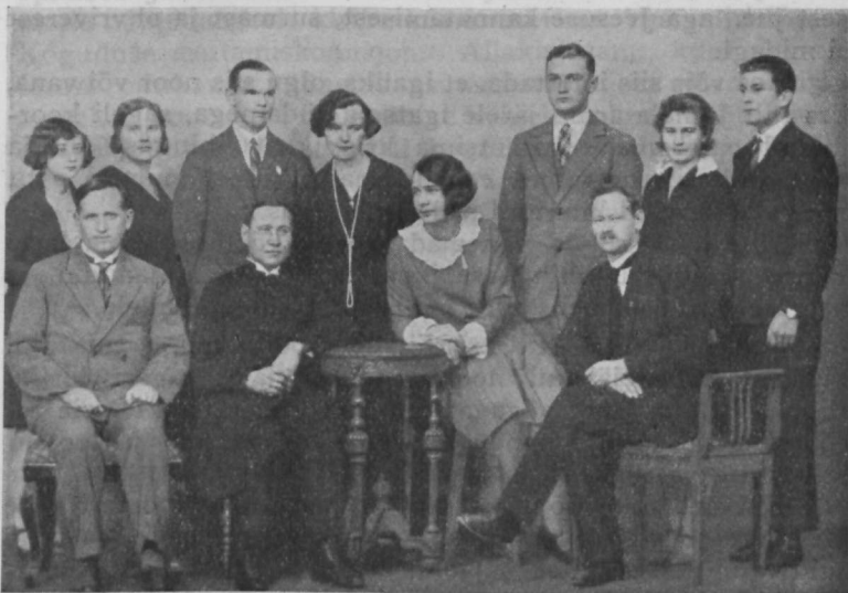
Noorte Koguduse asutamiskomisjon ühes õpetajatega.

On loomulik, et sellise tegevusega kristlikkudesse ühingutesse oli alul võimalik koondada väga mitmesuguste huvi-