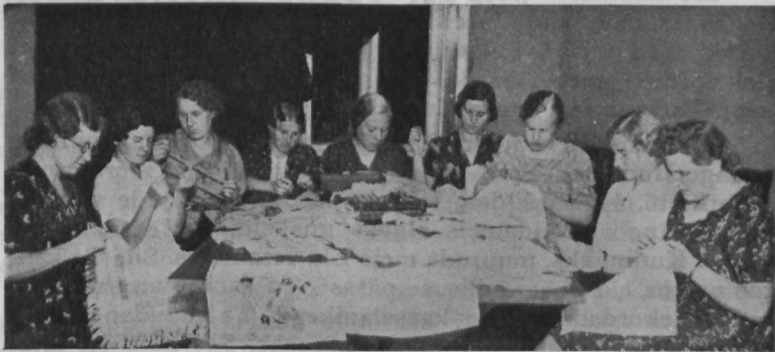
Noored hoolekande toimkonna tööõhtul.

Siin oleme meie, Noorte Koonduse tegevamad liikmed, kes me peaaegu igal õhtul puutume kokku üksteisega. Meil endil on palju raskusi ja muresid, ühel vähem, tei-