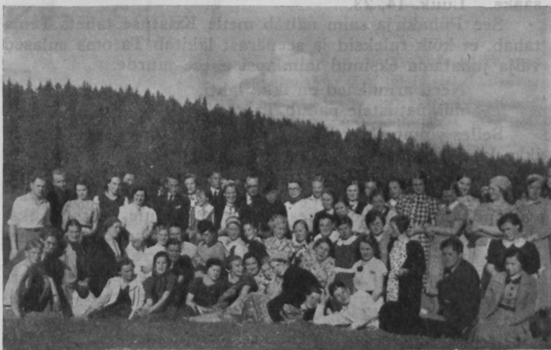
Kadrinas 1938. a. kevadel.

Meiegi oleme ristitud ja igal aastal õnnistatakse meid — sadandeid noori, kes kinnitavad oma ristimise testamenti.