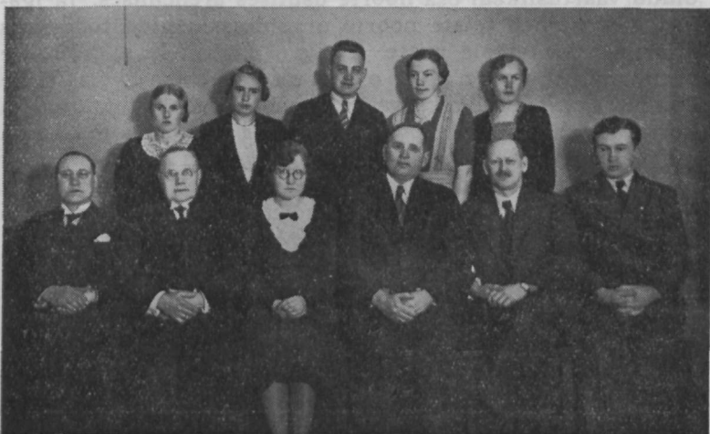
Noorte Koonduse Juhatus 10.-dal tegevusaastal.

Noorte Koondus on meie kogudusele andnud nii mõnegi elava, väärtusliku liikme. Kes elu leidis, see läks ja rakendas selle teiste teenimisele. Nad töötavad