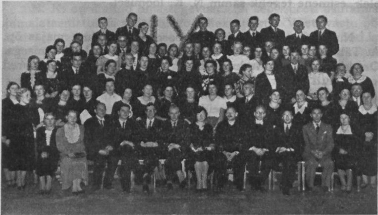
Noorte Koonduse üheksandast aastapäevast osavõtjaid.

Pärast jumalateenistust on kutsutud kõik kirikus olevad noored käärkambrisse. Tahetakse pidada nõu, kuidas noori