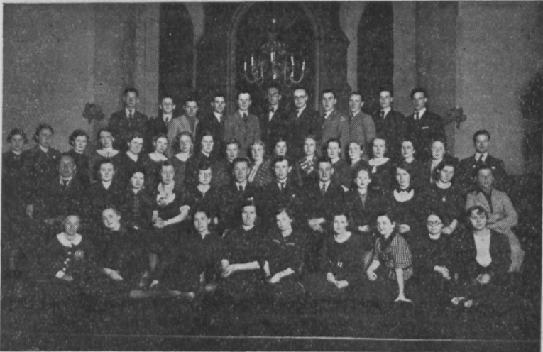
N. K. laulukoor kümnendal tegevusaastal.

Jumala armust on võidud teha seda tööd kümme aastat ja rohke õnnistusega. See oli küll raske ja vaevarikas algus, sest kogu töö eesmärgiks oli kuulutada Jeesust Kristust. Meil kõigil on aga teada, missugune on praegusel ajal tavaline suhtumine Kristuse isikusse ja ega see polnud teistsugune kümnegi aasta eest. Tänapäeva inimesele kõnelda Kristusest, see tähendab sageli anda talle ainult põhjust pilkeks ja naeruks. Ja ometi oli see väike rühm noori tundnud Kristuse elustavat väge oma hinges ja seepärast otsustati seda ha-