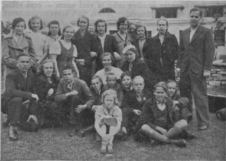
Leerieelsed ühes juhtidega Rannamõisas piiblilaagris.

Ja leerieelsed noored, milleks koondame neid ja milleks kogunevad nad järjekindlalt? Vastuseks tooksin ühe leerieelse noore väljenduse: „Me ei taha loota oma jõule, sest meil ei ole seda. Me otsime kedagi tugevamat, kellest võiksime haarata kinni ja kellele võiksime toetuda. Kui meie oma väljasirutatud käed ulatame Issanda Jeesuse kätte, siis tunneme, et Tema on meile kõigis abimeheks. Ja meie