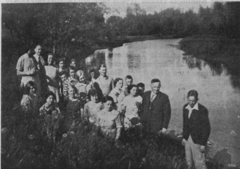
Kose Uuemõisas 1936. a. kevadel.

Ühine vaimulik laul meie noorte suus pole kõlanud mitte vaid meie kiriku ja kogudusemaja piires, vaid kõikjal, kus oleme olnud koos ühise perena, ikka jälle on kõlanud võimsalt meie suus meie armsad kirikulaulud. Ja millest muust peaksime viimselt hõiskama kui taevase Isa armastusest ja vägevusest. Küll oli esialgul vast mõnelegi noorele võõras laulda neid laule, mida on harjutud kuulma enamikus vanaemade ja vanaisade suus. Kuid nähes kogunevat üle