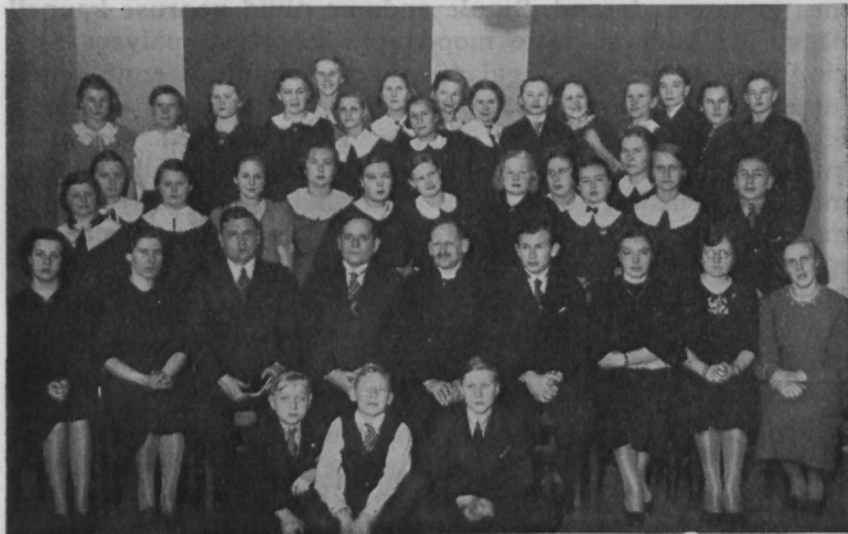
Leerieelsed ühes külalistega leerieelsete töö 3. aastapäeval.

Võitu ei saavutata ilma võitluseta, nii on see olnud ka Noorte Koguduse — 1936. aastast alates „Noorte Koonduse“ — elus. Kui 1936. a. lahkus N. K. esimees ja ühtlasi kogu juhatus, kui seisime tõelise kriisi ees, see oli küll meile, noorile, raskeimaks ajaks. Ei teinud meile paljuile muret meie isiklik käekäik, kuid N. K. elu ja edaspidine käekäik oli valusa küsimusena meie südamel, sest see töö oli saanud