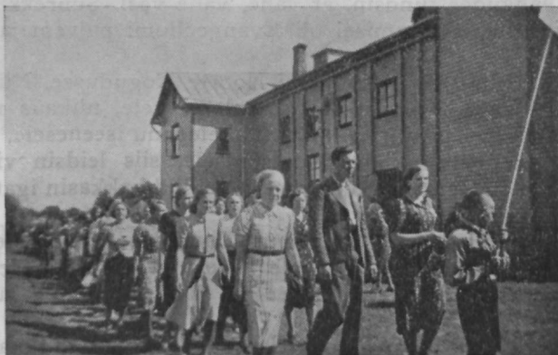
Jaani noori rongikäigus Paides 8. Kirikunoorte Päevil.

See oli ühel hilissuvisel pühapäeva õhtul, kui tulime hulgake Kuressaare „Jeesuse Sõprade“ ühingu liikmeid um-