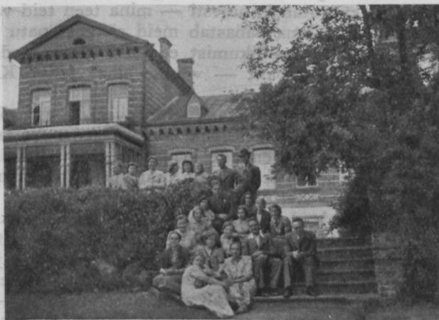
Noored Pühajärve turistide kodus.

Seistes nüüd oma koondusega kümnenda kilomeetri positi juures, pöördub silm nagu tahtma ka möödunud radadele.