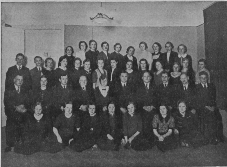
Tallinna Jaani N. K. piiblitunni rühm.

Kas tunneme selles noores inimeses enese? — Meiegi tahame kõige paremat, püüame selle poole, mis õilis ja ilus,