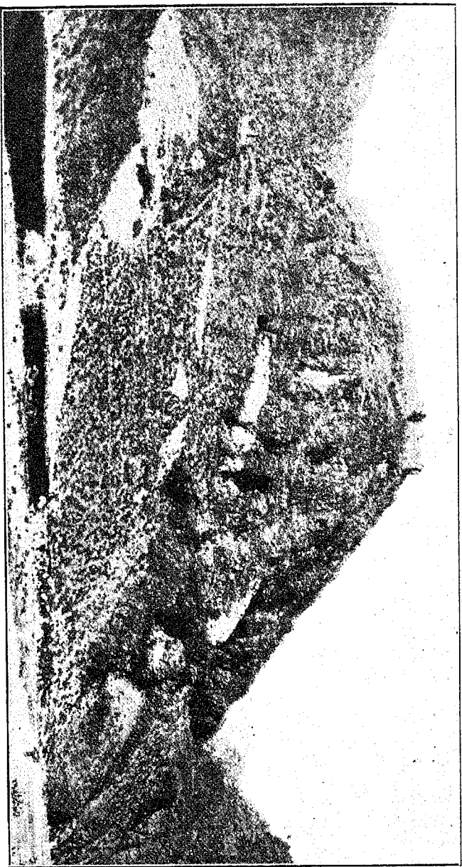
Ключъ къ Индіи (Фортъ въ Хайберскомъ проходѣ).