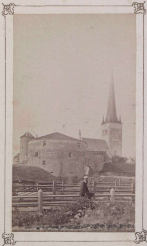
Verlag von Ferd. Wassermann in Flensb.