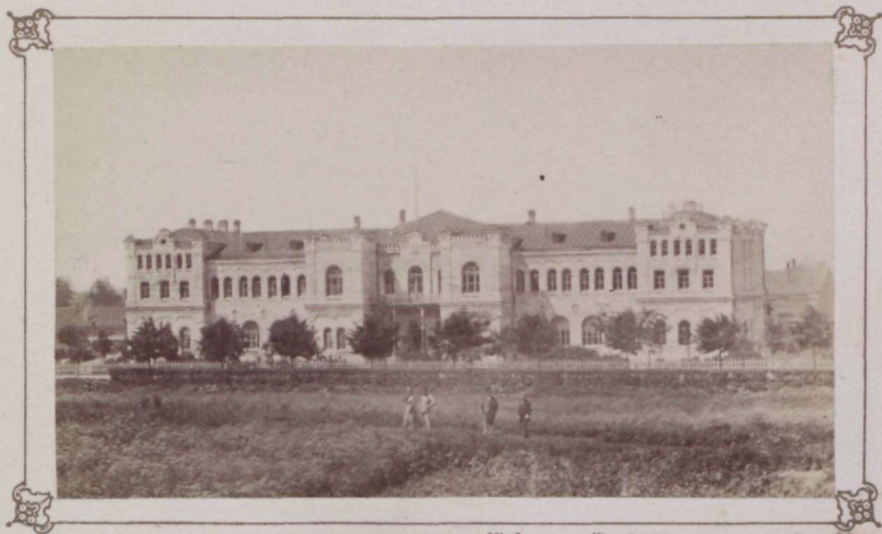
Verlag von Ferd. Wassermann in Frankfurt.