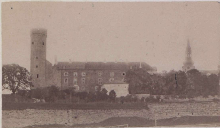
Palas von Ferd. Wassermann in Royal.