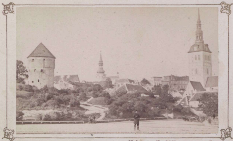
Ansicht von Riga von Ferd. Wassermann in Riga.