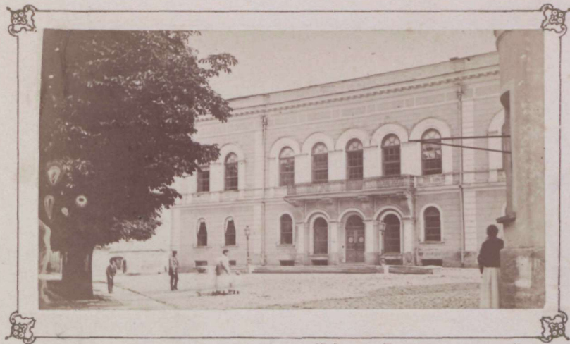
Verlag von Ferd. Wasmann in Aachen.