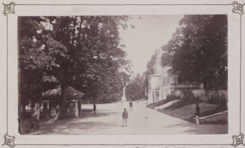
Zeichn. von Ferd. Wassermann in Florenz.