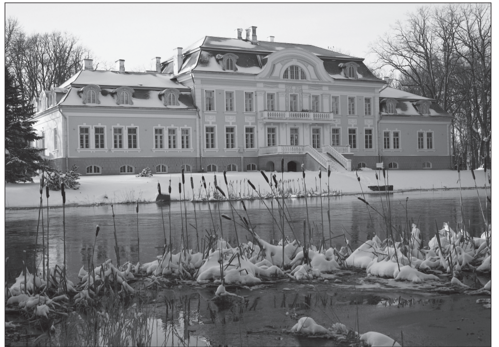
Laupa põhikool valiti eelmise aasta lõpul Eesti kauneimaks kooliks.

Mihkli isa sai Lillenõmme peremeheks 1923. aastal, kui ta lõpuks demobiliseeriti. Praeguse ni korras olev kahekordne elumaja valmis 1928. aastal.