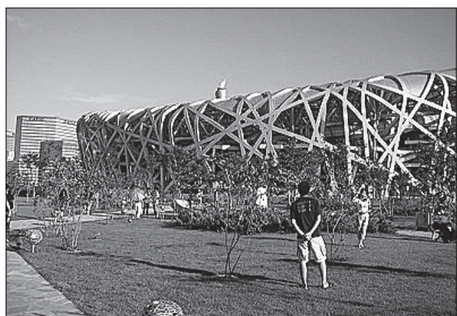
Linnupesaks ristitud olümpiastaadion.

Minu arvates kõige raba- vana ehitus, mis rajati spetsiaalselt olümpiamängude tarvis, oli hoopis televisiooni peamaja. See hollandi arhitekti poolt projekteeritud