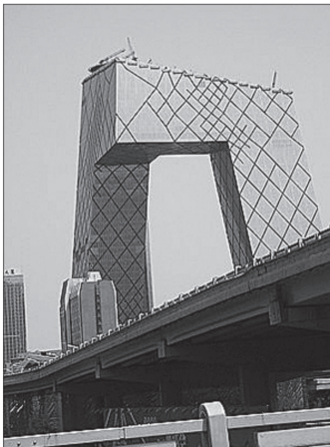
Väga tähelepanuväärse arhitektuuriga televisioonimaja.