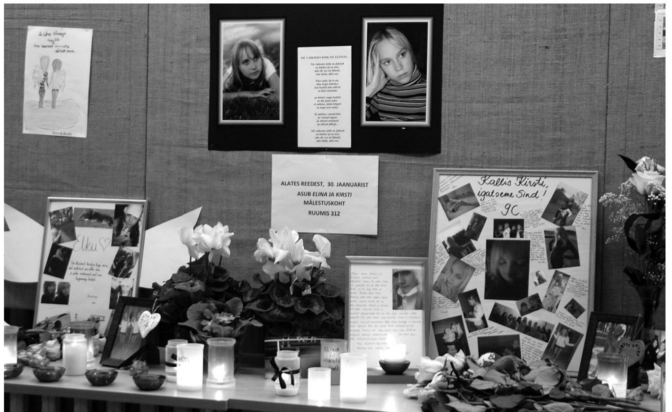
Terve nädala põlesid gümnasiumi fuajees küünlad, toodi lilli, kirjutati järelhüüdeid, mälestati vaikelt... Kool leinas hukkunud õpilasi.

Neljast osavõistlustest koosnev Honda Racing noorteralli teine etapp sõidetakse esialgse kava kohaselt 19. aprillil Otepääl.