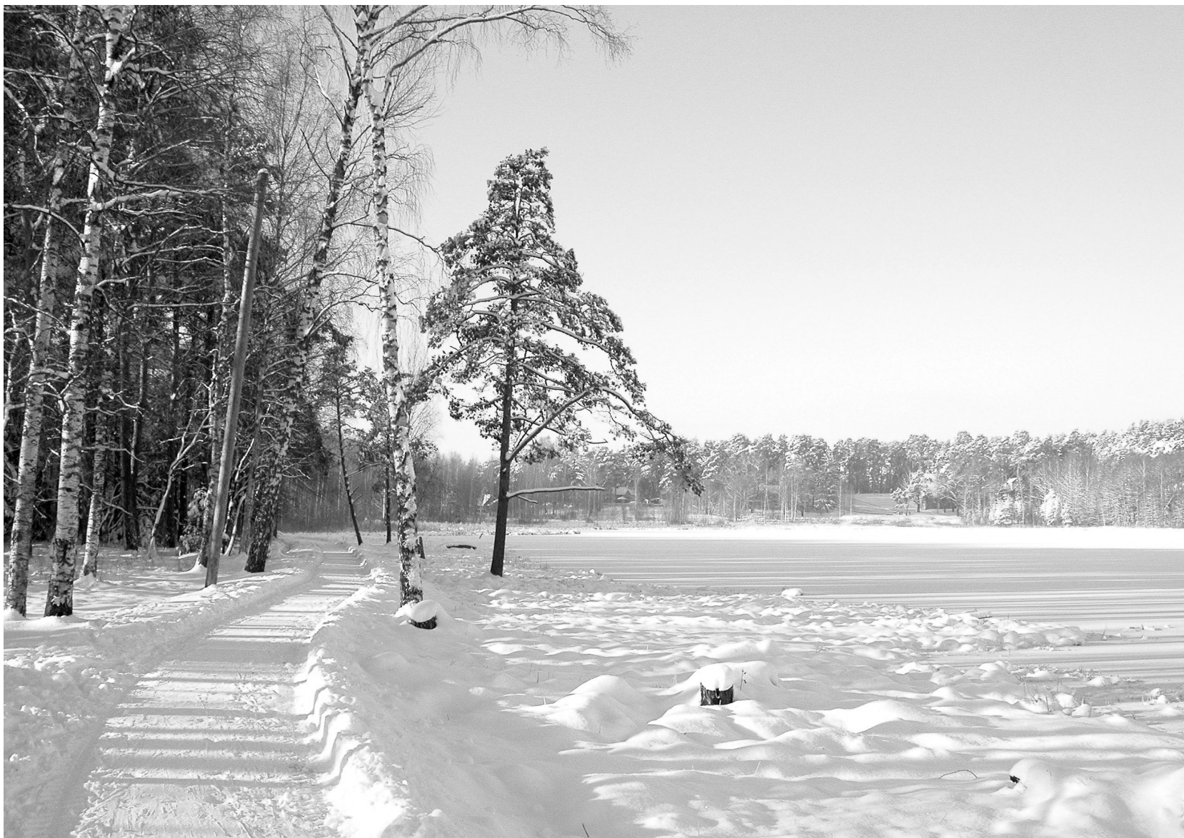
Arbi järve Kesk tänava poolset kaldaala süvendatakse ja kaetakse kruusaga.