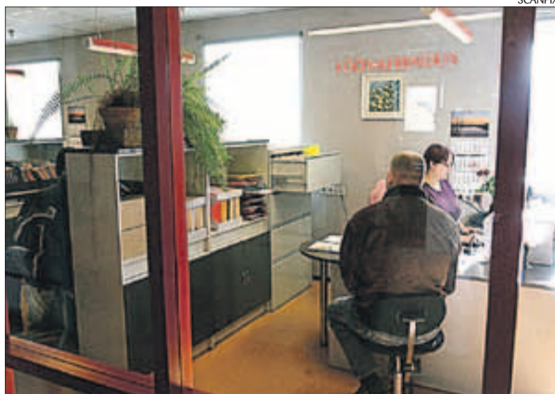
Tööst ilmajäämise korral tuleb ennast aegsasti tööturuametis arvele võtta.

Töö kaotamine on tavaliselt ootamatu ja tuleviku suhtes suurt ebakindlust tekitav olukord. Olles aga esimesest ehmatuses toibunud, on aeg end töötuna arvele võtta ja hakata otsima uusi väljakutseid. Viivitada ei maksa kas või seetõttu, et haigestumise korral peate oma ravikulude eest ise tasuma. Et tööturuametist abi saada, tuleks ennast töötuna või töötajana arvele võtta. Mõistlik on pöörduda sellesse tööturuameti osakonda, kus teil on kõige mugavam hakata käima igakuistel vastuvõttudel. Kindlasti tuleks mõelda sellele, et hüppeliselt kasvavad tööpuudus on tekitanud tööturuameti osakondades järjekorrad. Tavaliselt on nädala esimeses poole