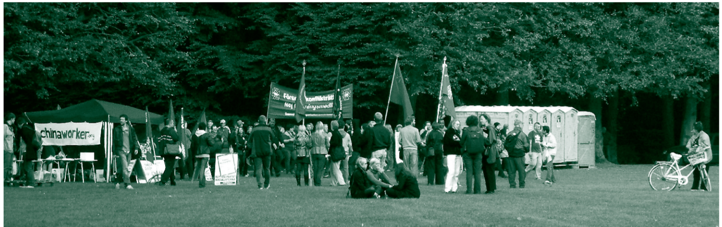
Koimetunnine sotsiaalfoorumit paraad saabub Malmö staadionile, järgneb poole ööni kestev pidu.

Intervjuu Eesti Rohelise Liikumise rohelise toote kampania juhi Enda Pärismaga