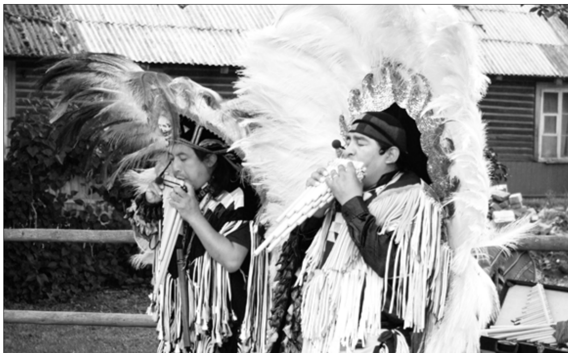
Привет эстонским хуторам с перуанских фазенд. Выступают гости из Перу. Экзотики на Днях хуторов было достаточно.