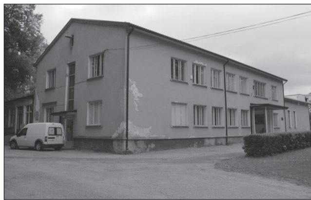
Kui riik kärbib investeeringusummasid, tuleb üle vaadata kultuurimaja renoveerimise võimalused.