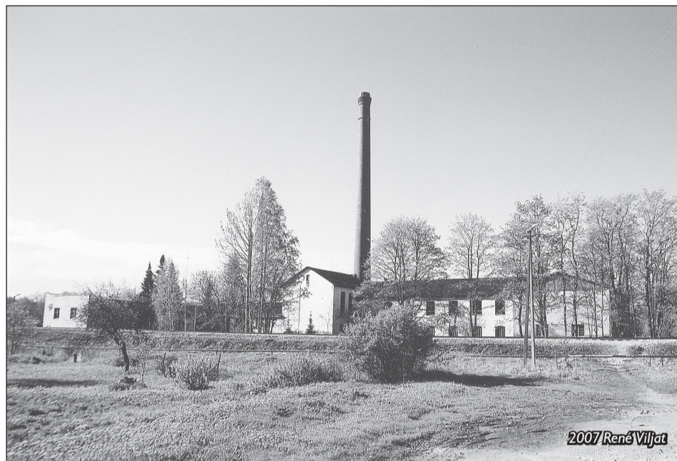
2007 René Viljat