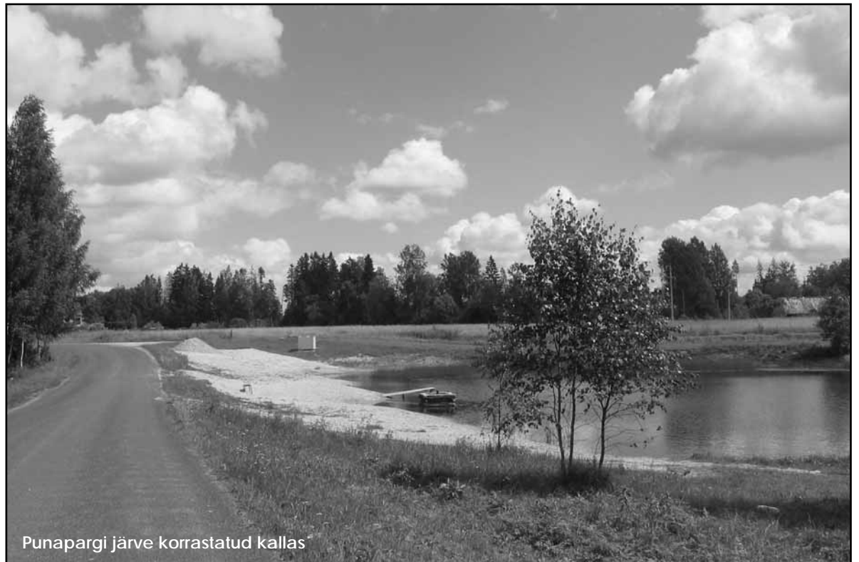
Punapargi järve korrastatud kallas

Veekogude avalik kasutamine on sätestatud Veeseaduses ning avalikult kasutatavate veekogude nimekirja kinnitab vabariigi valitsus. Veekogu avalik kasutamine on veevõtt, suplemine, veesport, veel ja jää liikumine ja kalapüük seaduses sätestatud ulatuses. Veekogu avaliku kasutamise eesmärk on rikkuda võõral maastikul viibimist reguleerivaid seadusesät-