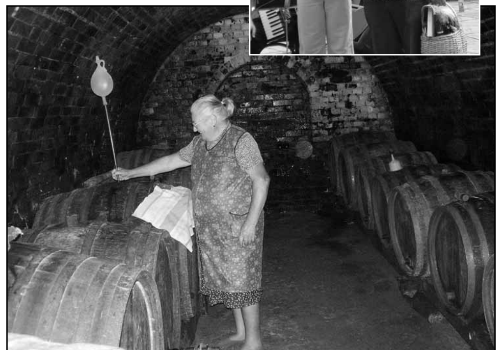
Vanaema veinikeldris askeldamas