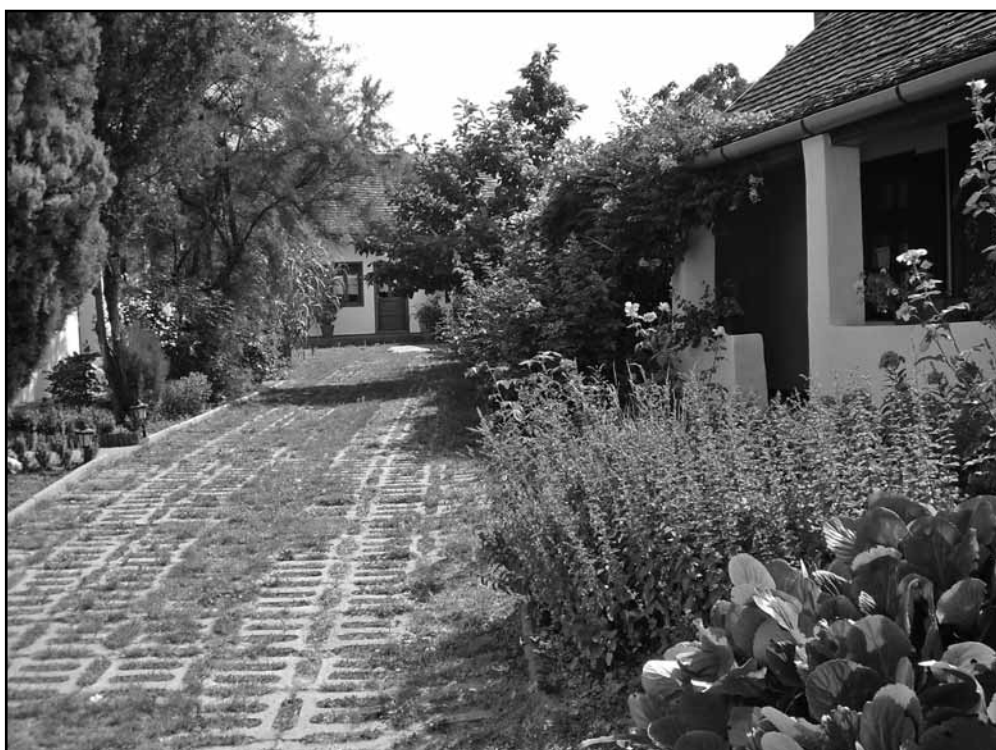
Siseõu on väike, kuid õdus