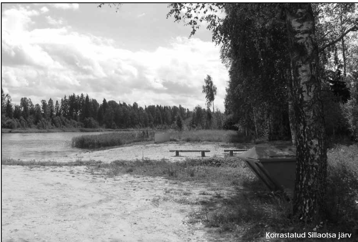
Korrastatud Sillaotsa järv