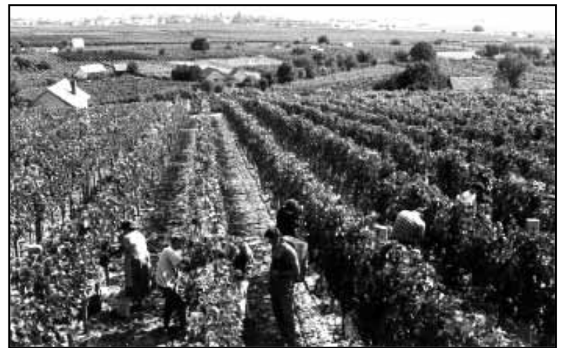
Viinamäel käib hoolas töö