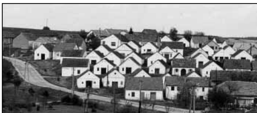
Veinikeldrid asuvad kobaras koos küla ühes otsas.