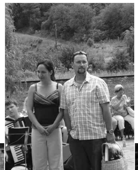
Külavanem koos prouaga