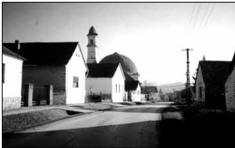
Palkonya peatänav valgete majade ja kirikuga.

Palkonya küla asub Ungari lõunapiiril, elanikke on 350, maju 110 ja veinikeldreid 53. Paikneb Villány veinipiirkonnas, kuulsal Villány-Siklósi veiniteel. Peale II maailmasõda, kui eraettevõtlus oli välistatud, jäid unarusse ja rohtusid vanad viinamarjaisandused – viinamäed. Rahvas läks tööle linnadesse. Alates 1989. a on olukord muutunud, rahvas tuleb jälle maale tagasi ja leiab tööd siinsetel viinamägedel. Vanad veinikeldrid on taastatud ja võetud muinsuskaitse alla.