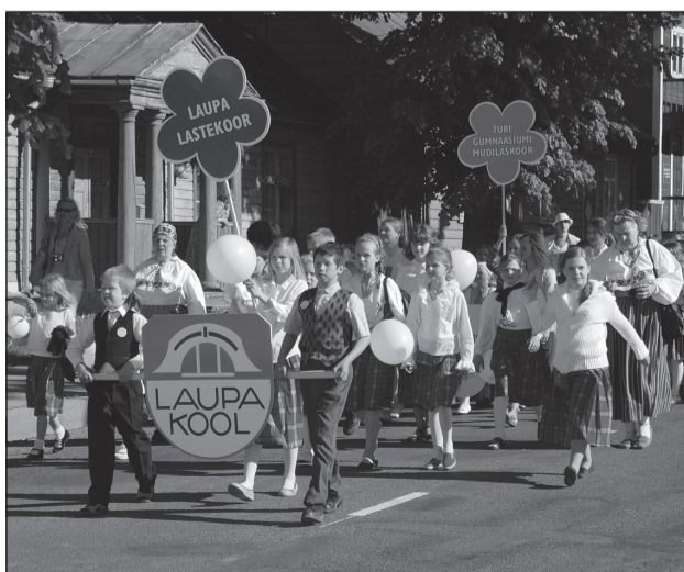
Laupa põhikooli lauljad laulupeorongkäigus.