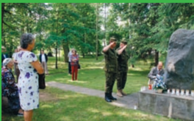
Leinapäeval asetati küünlad küüditatute mälestuskivi juurde.