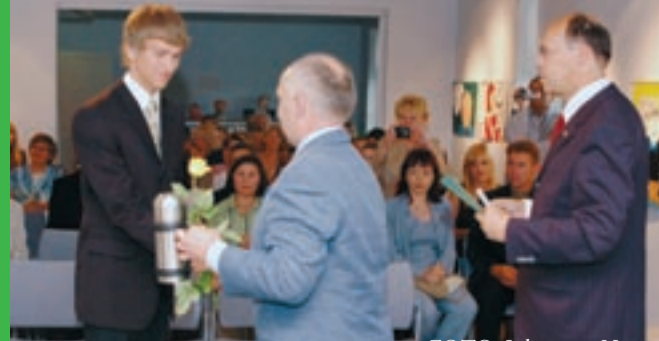
Parimad põhikooli ja gümnaasiumi lõpetajad olid palutud piduliku vastuvõtuks.