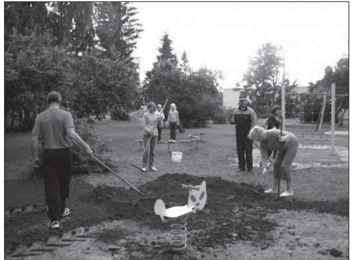
Tantsuseltsi heakorratööd mänguväljakul.

Tantsuselts Opsal ja Puhja Vallavalitsus paluvad kasutada mänguväljakut heaperemehelikult. Kui me ei hoiä täna ehitatud, siis ei saa me ju homme midagi uut ehitada.