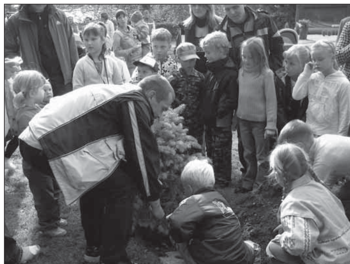
Lapsed koos vanematega puud istutamas.