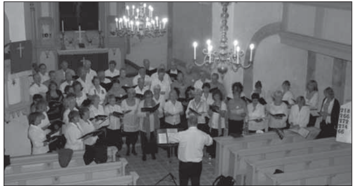
Lauljad Puhja kirikus

Viies pilt: Puhja kirik. Kõlab kaunis muusika mitmes keeles: Rootsimaad esindab koor Schola Cantorium Stockholm, Norramaad Salten Festivalkor ja meie oma Eestimaad Lauka segakoor Hiiumaalt. Kokku 105 lauljat.