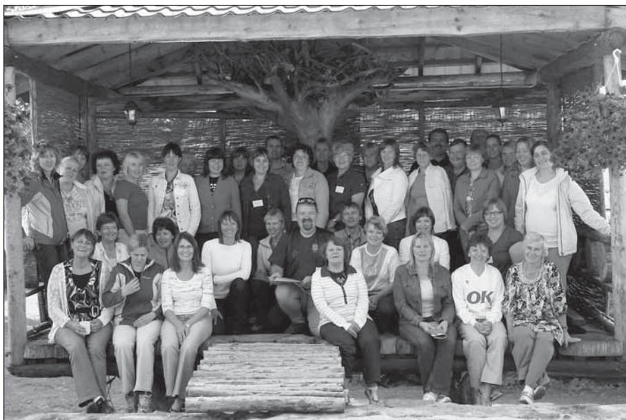
Tartumaa terviseaktiivi esimest kokkusaamist jäi meenutama ühispilt.

Terviselagri läbiviimist toetasid Tervise Arengu Instituut ja Eesti Haigekassa.