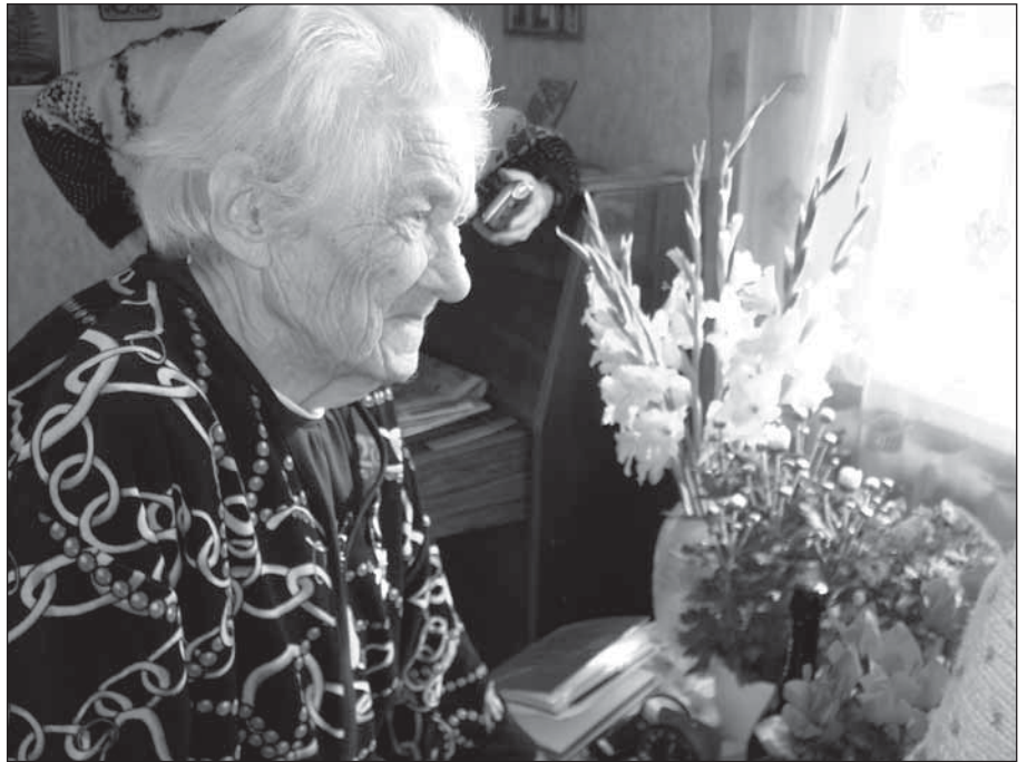
104-aastane sünnipäevalaps.