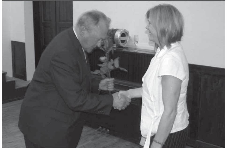
Vallavanem õnnitleb Tartumaa aasta õpetajat.

Puhja vald pole tõenäoliselt mingi murevaba tsoon, aga hea on vahelgi teada, et inimene on tähtsam kui raha.