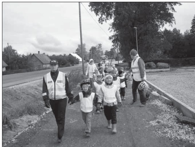
Uuel kergliiklusteel on 5–6-aastased lapsed.

Puhja Lasteaia liikluskasvatuse kogemust käisid septembri lõpus uudistamas ka liiklusohutusspetsialistid kõigist maakondadest. Lisaks lasteaiale said sõna ka Puhja kooli ja valla esindajad. Koostöö ja ühised eesmärgid on märksõnad, mis kindlasti aitavad parandada ka meie aleviku liikluskultuuri ning muuta ohutumaks liiklemist nii jalakäijatel kui autojuhtidel.