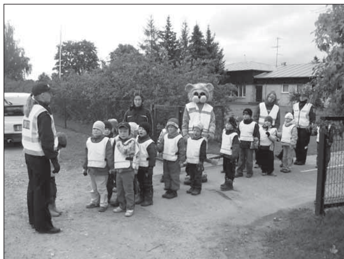
Õppekäiku alustab vanem rühm.