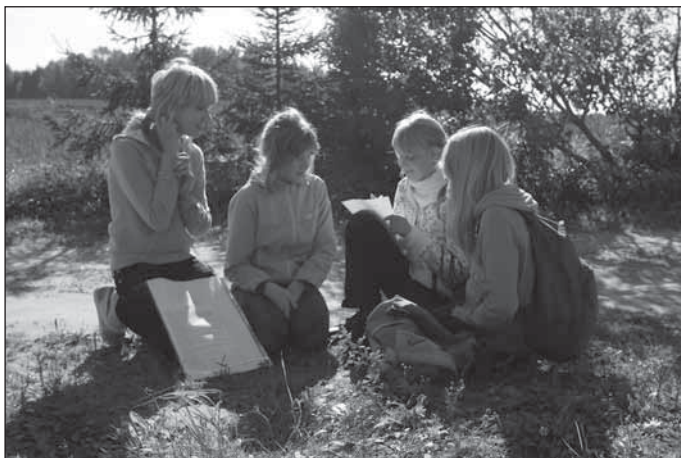
Puhja kodutütred teadmistetest lahendamas.

Lõunaks jõudsid esimesed võistkonnad söögipunktini, kus meie Jana Halvita ja Eneli Härma kooli söökla valmistatud seljankat-moosipirukat pakkusid. Lõbus matkarada jätkus. Kuna rajal olid ka postkastid, kus nuputamises ülesanded varuks – puudetundmise ristsõna, salakiri, märksõnad matkalaulu koostamiseks – siis ei pidanud ükski võistkond järgnevat õhupüssist laskmise kontrollpunkti oodates igavust tundma. Oli neid, kes esimest korda õhupüssiga märklauale pihta saada üritasid ja neid kes snaiperioskustega hiilgasid. Rada kulges piki sügisvärvitud puulehtedest külateed. Kuues kontrollpunkt pani ajud kõvasti ragisema, sest ees ootas teadmiste test – kes on KT peavanem, eesti ministrid, liiklusküsimused, mis on Kaitseliit? Tuli väga kummalisi-naljakaid vastuseid, kus muuseas pakuti, et KL on ühinenud rahvaste ühendus.