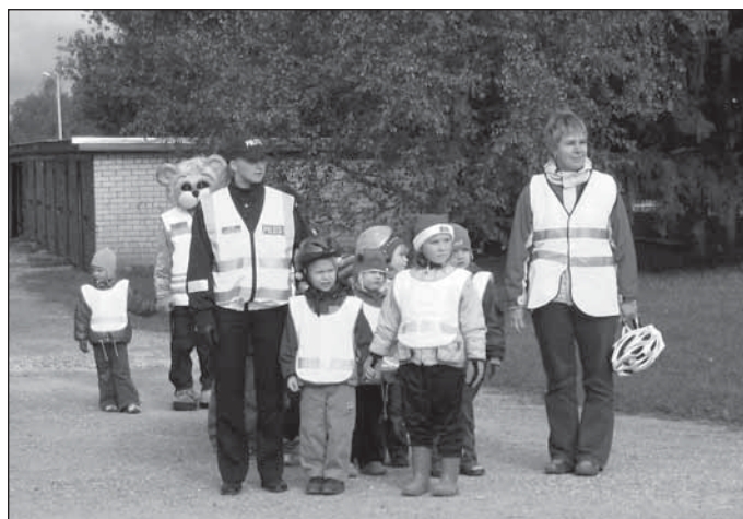
Stopp! Enne peatu ja siis ületa sõidutee!