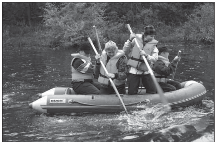
Neljakesi paadis – Puhja poisid esmakordselt matkamängul.

Viiendana ilmakaarte määramise kontrollpunkt. Kõik võistkonna liikmed tõmbasid loosiga ühe ilmakaare, omavahel suhtlemata pidid nad 2 minuti pärast seisma näoga saadud ilmakaare suunas.