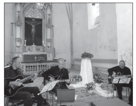
Weekend Guitar Trio.