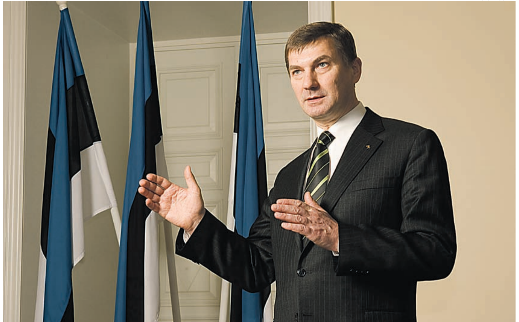
Peaminister Andrus Ansip hinnangul on Eesti kõige olulisem lähituleviku eesmärk ühinemine euroalaga.