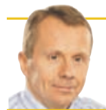
Jürgen Ligi, Riigikogu rahanduskomisjoni esimees