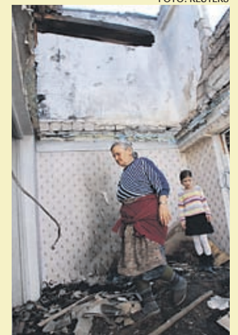
Grusiinide sõjast laastatud kodud tuleb taas üles ehitada.