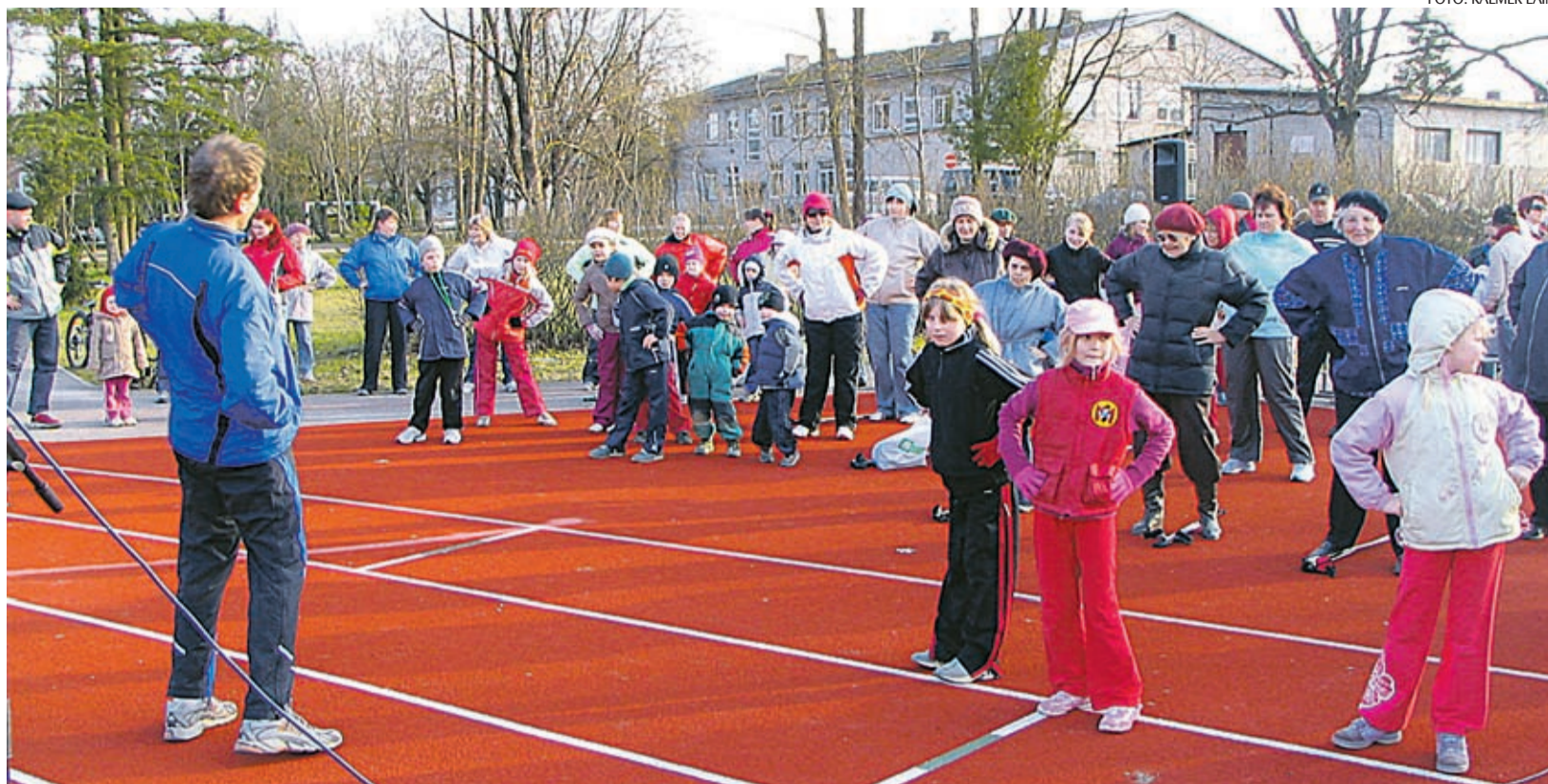
Jõgeva uus staadion pakub sportimiseks häid võimalusi.