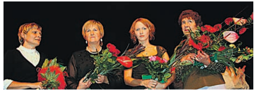
Võru tublimad õpetajad pälvivad tunnustuse.

REFORMIERAKOND Tõnismägi 9 10119 TALLINN