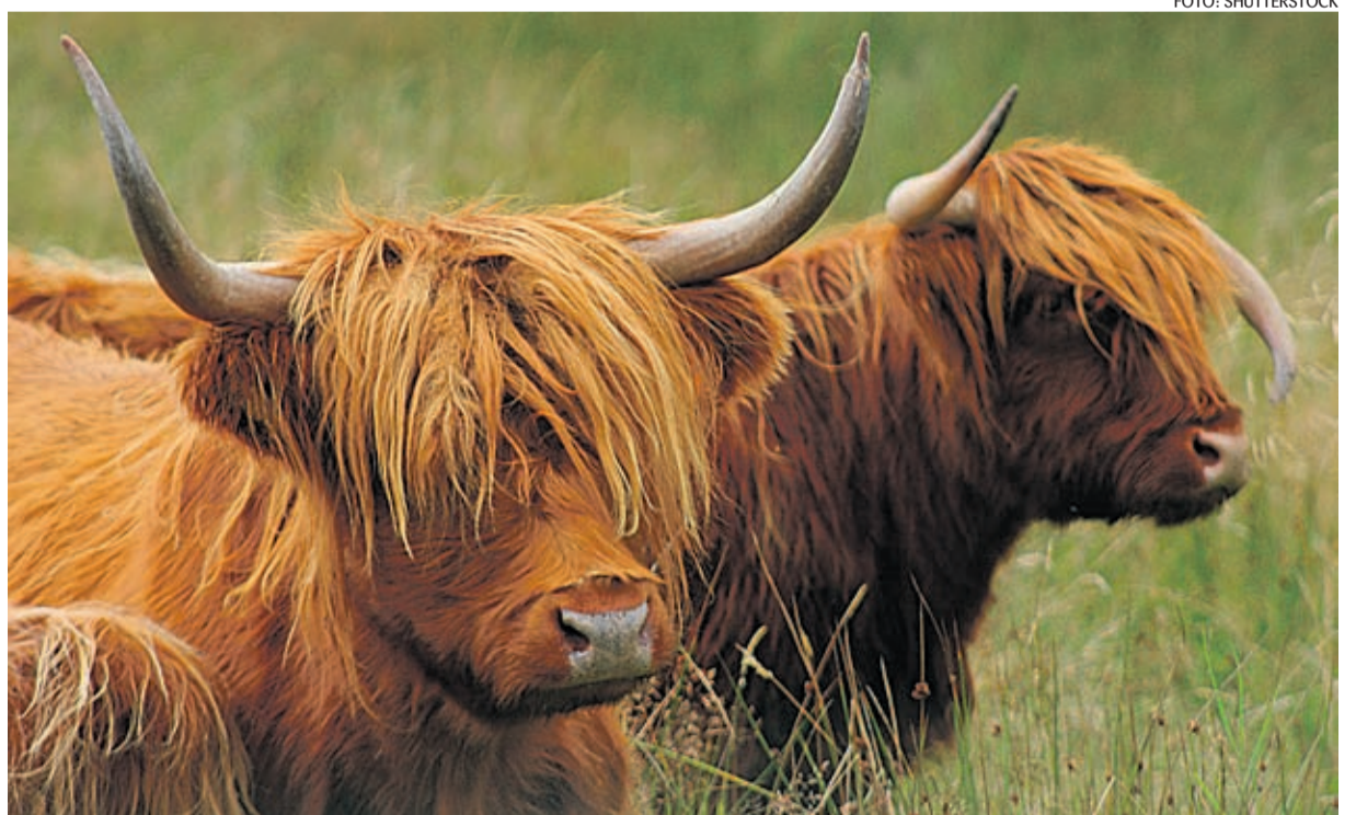
Šoti mägiveiseid kasvatatakse juba mitmel pool Eestis.

Maaelu töörühm tõi välja, et ministereeriumid peaksid maaelu aren-