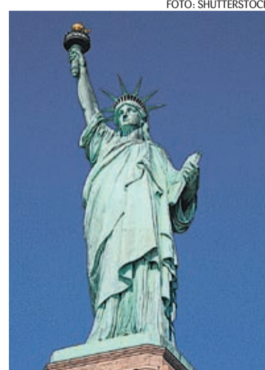
Nüüdsest saavad Eesti kodanikud vabalt vabaduse sümbolit – New Yorgi vabadussammast – külastada.