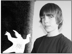
Tallinna linnahallis jagati Tantsivaid Hunte. Lk 2