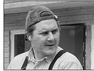
Uus aianduskauplus kutsub külastama. Lk 5