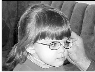
Lõviklubi kinkis lastekodulastele prille. Lk 3