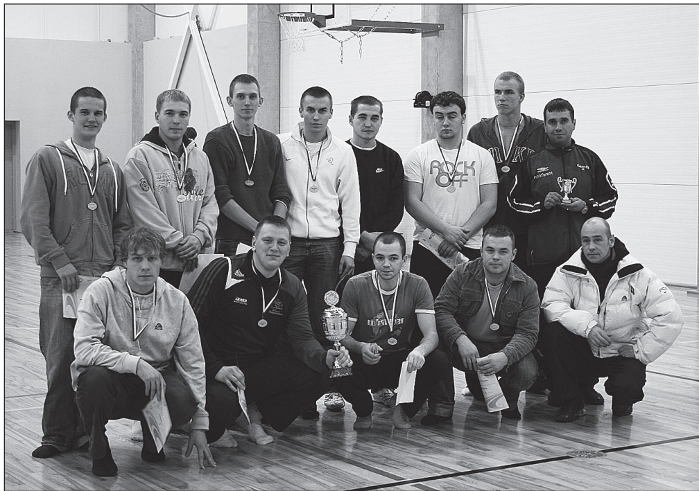
Ganvix JK meeskonna selle hooaja esmane eesmärk on teise liigasse püsima jääda.

10.-13. aprillil Järvamaa meistrivõistlused bowlingus Türi-Allikul Veskisilla bowlingusaalis. Eelvoorud 10.04 kell 21; 11.04 kell 17.30; 12.04 kell 11. 12. aprillil Eesti jalgpallimeistrivõistluste teise liiga II voor Türi Ganvix JK ja Sörve JK vahel Pärnu kunstmuruväljakul kell 14. 13. aprillil Kuma GP bridžis restoranis Paide kell 10. 17. aprillil Järvamaa murdmaajooksu meistrivõistlused Türi majandusgümnaasiumi staadionil kell 18.