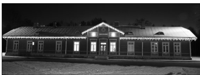
Elva raudteejaam jõuluvalguses.