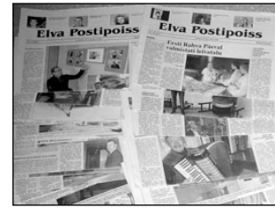
Millest kirjutasime aastal 2007. Lk 4-5