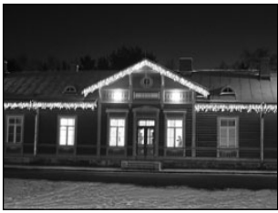
Elva linna aasta teo valimisel võistlesid omavahel raudteejaam ja loomakliinik. Lk 2