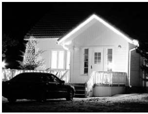
Elvakad olid tänavu jõulukaunistustega rohkem vaeva näinud. Lk 3