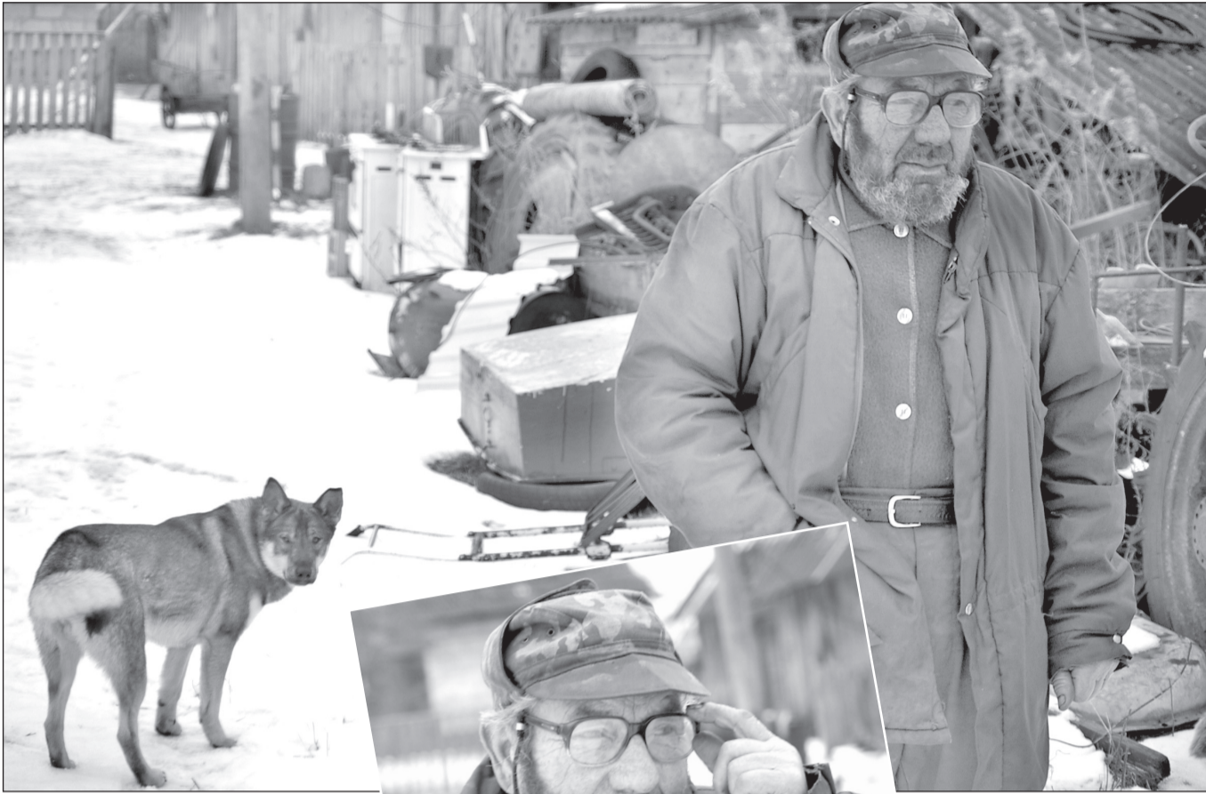
RAHMANI JANI PILDID

Autopoodist ost Volmar päämidelt piimä, leibä ja viina. «Vorst mullõ nii väega