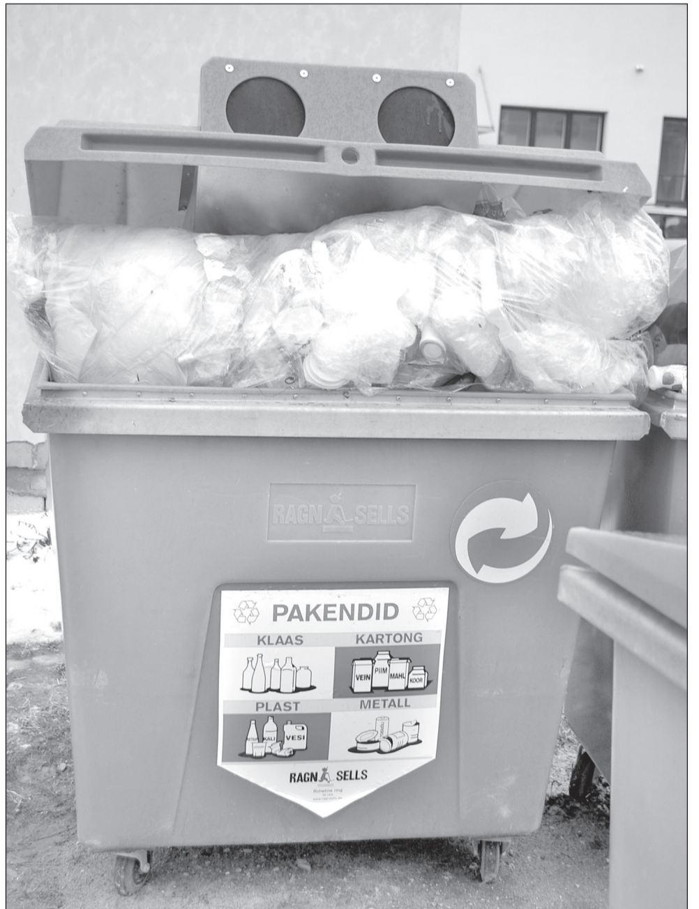
HARJU ÜLLE PILT

Viil ütelf tä, et piimäkraam, miä om katskidsõ koti seeh, vöi ka kassaboksi är tsurki.