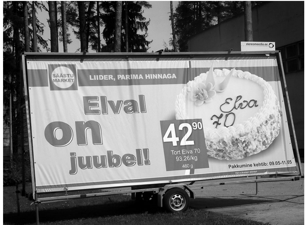
Messil võib osaleda ka nii, ise kohal olemata. Ja ometi võib väljapanekust tunda, et mõtetes ollakse Elva rahvaga.

"Kiiruse peale laseme laduda, kas näpud saavad väikeste pulgakeste võtmi-