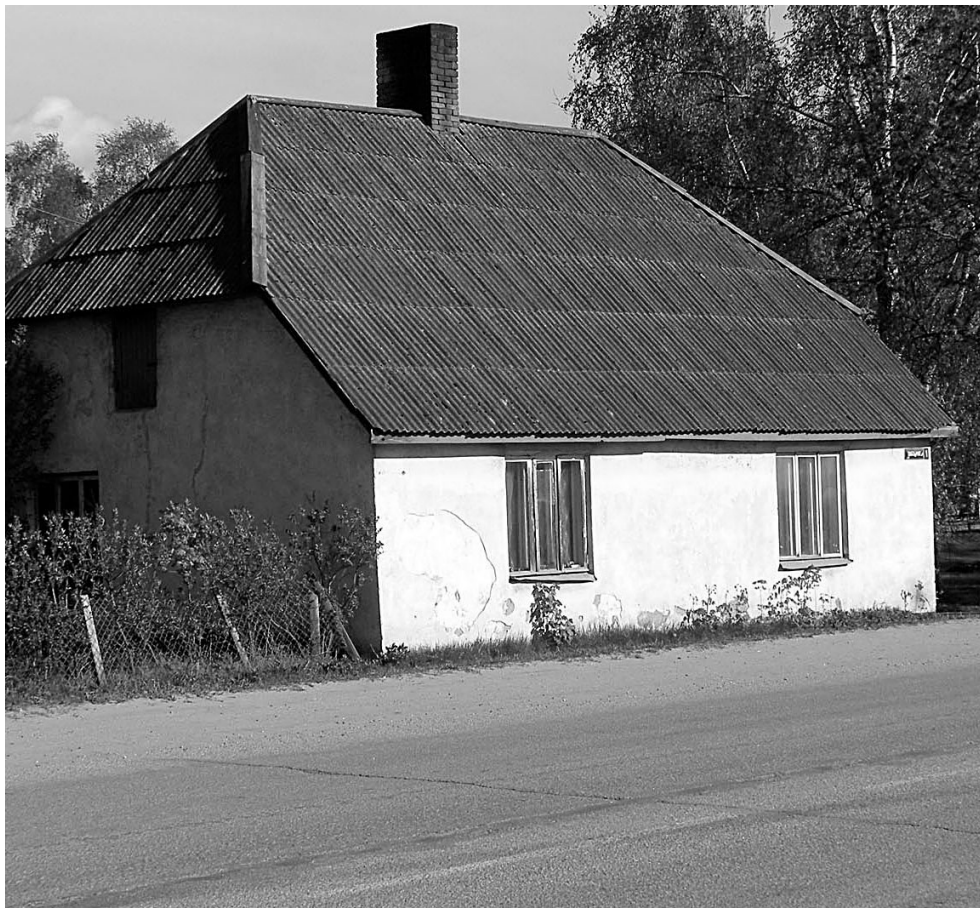
Keda huvitab, mis saab Elva vanimast majast Tartu mnt 1?