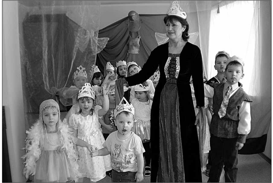
• Printsessid ja printsid tulevad!