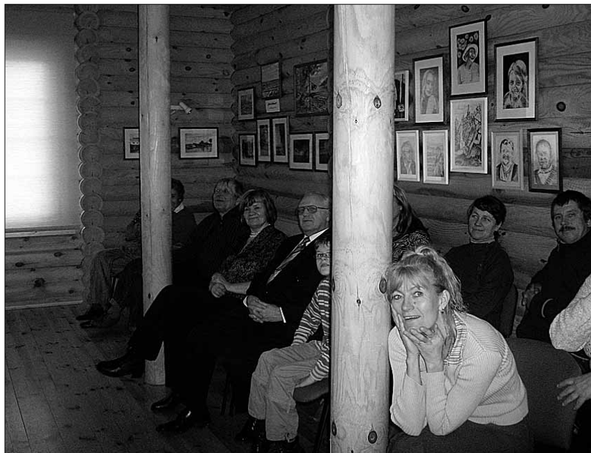
● Valma külamajas