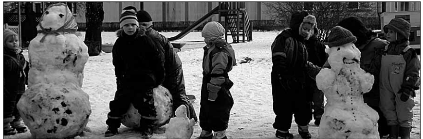
• Talv pakkus lumememmerõmu napilt.

6. aprillil kell 14 toimub Tännassilma rahvamajas Vanavälja küla koosolek, et avaldada umbusaldust külavanemale.