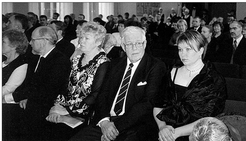
● Pidulik valla õhtu Vana-Võidus. Esiplaanil on külalised Soomest.