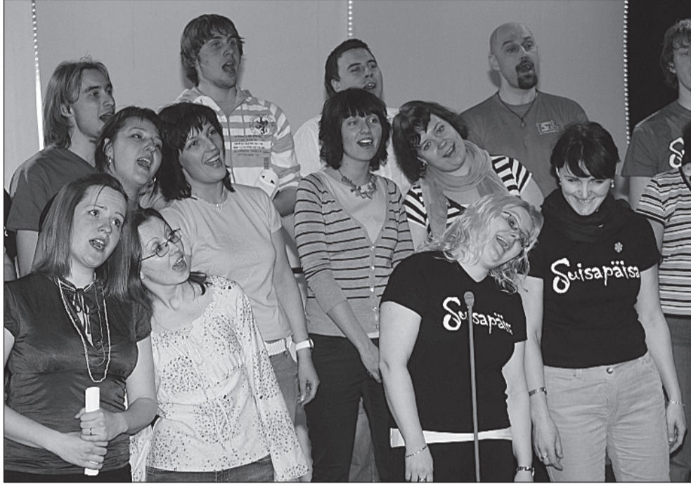
Pilt on tehtud telemajas, kus segakoor Suisapäisa oli ametis mõni nädal varem kodus selgeks õpitud laulu „Vaikus on kuldne“ harjutamisega.