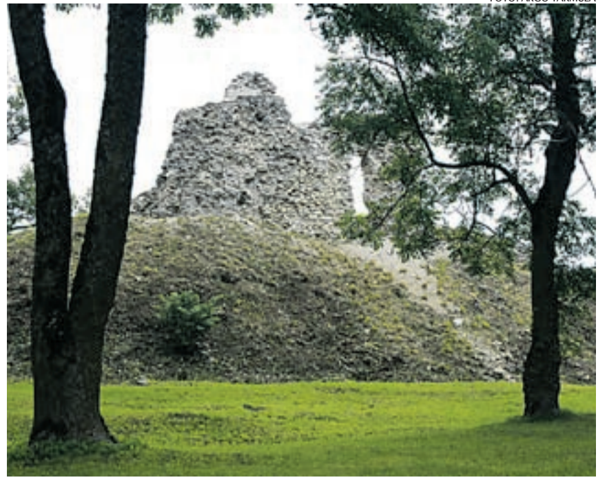
Linnus hävis Liivi sõjas ja on 17. sajandist varem.

REFORMIERAKOND Tõnismägi 9 10119 TALLINN