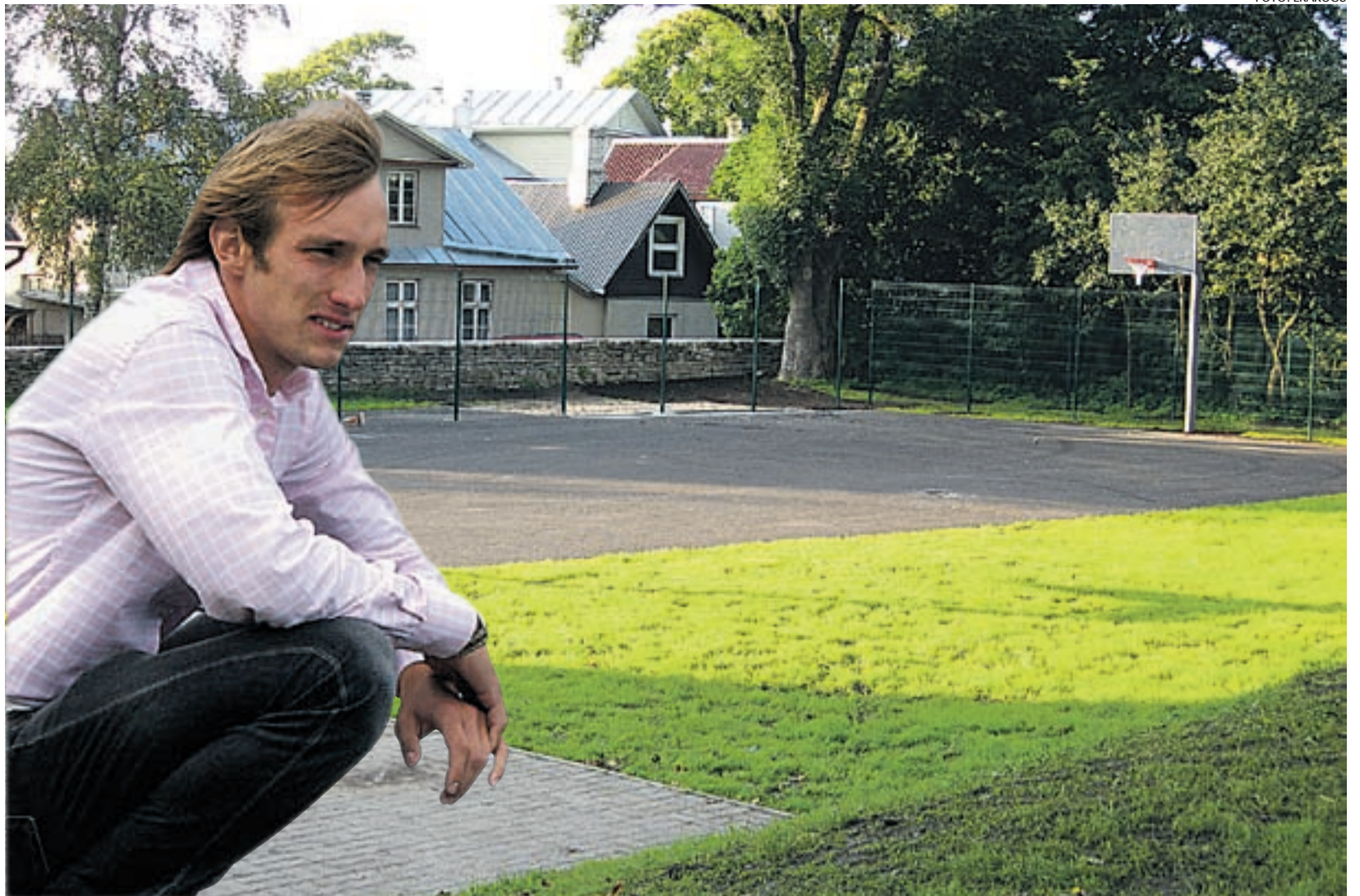
Mänguväljakut saavad kasutada kõik Haapsalu lapsed, kes seda soovivad.

Tasub tähele panna, et murrangulised muutused toimuvad praegu kogu maailma majanduses ja suuresti nende põhjustatud on ka Eesti majanduse jahatumine. Murrangulistel aegadel jagatakse turuosa ümber. Nii on just praegu paras aeg mõelda sellele, kuidas oma toodetega jõuda eksporditurgudele. Ja eksporditurgudena ei peaks ettevõtjad nägema mitte ebastabiilset idanaabrit, vaid Eesti partnereid ühises majandusruumis, Euroopa Liidus. Just selles oli Eesti riigi ja kõikide Eesti valitsuste kümme aastat kestnud pingutuse mõte Euroopa Liiduga liitumisel, mida tänaseks enam keegi ei kahetse. ETI