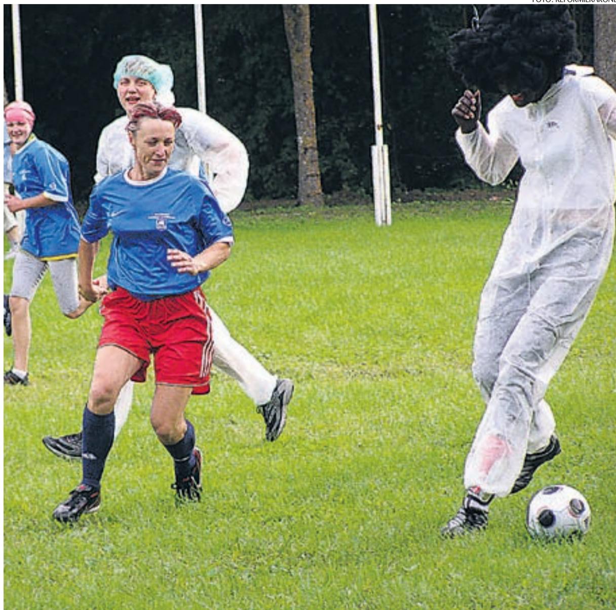
Kogu pere jalgpallipäev pakkus lõbusaid elamusi.

Päeva kõige tõsisemaks ja ka oodatumaks sündmuseks on meeste jalgpall, kus igal aastal on väljakutsujaks Saaremaa Reformierakonna meeskond ja vastu mängimas on kohalik