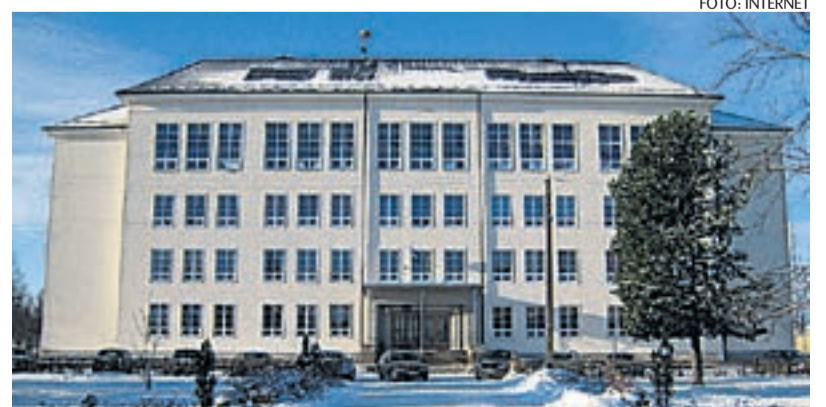
Pärnu Ülejõe Gümnaasium