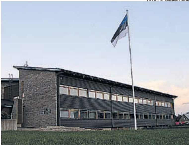
Uus lipuvarras Oru kooli ees tervitab koolilpasi.

Augusti keskel kingiti Oru koolile, vallamajale ja lasteaiale uued lipuvardad.