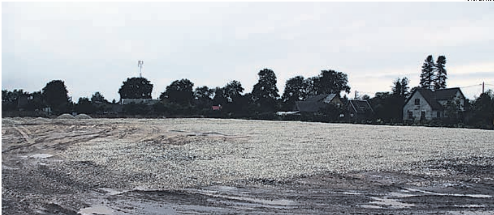
Varsti saavad jalgpallurid Risti uuel jalgpallistaadionil mängida.