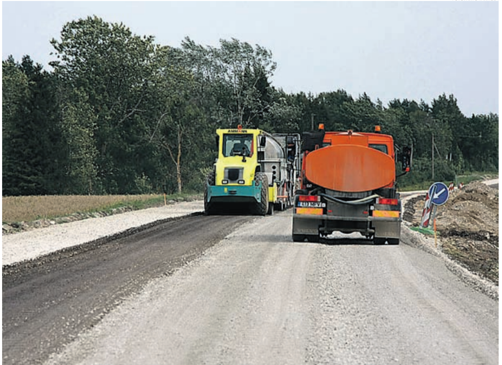
Rannaküla-Palivere teelõigu asfalteerimistööd algasid augustis.