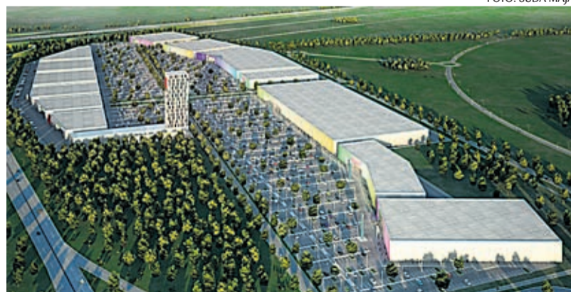
Ameerikanurga Äripark hakkab laiuma Tallinna külje all.

Et inimestele kaubandushoonele ligipääs mugavamaks teha, hakkab tulevikus Jüri alevit ühendama