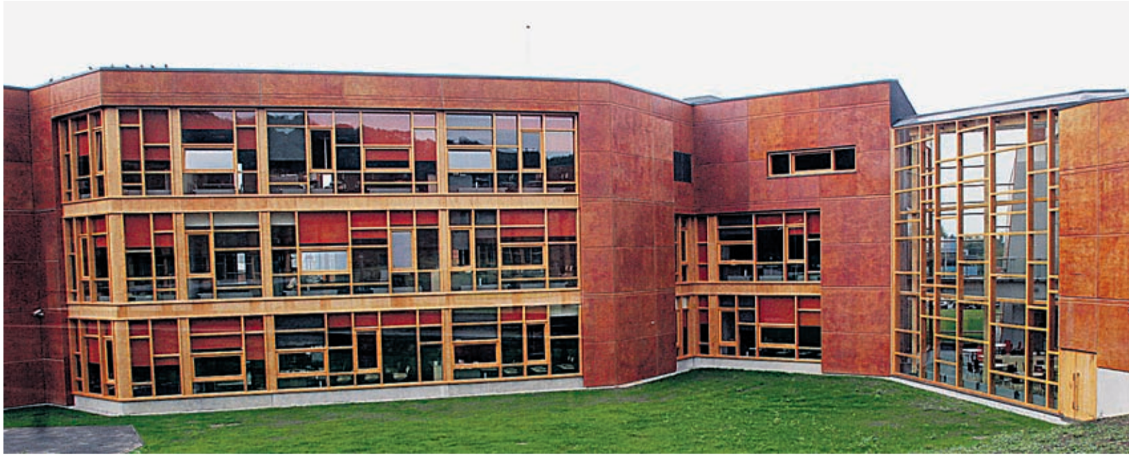
Viimsis 2006. aastal valminud koolimaja on juba väikseks jäänud.