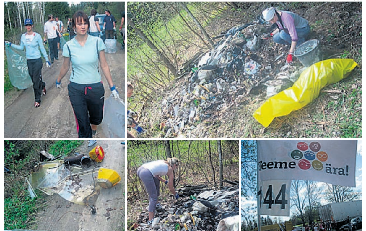
3. mail tehti metsaalused puhtaks.