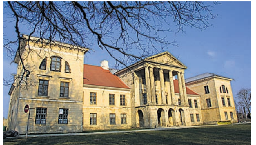
Kolga mõis väärib külastamist.

REFORMIERAKOND Tõnismägi 9 10119 TALLINN