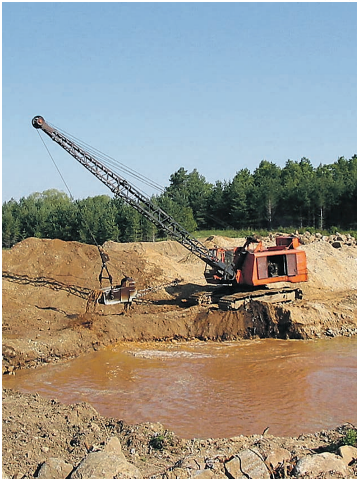
Kaevandusalad võiksid kujuneda tulevikus turismimagnetiteks.

Võimalusi, kuidas kaevanduspiirkondi turistidele atraktiivsemaks muuta, on kindlasti palju ning väga suurel