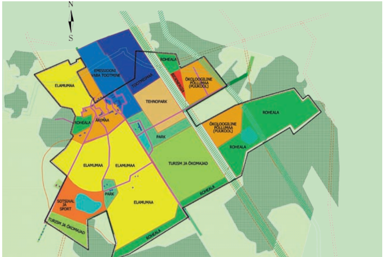
Kavandatud teaduslinnak on jõudnud detailplaneeringuni.

„Tegemist on elukeskkonnaga, kust leiab kõik eluks vajaliku,“ räägib Kal-