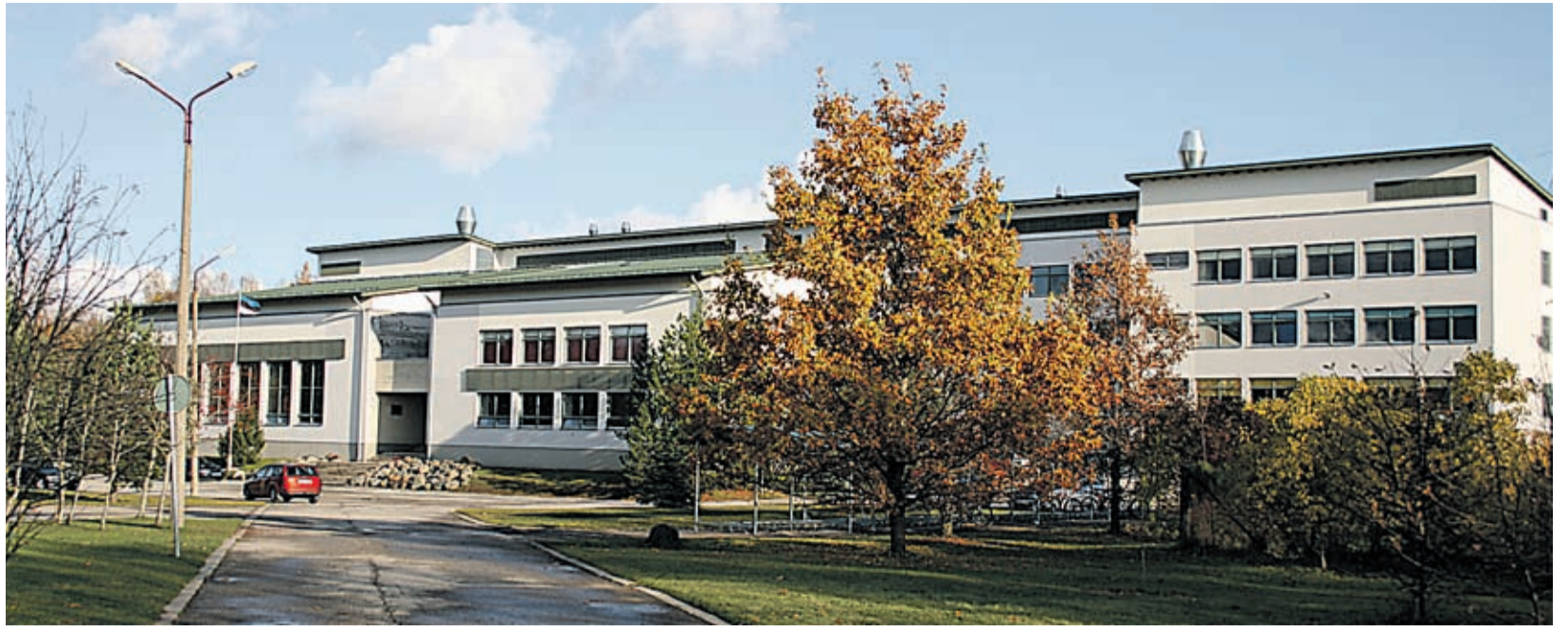
Rapla Vesiroosi gümnaasium uueneb.