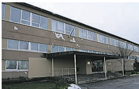
Vana kooli remont oleks läinud maksma peaaegu uue kooli ehituse raha, seepärast otsustas linn uue kaasaegse koolimaja ehitamise kasuks.

Otsuse uus koolimaja ehitada võttis Keila linnavolikogu vastu 2006.