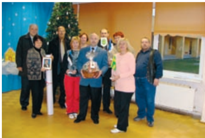
Seoses Eesti Vabariigi 90. aastapäevaga otsustas Jõgeva linnavalitsus oma hallatavatele haridusasutustele soetada Eesti Vabariigiga seonduvat sümbolikat. Koolidele osteti uued Eesti Vabariigi riigilipud, laualipud, Jõgeva linna laualipud ja vapid, Eesti kaardid, presidendi portreed ja Eesti rahvariete raamatud. Lasteaiad said vastavalt soovidele lisaks muud õppe- ja mänguvahendeid. Pildil Jõgeva linnavalitsuse esindajad koos lasteaiade Rohutirts töötajatega esemete üleandmisel.

“Olen isegi külastanud kunagist Jõgeva kino ja leian, et kino taastulek Jõgevale on igati tore. Arvan, et enamik noori on kuulnud kino tulekust Jõgevale, kuid ilmselt veel ei usu selle idee teostumisse. Tegelikult tunnevad nad kinost kodulinna väga suurt puudust. Paljud Jõgevamaa noormehed ja neid käivad kinos Tartus ja Põltsamaal. Küllap sooviksid noored, et Jõgeval linastuksid samad filmid mis suuremategi linnade kinodes. Kindlasti võiks filmide valikul arvestada noorte soovide ja eelistustega ning tasuks mõelda ka piletihinna taskukohasusele. Kinoseansid võiksid toimuda reedeõhtuti või nädalavahetusel. Mõistagi pakub kino võimalusi ka silmaringi avardamiseks ja enesetäiendamiseks. Arvestades seda võiks aeg-ajalt kooliõpilastele näidata õppefilme, millele järgnevat arutelud ja diskussioonid.”