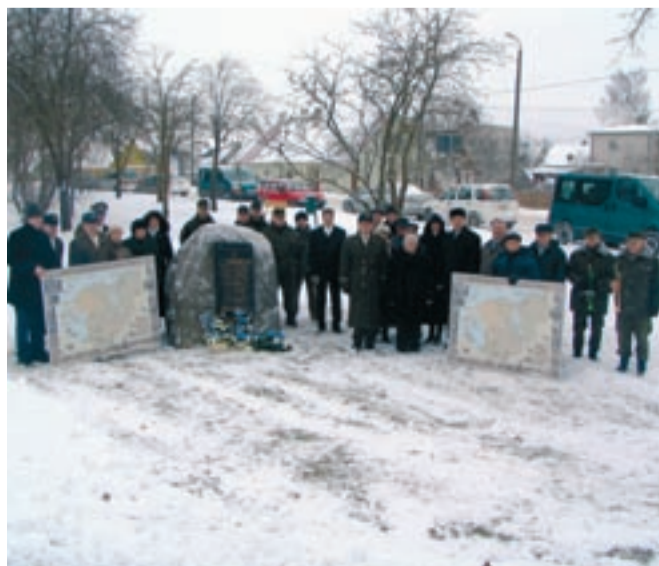
Mälestusetaht Vabadussõjas langenute mälestuskivi juures toimus 9. jaanuaril. Koolidele kingiti kaardid “Eesti Vabadussõda 1918 - 1920”.