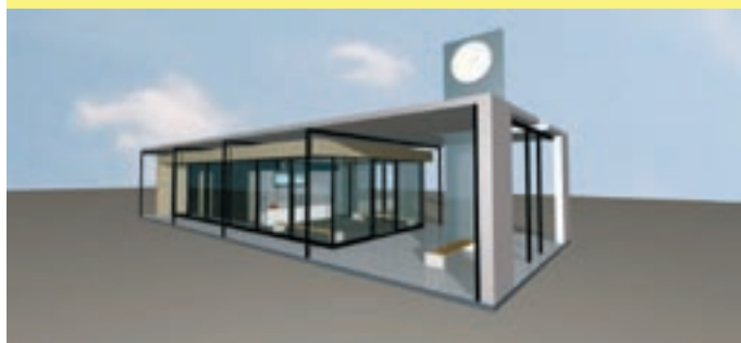
Selline peaks välja nägema Jõgeva uus bussijaam.

Ragn-Selss AS saadab ka vastavad teated.