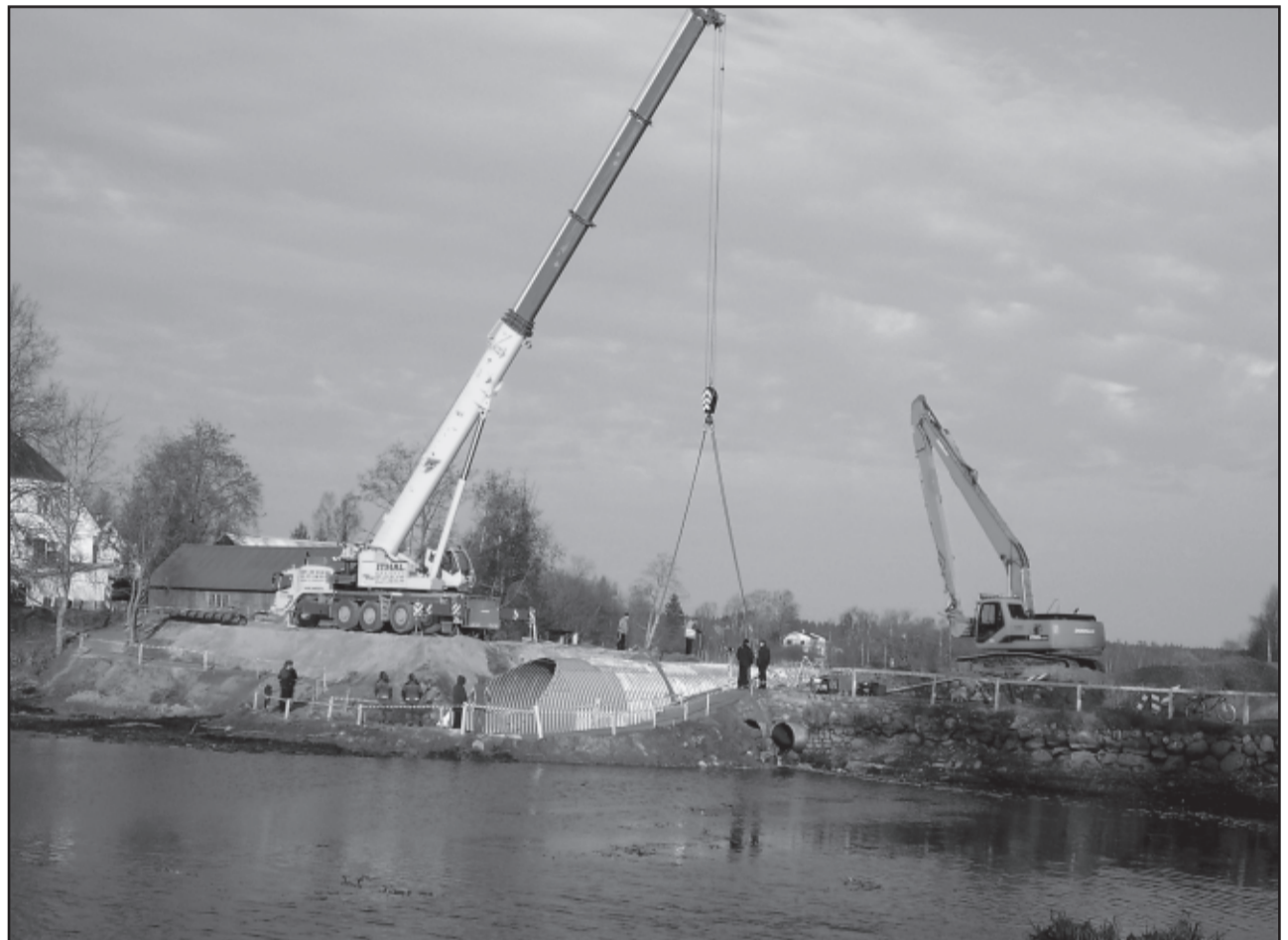
Vabaduse tänava sillale paigaldati 9. novembril ovaltruup.