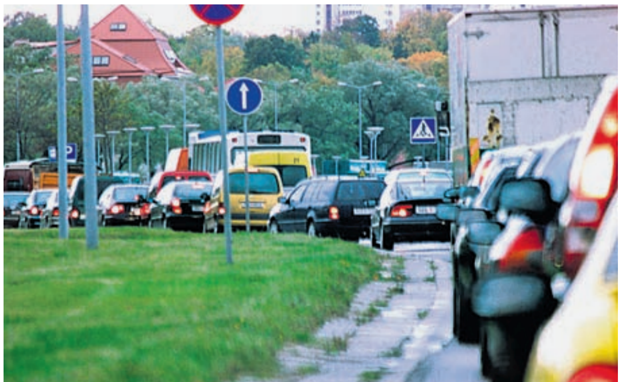
Igapäevaselt sõidab Tallinna tänavatel hulgaliselt ümberkaudsete valdade elanikke, kes töötavad või õpivad pealinnas.