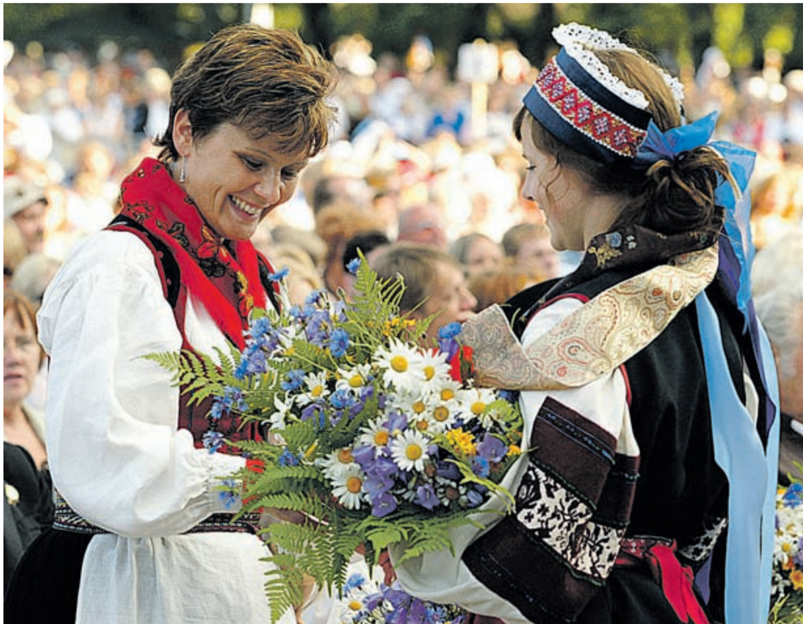
Kultuuriminister Laine Jänes loob, et uus ringirahasüsteem suurendab ka laulupeol osalevate koolinoorte arvu.