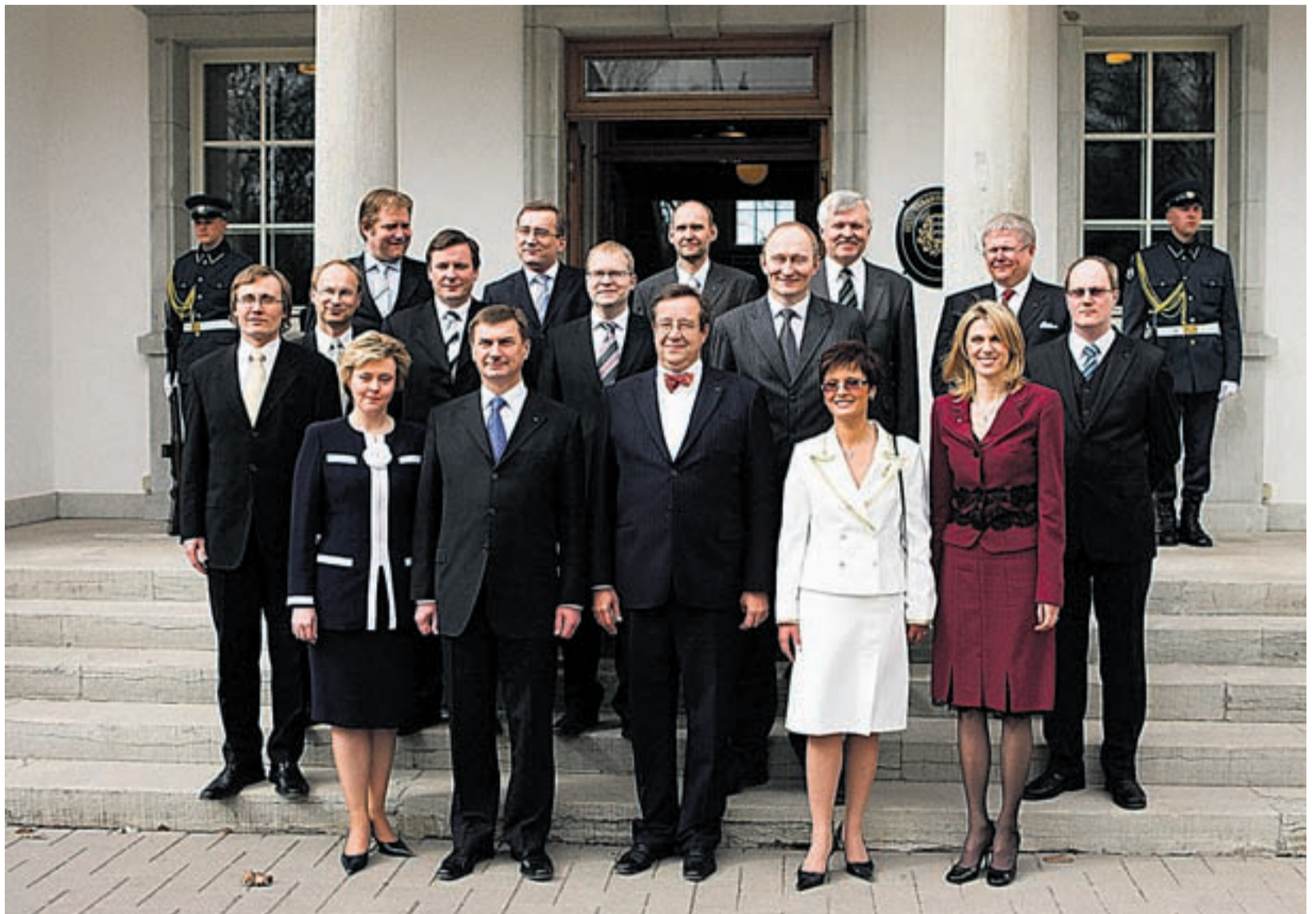
Aastatagune pildimeenus Andrus Ansipi valitsuse ametisseastumisest.

Töömessil, mille eesmärgiks oli viia kokku nii töötajad kui ka tööpakkujad, osales sadu ettevõtjaid ja töövajajaid. Messi korraldas Euroopa Komisjoni INTI projekti raames Kaubandus-Tööstuskoda koostöös Tööturuametiga, Integratsiooni Sihtasutuse ja Rahvastikuministri bürooga. Messil vahendati tööpakkumisi eri vanuses ja erineva hariduse ja keelteoskusega inimestele üle Eesti, pidades silmas niihasti kvalifitseeritud spetsialiste kui ka abipersonali, neid, kes on hetkel töötud, ja ka parema ja tasuvama töökohta otsijaid.