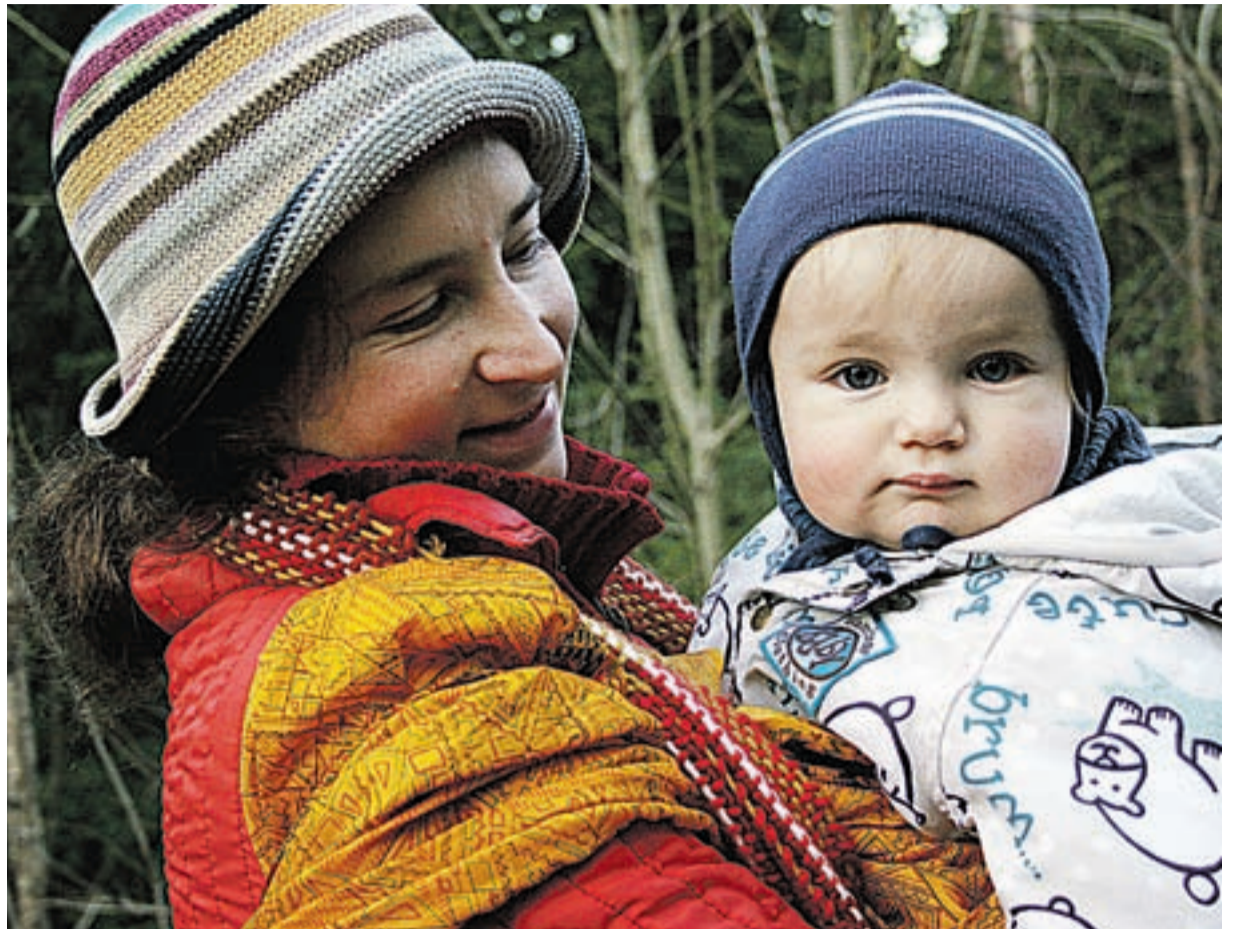
Laps toob peresse rõõmu.

Täna on sotsiaalministeerium saanud valitsuselt heakskiidu rakendus-