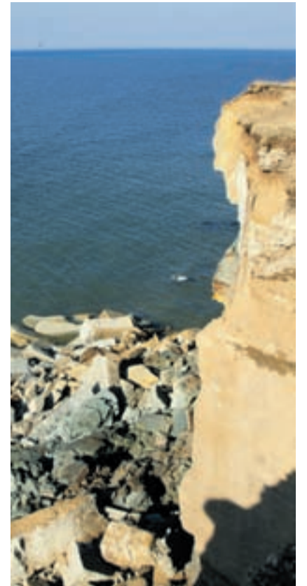
Pankrannik Paldiski lähedal.