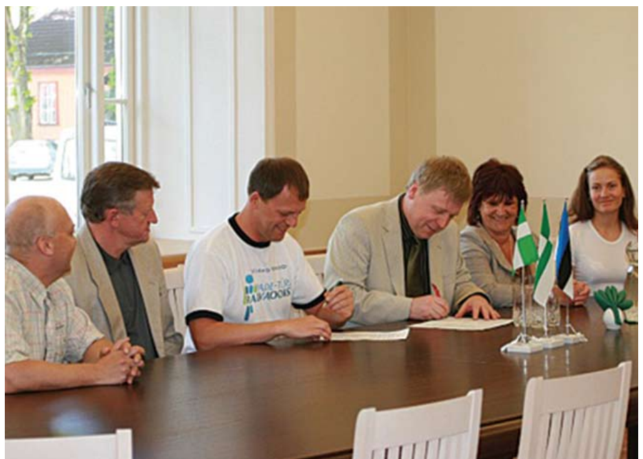
Paide raekojas allkirjastatud lepingu kohaselt toetab Viking Window sel sügisel juba 27. korda toimuvat Paide-Türi rahvajooksu viie aasta jooksul kokku miljoni krooniga.