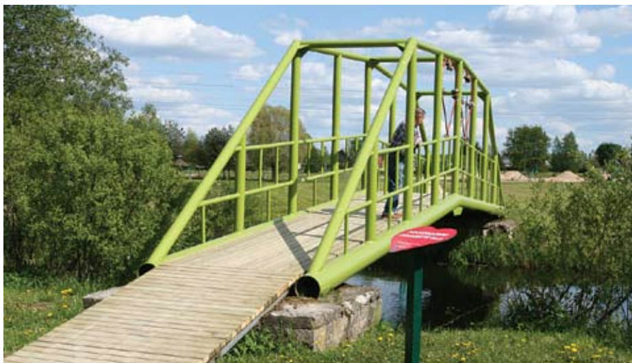
Tehisjärve sillad said uue laudise ja värvkatte.