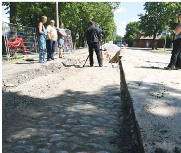
Pärnu tänaval bussijaama juures tuli asfaldi alt välja hästi säilinud munakivisillutis

Eelmisel nädalal tuli Keskväljakul kiriku veetrassi rajamise käigus keskaegsed müüriosa, mis võivad olla varem samal kohal olnud kuid hävinenud kiriku vundament.