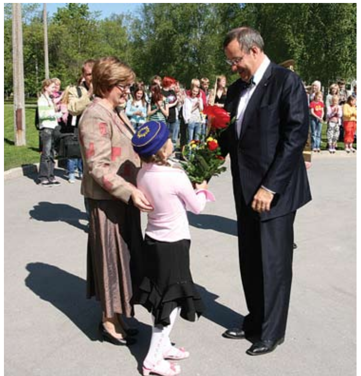
President Toomas Hendrik Ilves külastas PÜGD.