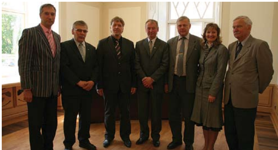
Paide ja Hamina linna juhid Paide raekojas.