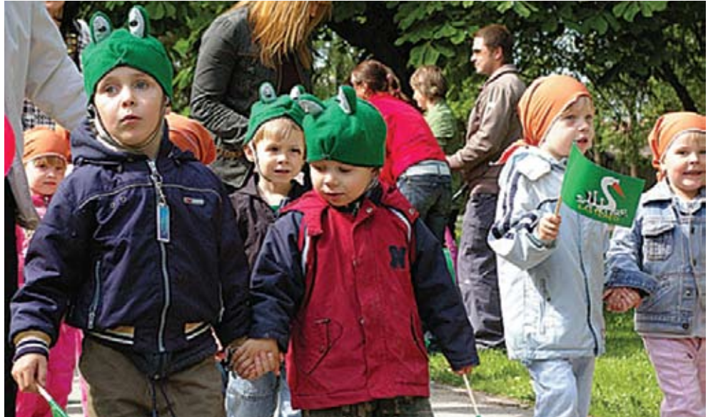
Sookure lasteaialaadunegi käinud lapsed suundusid kultuurikeskusesse kevadpeole traditsiooniliselt rongkäiguga.

Kevadpeo teises, personalile mõeldud osas esinesid ka Sookure lasteaialaadunegi käinud lapsed.