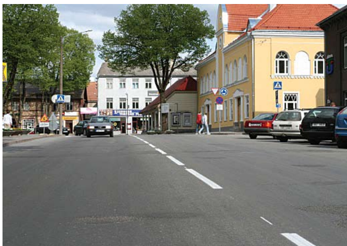
Tänavu värskendatakse teemärgistust kaks korda.