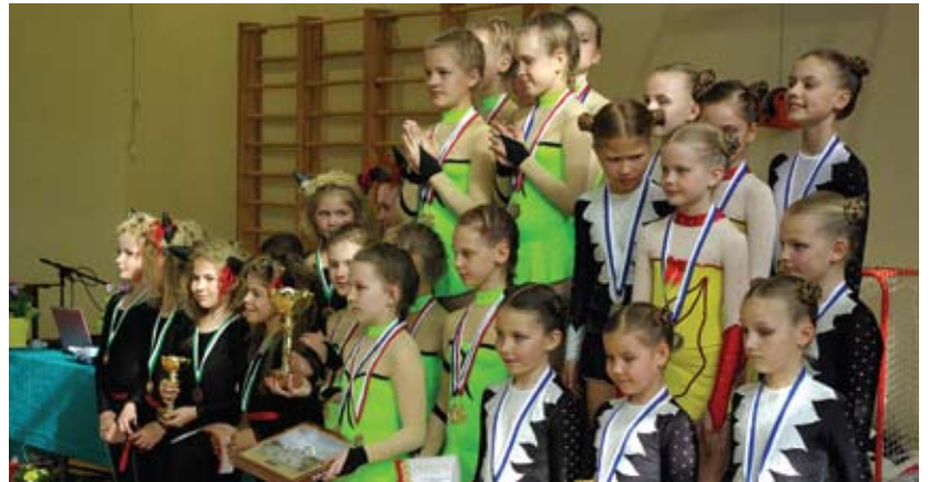
Paide iluvõimlemise meistrivõistluse paremik.