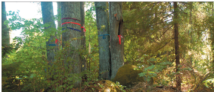
Värvilised paelad Vihula hiie puudel annavad tunnistust, et pühakoht on kasutusel.