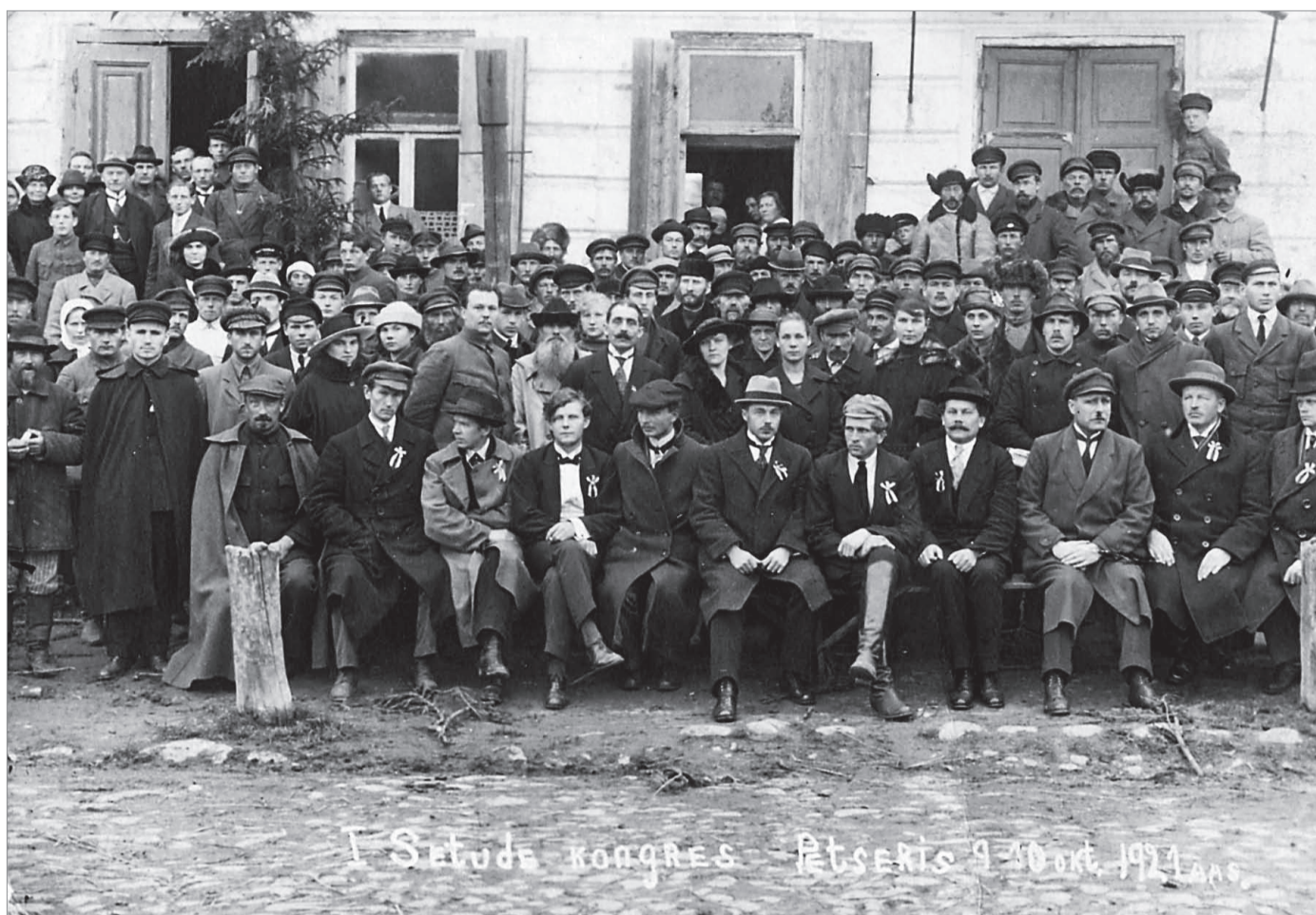
ESIMENE KONGRESS: I Setode kongress toimus Petseris 9.-10. oktoobril 1921. a. Hariduse Seltsi majas. Rahvast oli sedavõrd palju, et kõik delegaadid saali ei mahtunudki ning pidi sealtoimuvat väljast jälgima.

Toimõndusõl om õigus kirju toimõnda ja naid lühendä