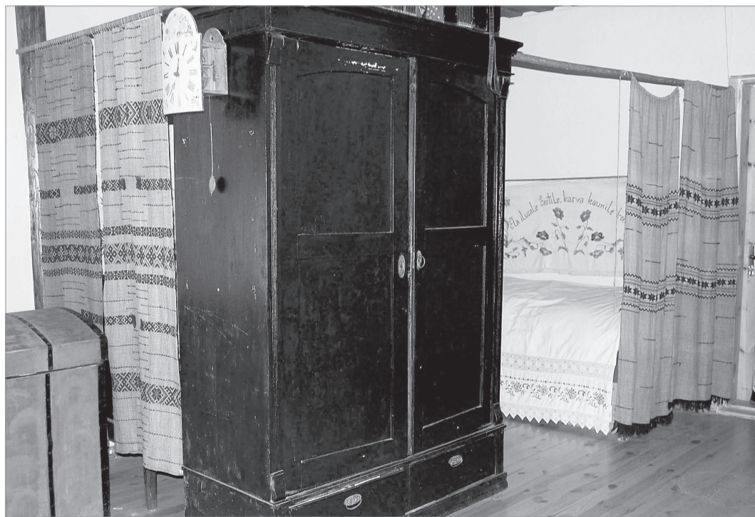
SÄNGÜNULK: Obinitsa Muuseumitare variandis.

jäigemad suled ära. Udusulgedel lõigati ära üksnes teravad otsad, et need läbi ride välja ei tuleks. See oli aeganõudev töö, mis oli tüdurukute ülesandeks. Selleks puhuks tulid nad maaseltsa nädalal (esimene nädal enne lihavõtteid) kokku ja hakkasid sulgi puhastama. Peamiselt olid kokkutulnuteks omad sugulased. Õhtul, kui töö tehtud, tulid külla ka poisid — mängiti pilli, lauldi ja tantsiti.