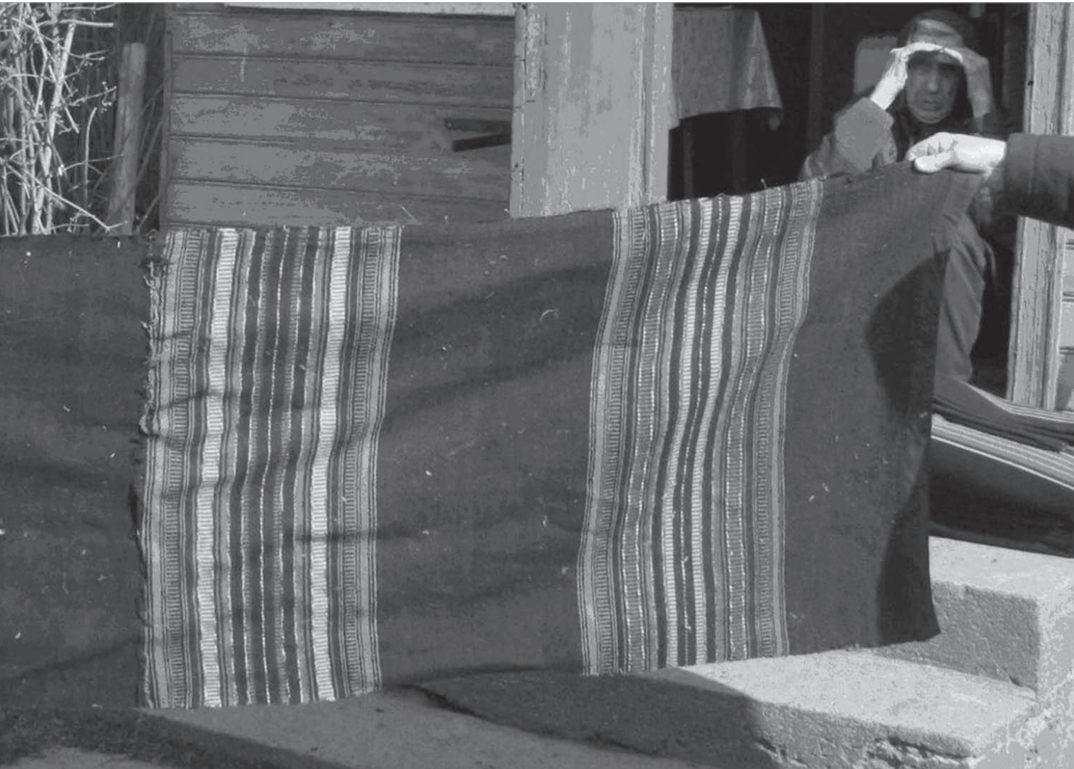
leva on kudunud Anne Tuul Kõõru külas.