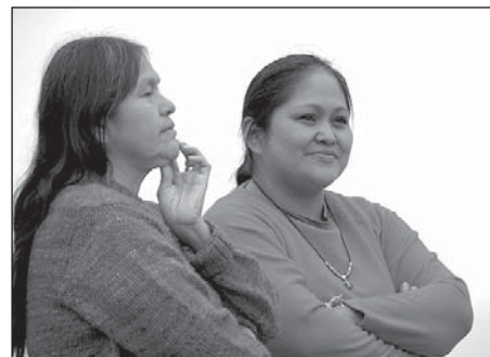
Indiaanisoost külalised möödunud aastases laagris.