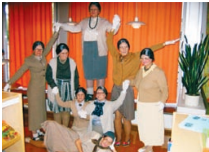
"The tädit" näitas, et raamatukogutöötajad on elurõõmsad inimesed.

Külmapealinna saadikuna oli minul võimalus üle anda meie linna logoga soe sall ja muidugi raamatud - "Eesti