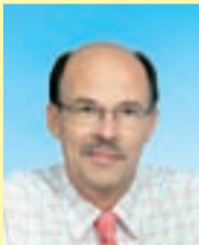
VIKTOR SVJATÕŠEV Jõgeva linnaapea