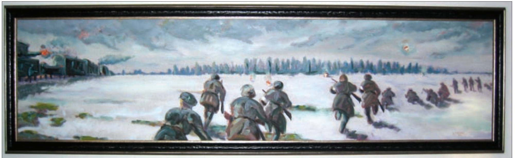
Koopia Maximilian Maksolly õlimaalist "Tapa vallutamise" (1919. aasta 9. jaanuari hommikul soomusrongilt nr 3 välja saadetud dessandi poolt Männikuräest läänes). Koopia on tehtud Soomusrongirügemendi fotograafi Karl Pomeistri foto ja "Eesti Vabadussõja" I osa värvilise repro järgi. Koopia õlimaalist (56 cm x 224 cm) maalib Soomes Hyyvinkä linnas kunstnik Eino Karjalainen 2006. aastal Jaan Viktori tellimusel.