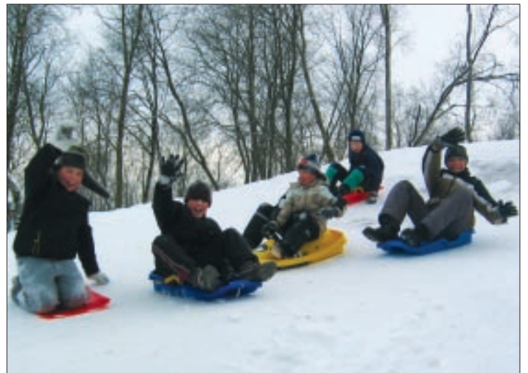
Eelmisel pühapäeval oli liumägi kelgutajaid täis.