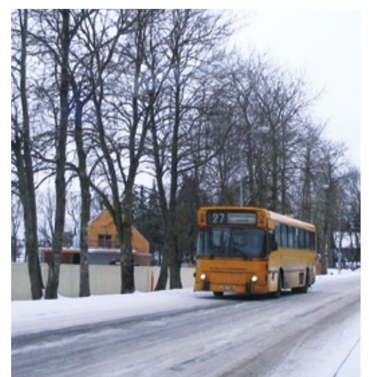
Bussiliini nr 27 pikendamisele eelnes Sütetsa tee rajamine koos kõnnitee- ja tänavavalgustusega.