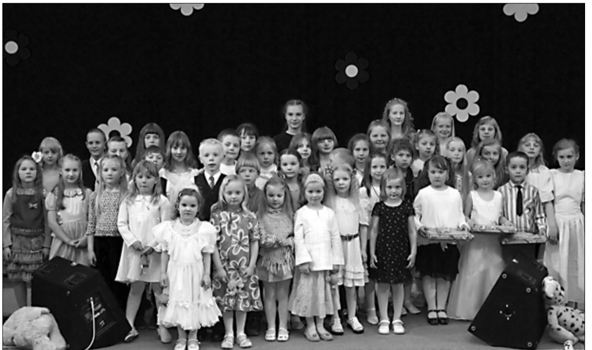
Lauluvõistluse nooremate vanusegruppide lauljad.