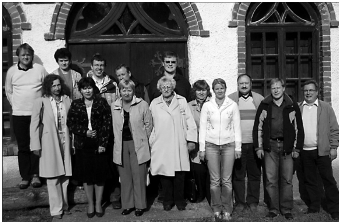
Vallaametnike juhtimiskoolitusel osalejad Heimtali mõisa juures.