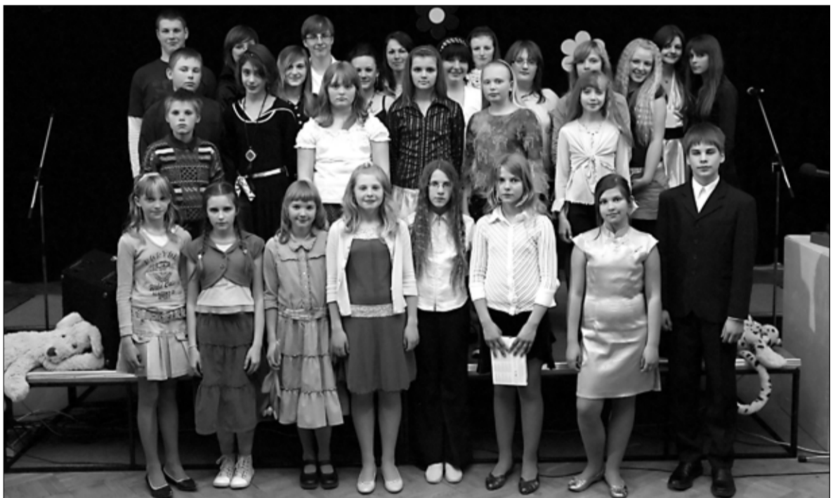
Lauluvõistluse vanemate vanusegruppide lauljad.